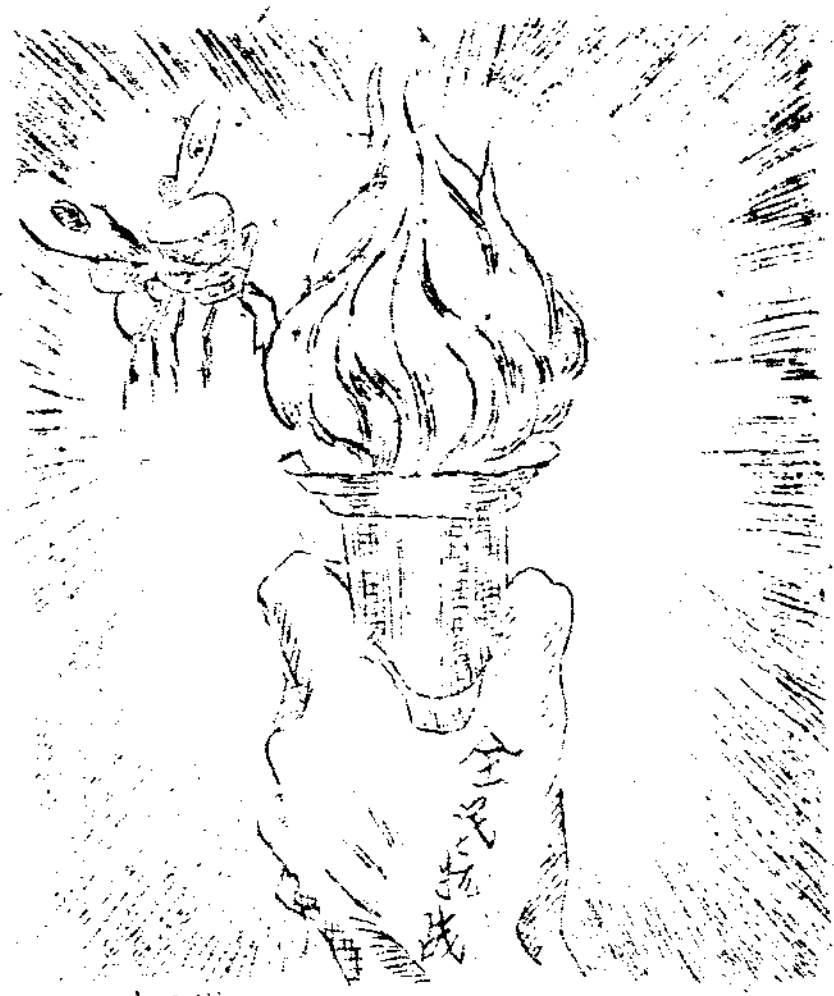
燈 燧 撲 火