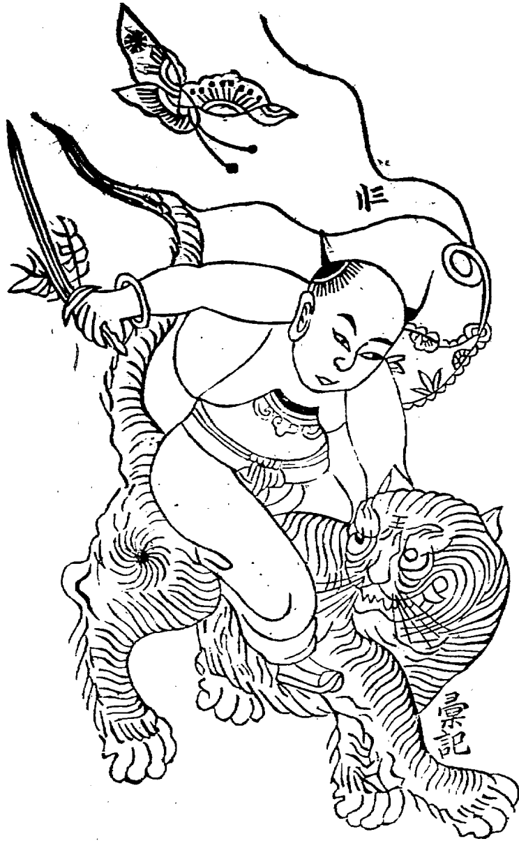
寧波端午老虎集選(一)

禮俗類。這一類與本刊的名稱恰巧相合，登在這里，也是 極妥當的事。全書或者可以在本研究所出版。