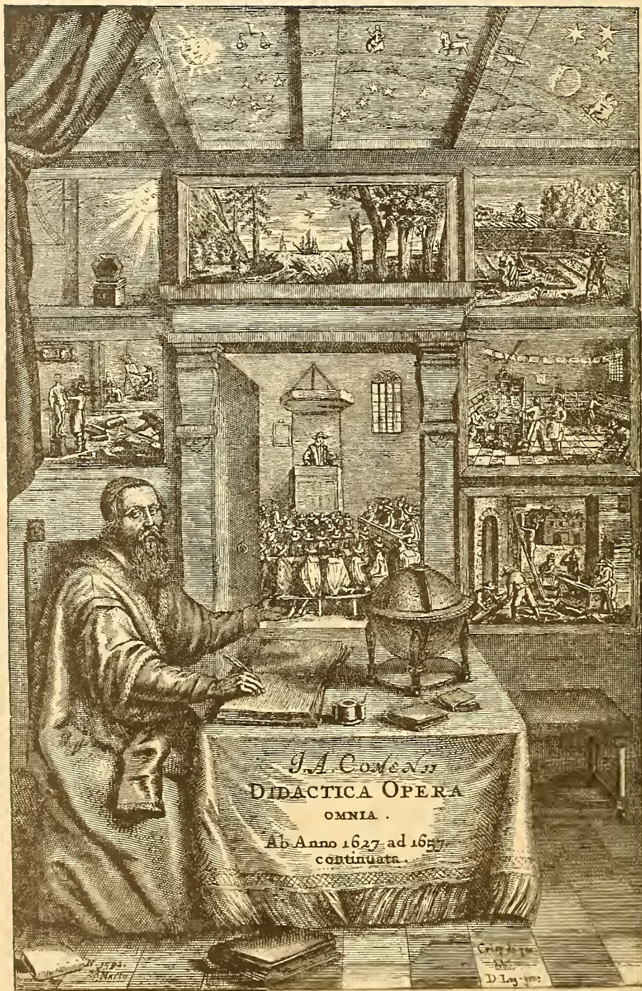
Titulní rytina „Sebraných spisů didaktických“.