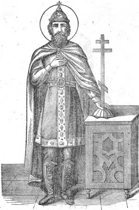
Св. Володимиръ, князь русскій.