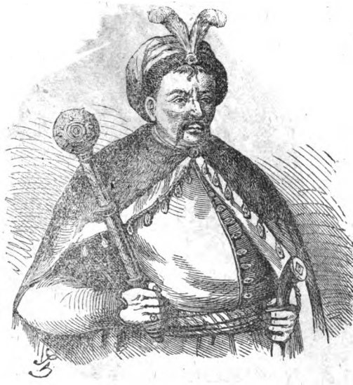
Гетманъ Богданъ Хмѣльницкій.