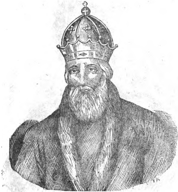
Великій князь Володимірь Мономахъ. см. стр. 61.