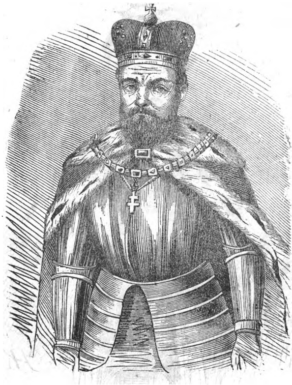
Галицкій князь Левъ.