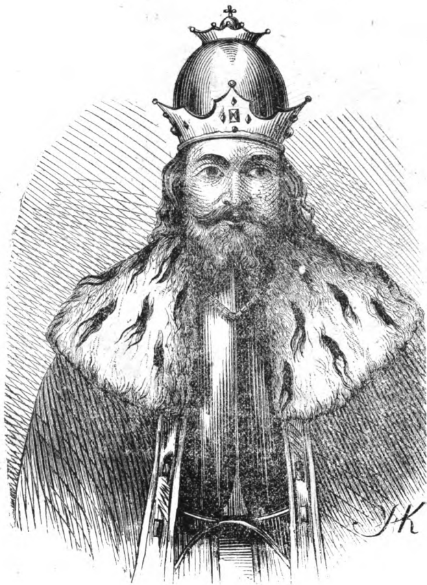
Галицкій князь Данило.