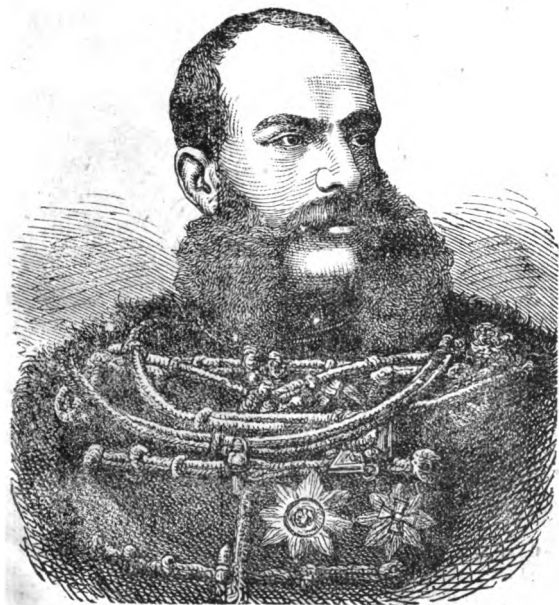
Цѣсарь Францъ Иосифъ I.