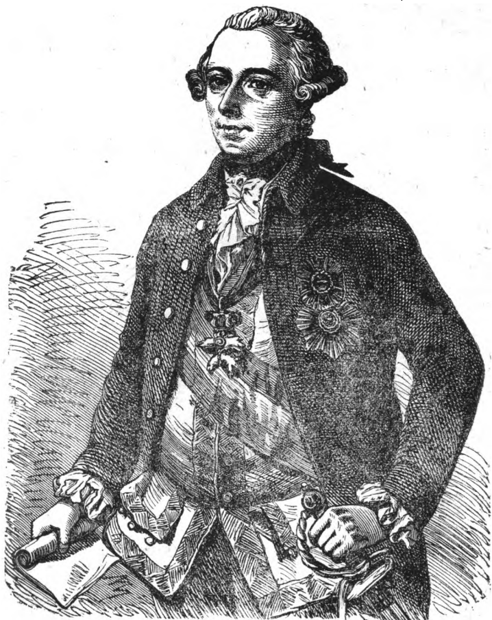
Цѣсарь Іосифъ II.