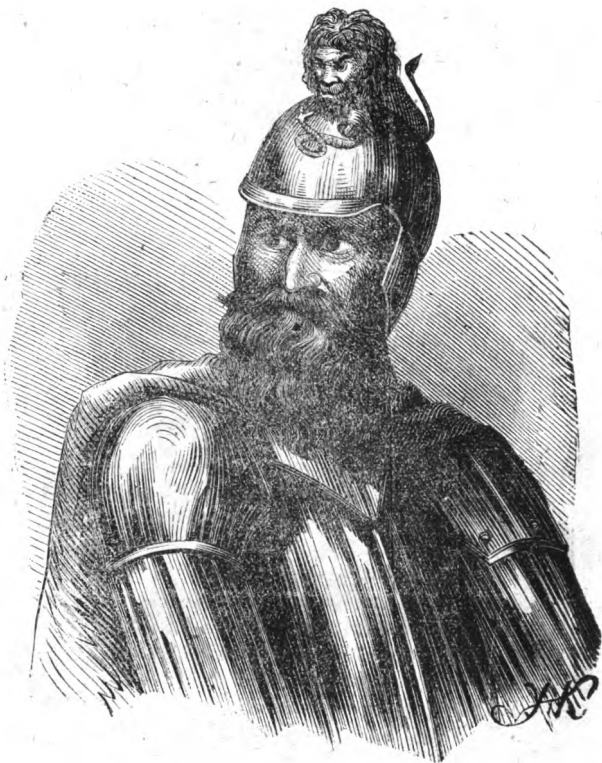
Князь Романъ Мстиславичъ.