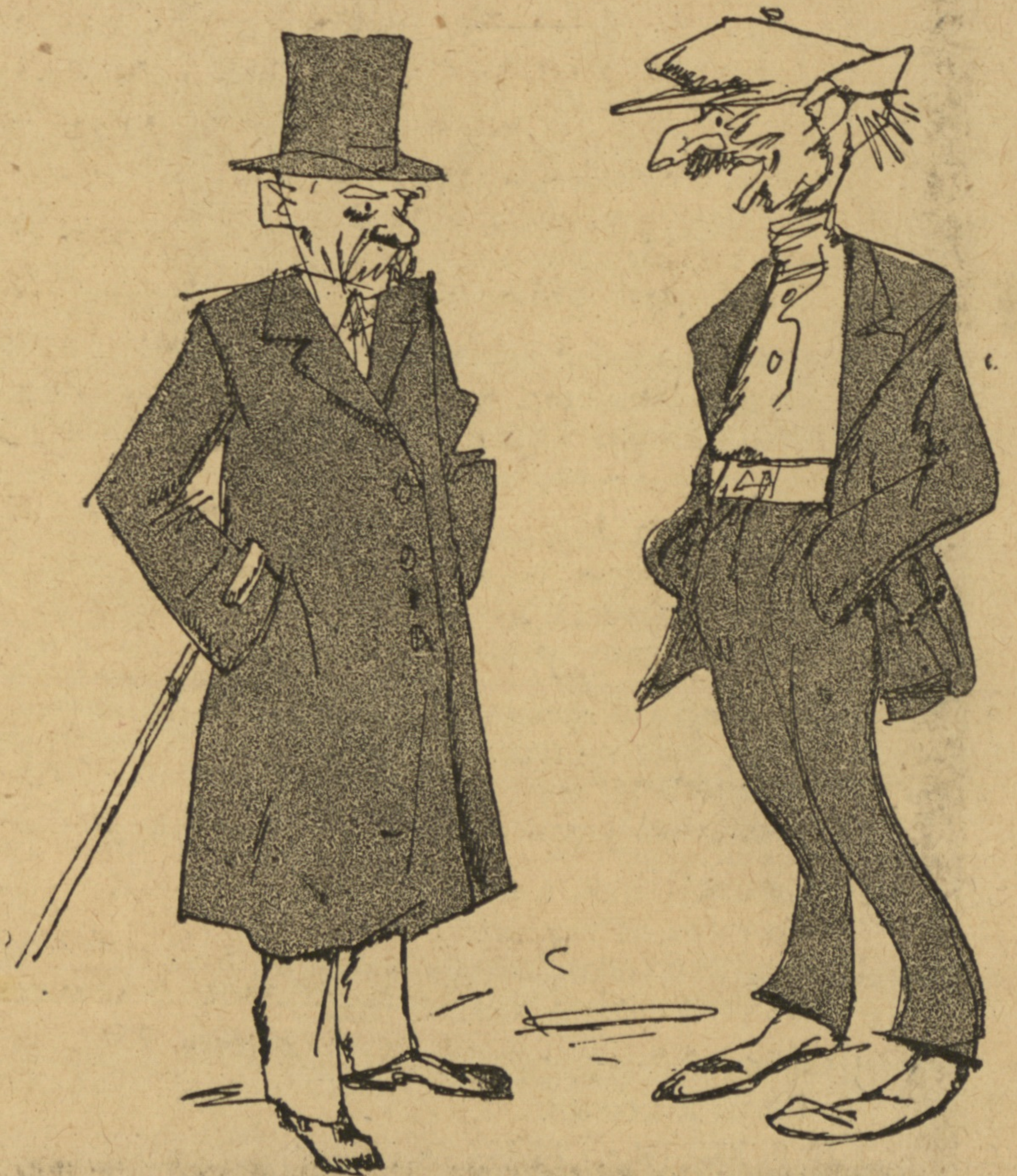
Рис. Н. Радлова.

Большевикъ. — Какъ ваша фамилія, иностранецъ?