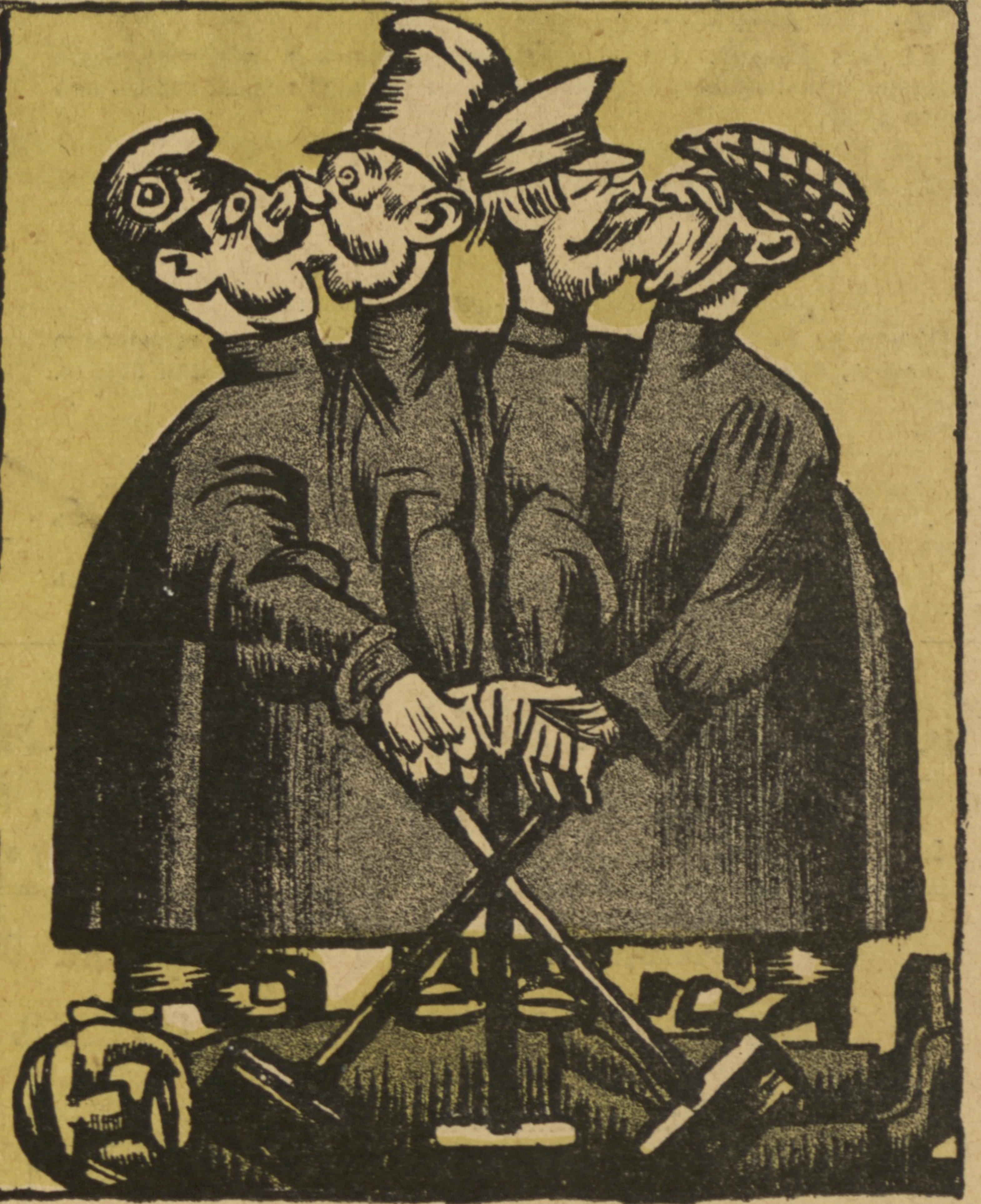
Нѣмецкій рабочій: — Приятно совмѣстно съ русскими рабочими подавить буржуа — къ слову сказать, тоже русскаго...