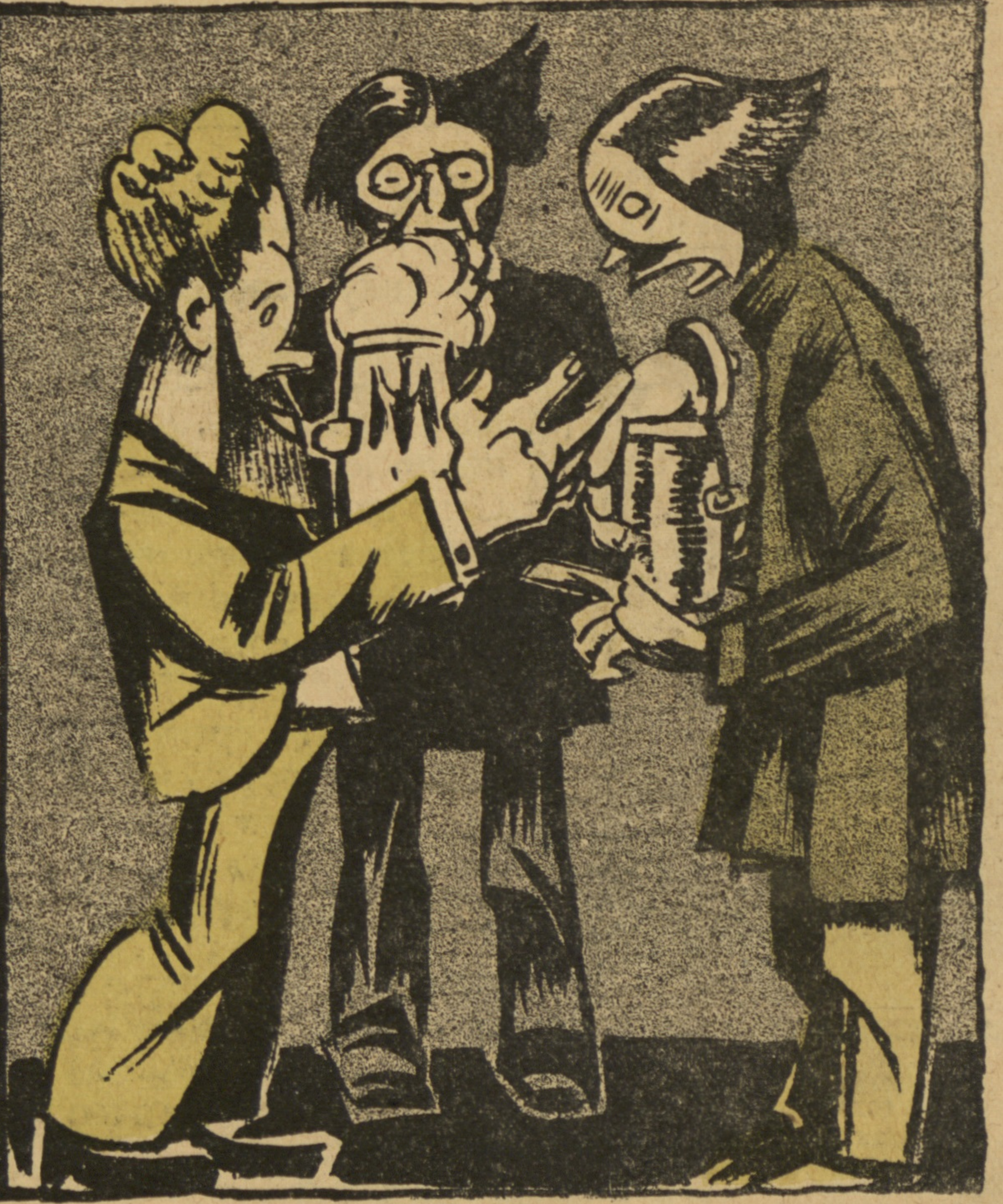
И только обывателю все равно съ кѣмъ спорить [о доктринахъ нѣмецкаго социализма, благо нѣмцы] народъ вѣжливый и полѣньями не дерутся...