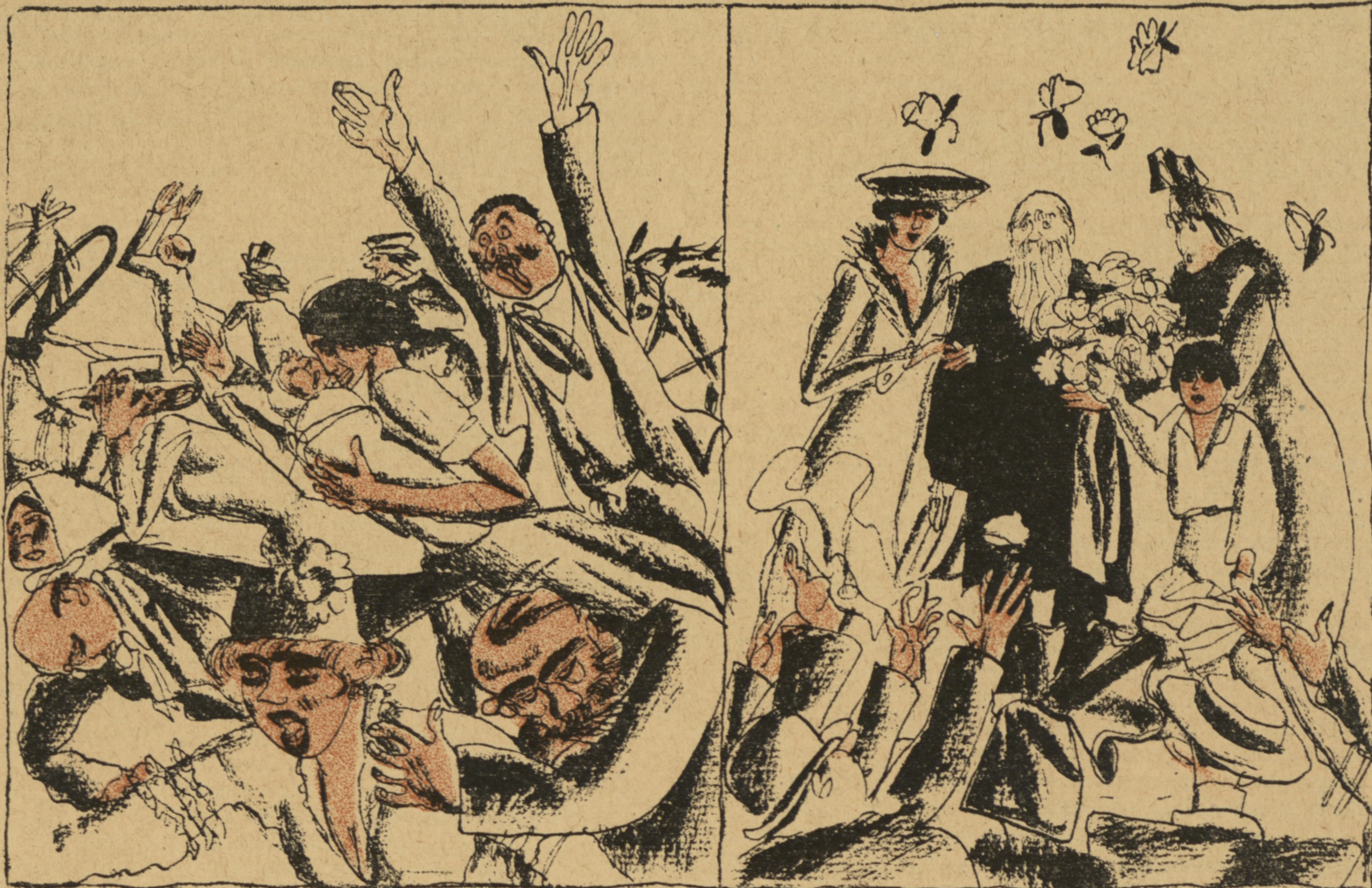
ПЕРЕДЪ ПРІЪЗДОМЪ КРОПОТКИНА.

— Граждане! Спасайся, кто можетъ! Главный анархистъ ъдетъ!