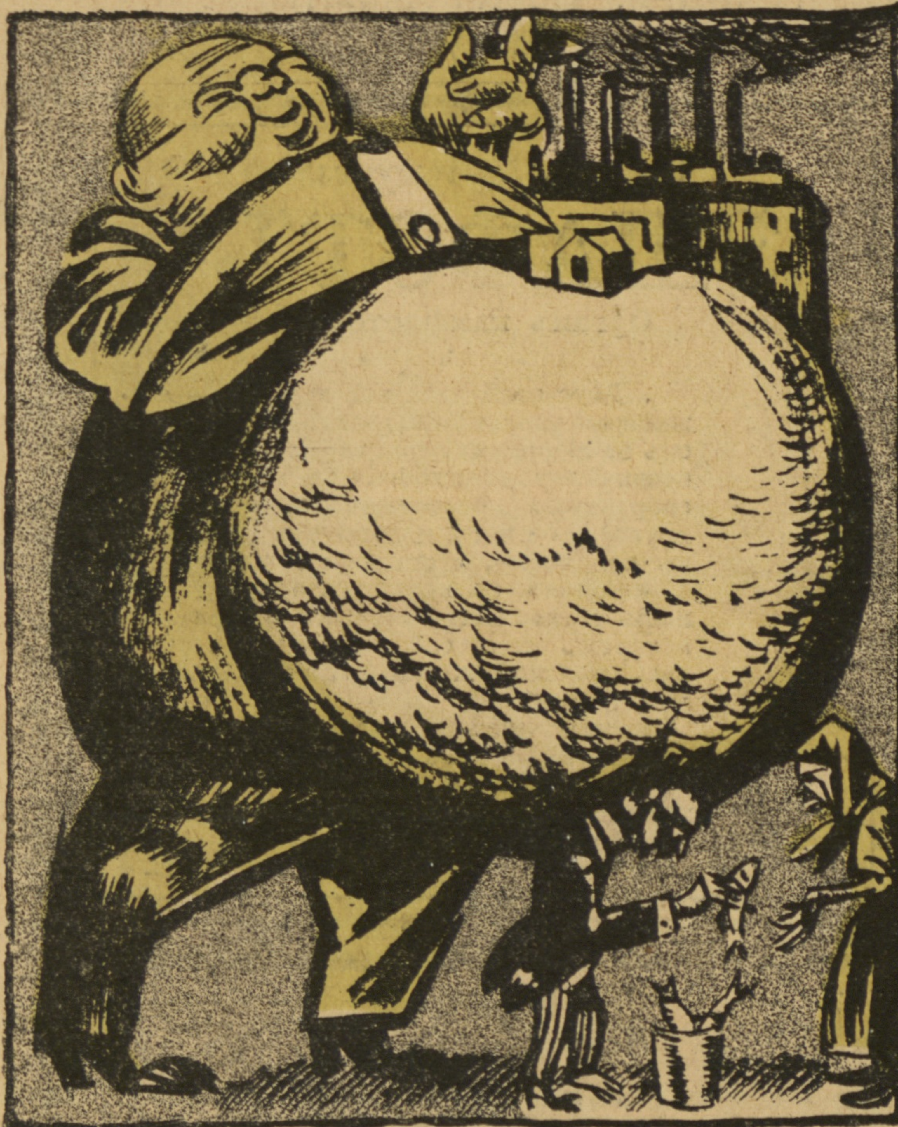
Нѣмецкій капиталистъ: — Кажется, я не очень сильно сдавилъ русскаго предпринимателя: онъ все-таки можетъ торговать селедкой на улицахъ.