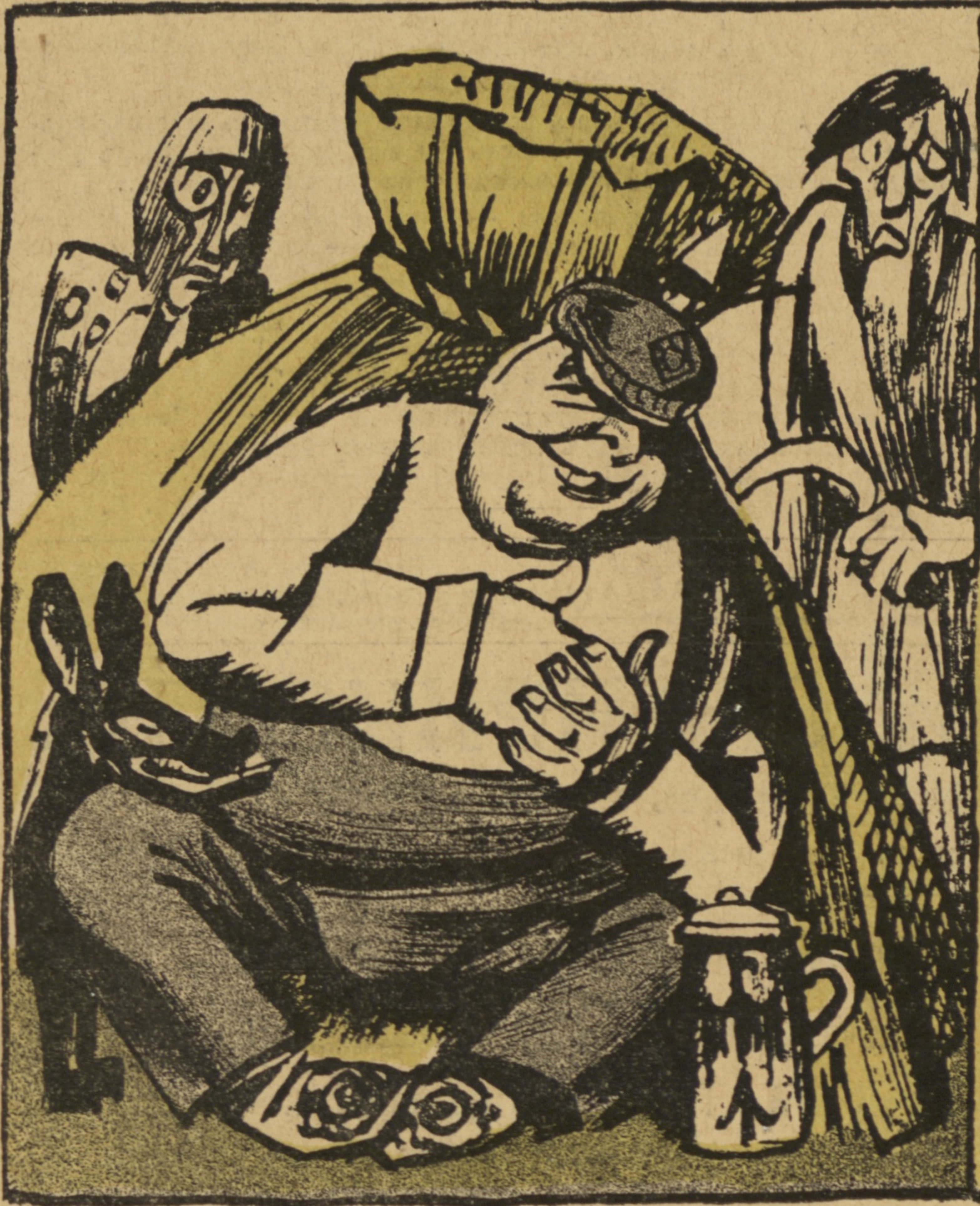
Нѣмецкій фермеръ: — Какъ сладко отдохнуть на своей собственности — русскомъ хлѣбѣ.