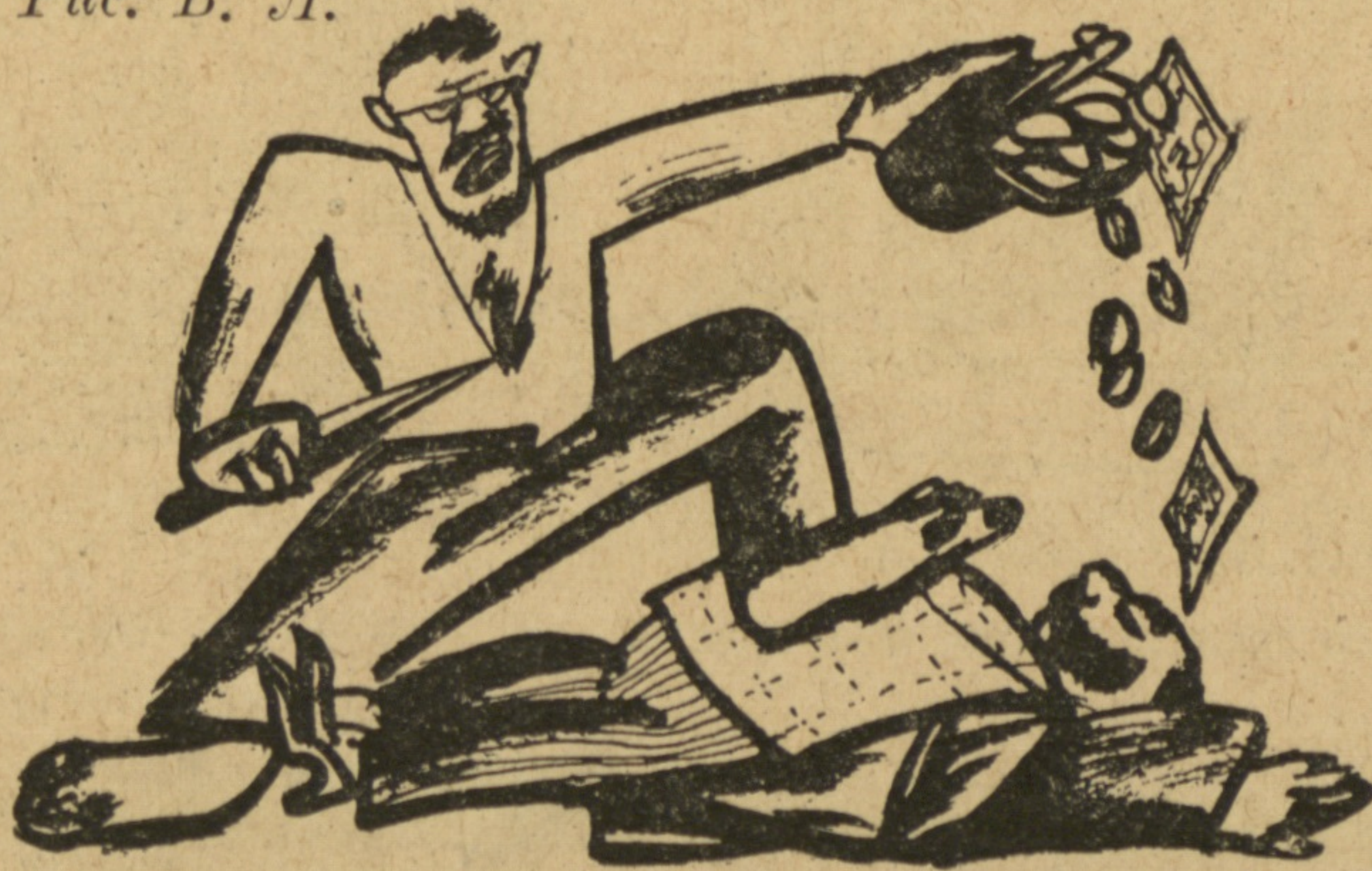
Рис. В. Л.

Остальные мелочи президентской жизни должны быть предоставлены такту самого президента.