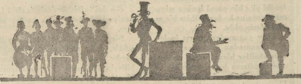
Dünyada mevcut altınların hangi milletlerin elinde olduğunu gösterir temsili bir resmi:

İngiliz lirası bugünden itibaren Borsada muamele görmeğe başlıyor