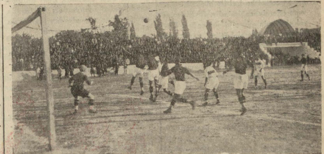
Sofya'da Türk - Bulgar millî takımlarının maçından bir enstantane: Bulgar kalesine korner

Sofya 27-28 Eylül (Sporculara re- fakat eden muharririmizden) — Herkes hayrette... Biz de, Yunan'lılar da, hatta Bulgar'lar da... Mağlûbi- yet hatıra gelebilirdi, fakat futbolu (Mabadi 3 üncü sahifede)