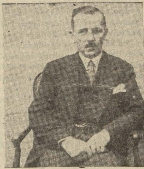
Saracoğlu Şükrü Bey

Mahreçleri darlaşan ve müşterileri azalan bir Avrupa'nın bugünkü nü-