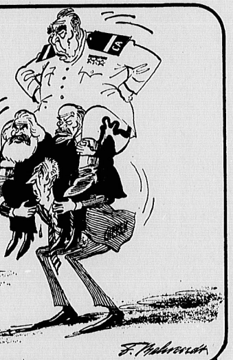
شما همگی سقوط خواهید کرد (کاریکاتور از: روزنامه لهستانی)