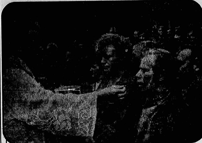
کارگران اعتصابی کارخانه کشتی سازی لینن در شهر دزسلاو زاک، لهستان، پس از موعظه در حضور اسقف کلیسای شهر.

بحران اعتصاب کارگران همسایه بودند البته کارگران ۱۹۴۰ لهستان تا به این بالا گرفته سبب دو سه دهه تفاوت بود که روسی کارخانه ها و رهنر عقیده پیدا کرده بودند باید بدانید حزب کمونیست لهستان برای شما در بین کشورهای اروپایی