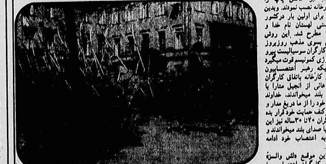
گمانه های کارگران اعتصابی با اعتصاب کنندگان

تند و واقعه ۱۹۵۳ آلمان شرقی و واقع ۱۹۵۵ مجارستان واقع ۱۹۶۸ یک اسلواکی تکرار شود کارگران لهستانی را کوچکتر از کارگران و مردم کشورهای عضو پیمان همکاری افاده دیگری سرزوری بردارند و آلمان شرقی در رهبران لهستان خواستند هرچه کارگران اعتصابی اعتراض بکنند و در وقت خنده و غلغله را بخوابانند از سوی دیگر کارگران اقتصادی اسلواکی و لهستان ورومانی در هم ریختن و بحران اقتصادی روری میهد و کارگران از همین بحران اقتصادی در روری میهد و کارگران کارخانه های ماشین سازی تیل شمال شرقی اروپا و ۲۰۰ هزاران از کارگران کارخانه بلورنگ و عاقدتوری و بلت