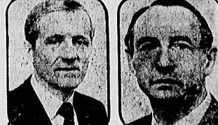
نخست وزیر لهستان طرف مذاکره با کارگران اعتصابی

بحران اعتصاب کارگران همسایه بودند البته کارگران ۱۹۴۰ لهستان تا به این بالا گرفته سبب دو سه دهه تفاوت بود که روسی کارخانه ها و رهنر عقیده پیدا کرده بودند باید بدانید حزب کمونیست لهستان برای شما در بین کشورهای اروپایی