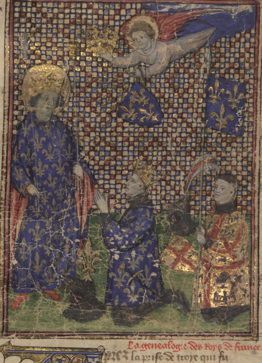
La genealogie des roys de France

PAR M. Le docteur Diction map - Meaus de M. 7107.