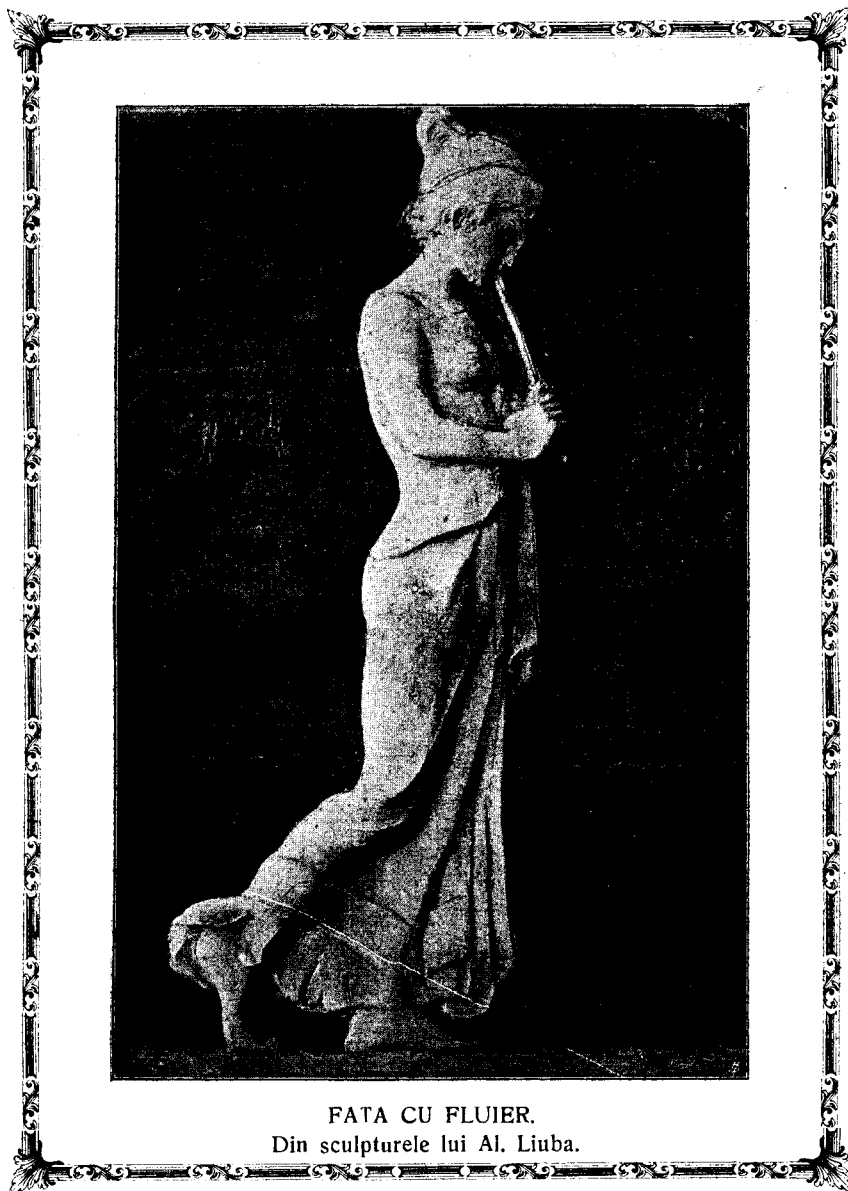
FATA CU FLUIER. Din sculpturile lui Al. Liuba.

Un alt izvor e „Geschichte der Griechen“ de dr. J. F. Hertzberg, Berlin Tom. II p. 112. Icoana arată scena de învățare în școală. O femeie (veronismul învățătoarea) suflă în fluier dublu. Tot acea istorie, „Geschichte der Römer“ Tom. III. p. 18. Într'o pictură de părete, ce se află la Roma în Vatican, în șirul de jos, figura a treia, e o femeie, care suflă în tibiae gemine. S'ar putea aduce și mai multe date, dar acestea apar a fi destule, pentru a dovedi că și la Greci și la Romani, precum la Etruci, a fost în modă, ca fetele, femeile