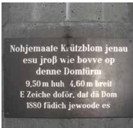
Inscription auf Kölsch (Bordeaux, https://commons.wikimedia.org/wiki/File:Inscription_Kreuzblume.JPG )