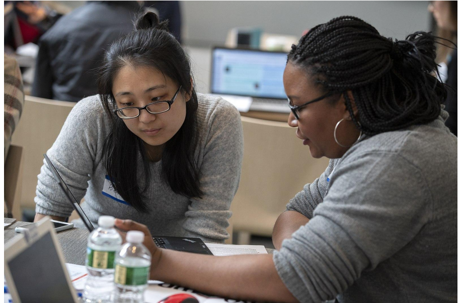
Manuel Molina Martagon, CC BY-SA 4.0, via Wikimedia Commons

Per i nuovi organizzatori , vogliamo che sia più facile diventare organizzatori più efficienti nel lungo termine.