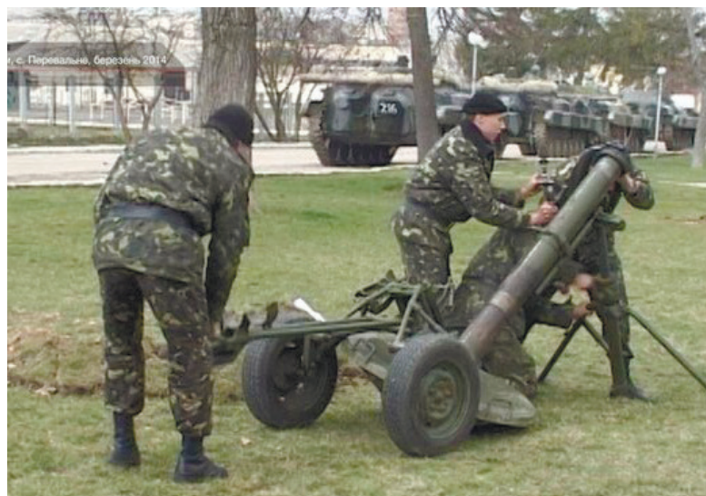
Українські військові готують зброю до ймовірного нападу. Перевальне, березень 2014 р.

«п'янки» чи інші надумані правопорушення – у нашому «досконалому» законодавстві про проходження служби про звільнення за власним бажанням немає ні слова. Покажем є те, що на той час у бригаді було всього три військовослужбовці строкової служби – усі колишні контрактники, переведені на строкову службу за вживання наркотичних речовин – коноплі. І от ці військовослужбовці також вирішили залишитись і не кидати своїх товаришів по службі в скрутну хвилину, хоча їх мали відправити в іншу частину, на материк.