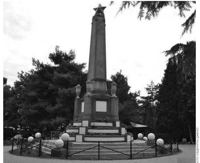
Пам'ятник першому уряду Республіки Тавриди на братській могилі членів Раднаркому та інших діячів Радянської Соціалістичної Республіки Тавриди, які були розстріляні 24 квітня 1918 року

німців з Україною, допомога Криму, який (Крим) німці можуть побіжно з'їсти, є не тільки актом сусідського обов'язку, але й вимогою самооборони та самозбереження. Можливо, що Слуцький не зрозумів усієї складності ситуації, що склалася, гне яку-небудь іншу спрощену лінію – тоді його треба осадити рішуче, пославшись на мене. Негайне... створення єдиного фронту оборони від Криму до Великої Росії, залучення у справу селян, рішуче і безу-