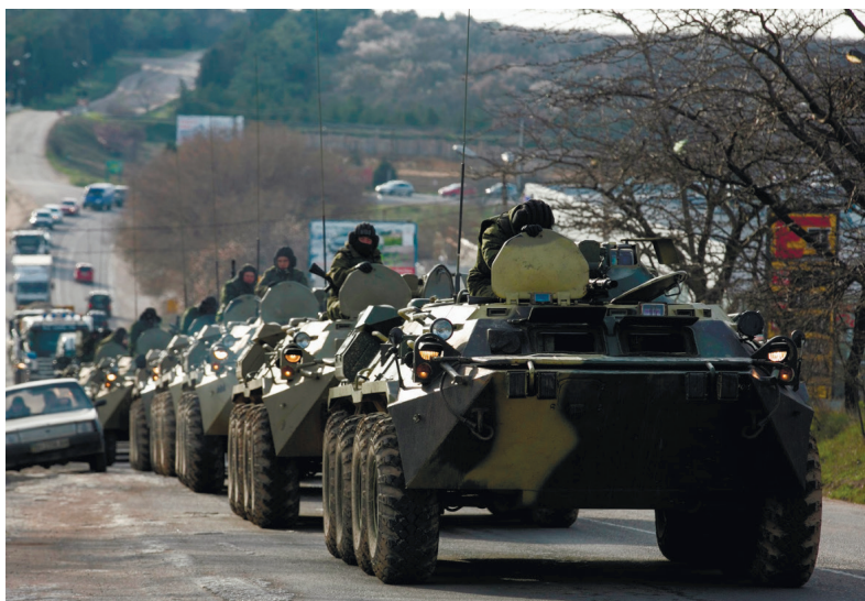
Російська військова техніка на дорогах Криму, березень 2014 р.