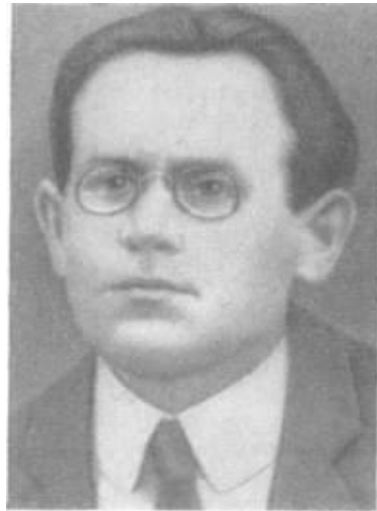
Антон Іосифович Слуцький, голова Раднаркому Республіки Тавриди

Така позиція Слуцького викликала гостре незадоволення В. Леніна. У надісланому 14 березня листі до надзвичайного комісара України С. Орджонікідзе він писав: «Дуже прошу вас звернути серйозну увагу на Крим та Донецький басейн з метою створення єдиного бойового фронту проти наступу з Заходу. Переконайте кримських товаришів, що хід речей нав'язує їм оборону, і вони повинні оборонятися незалежно від ратифікації мирного договору. Дайте їм зрозуміти, що становище Півночі суттєво відрізняється від становища Півдня, та з огляду війни, фактичної війни