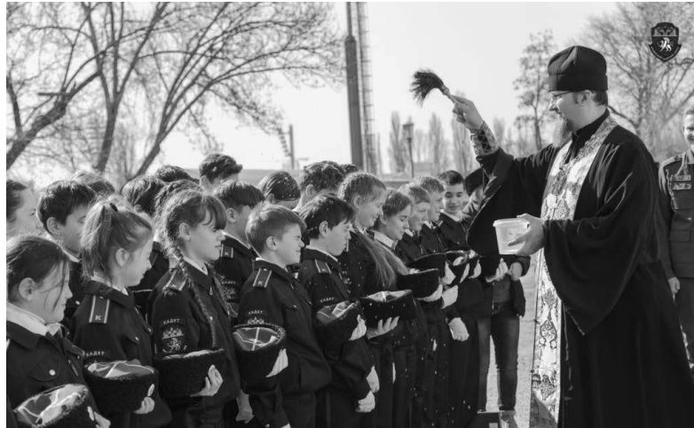
Священик узяв участь у церемонії відкриття спартакиади кадетів Кримського окружного «казачого війська»