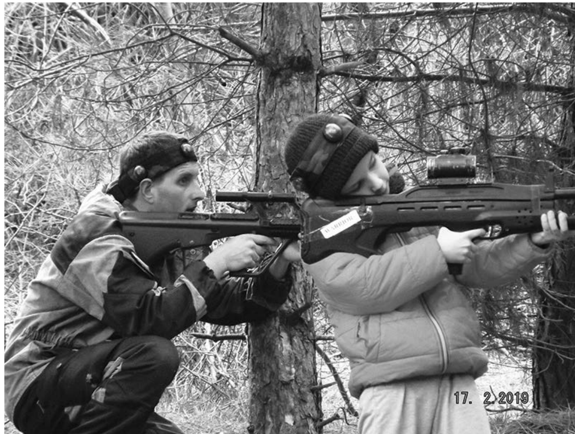
Практичне заняття загону православних розвідників-слідопитів севастопольського храму Вознесіння Господня

12 квітня за благословенням архієпископа Джанкойського і Роздольненського УПЦ МП Аліпія священники Красногвардійського благочиння (цікава назва, між іншим) узяли участь у «дні призовника», що відбувся у Красногвардійському палаці культури; під час заходу о. Олександр Легач побажав кримським призовникам, що йдуть до окупаційного війська, бути «гідними воїнами своєї вітчизни». 15 квітня, знов-таки за благословенням архієпископа Аліпія, керівник епархіального відділу із взаємодії з військови-