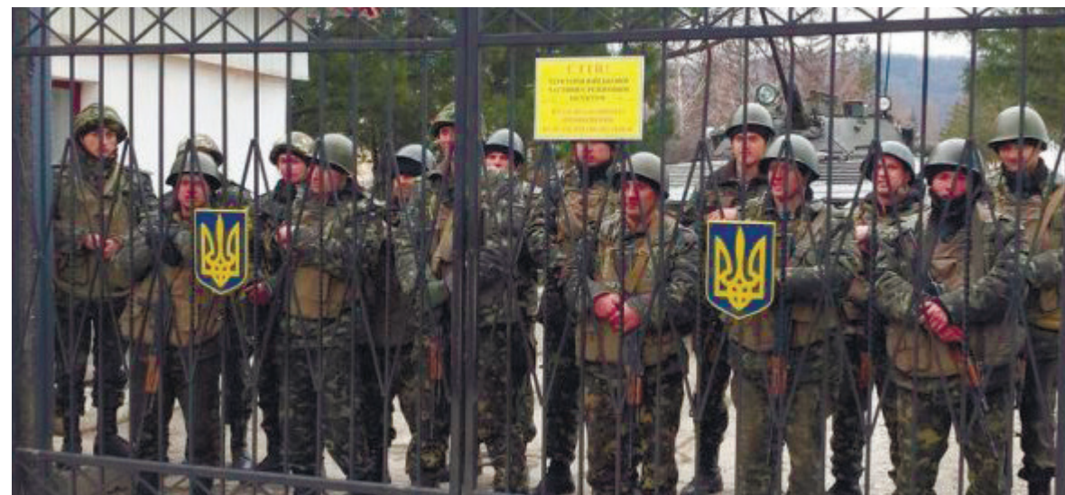
Перевальне, 2014 р.

стини. Росіяни одразу ж виставили охорону з озброєних людей біля усіх КПП та в'їздів до парків, розставили вогневі точки на висотах навколо частини. Ми мовчали... зброя на руках була лише у чергового підрозділу і варті – близько 15-20 стволів.