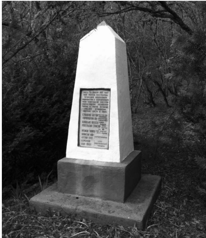
Пам'ятний знак на місці розстрілу членів першого уряду Республіки Тавриди

«Дайте їм зрозуміти, що становище Півночі суттєво відрізняється від становища Півдня, та з огляду війни, фактичної війни німців з Україною, допомога Криму, який (Крим) німці можуть побіжно з'їсти, є не тільки актом сусідського обов'язку, але й вимогою самооборони та самозбереження... Негайне... створення єдиного фронту оборони від Криму до Великої Росії, залучення у справу селян, рішуче і безумовне перелицювання наших частин, які перебувають на Україні, на український лад – таке тепер завдання...»