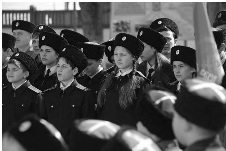
Спартакиада «казачої» молоді допризовного віку

що наступна група майбутніх «юнармійців» складатиме «присягу» наприкінці квітня.