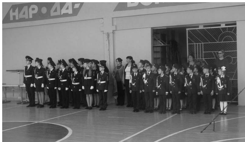
Вихованці кадетських класів сімферопольської гімназії №11 ім. К.А. Тренєва склали присягу