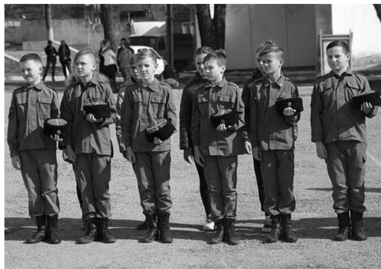
Спартакіада «казачої» молоді допризовного віку

Виховувати кримську малечу в дусі любові до «отечества», крім «Влади» та співробітників освітньо-культурної сфери, допомагають і релігійні діячі, презентовані кліриками кримських епархій УПЦ МП. Останнім часом вони наполегливо докладають чималих зусиль щодо впровадження у кримських загальноосвітніх закладах таких предметів, як ОРКСЕ (Основи релігійних культур і світської етики), ОДМКНР (Основи духовно-моральної культури народів Росії) та ОГК (Основи православної культури), а також проводять активне «духовне окормлення» до- та призовників, пояснюючи їм, наскільки це гідно та почесно – «положити живот свой за Веру, Царя и Отечество».