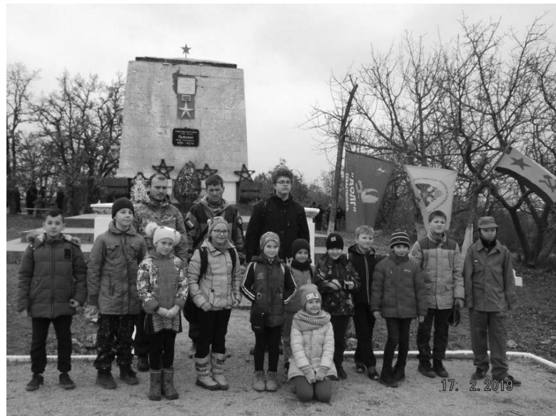
Практичне заняття загону православних розвідників-слідопитів севастопольського храму Вознесіння Господня