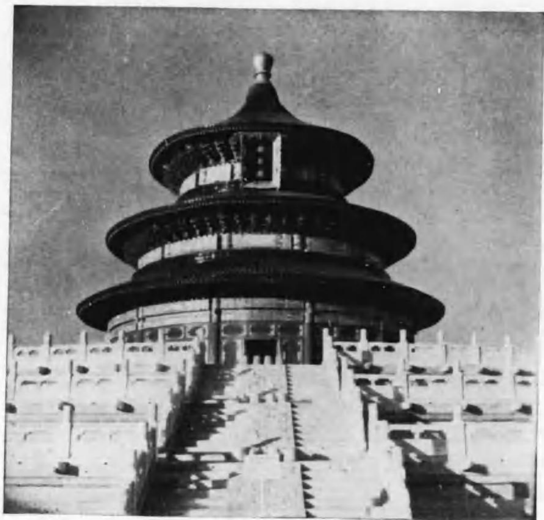
北京・天壇(祈年殿)