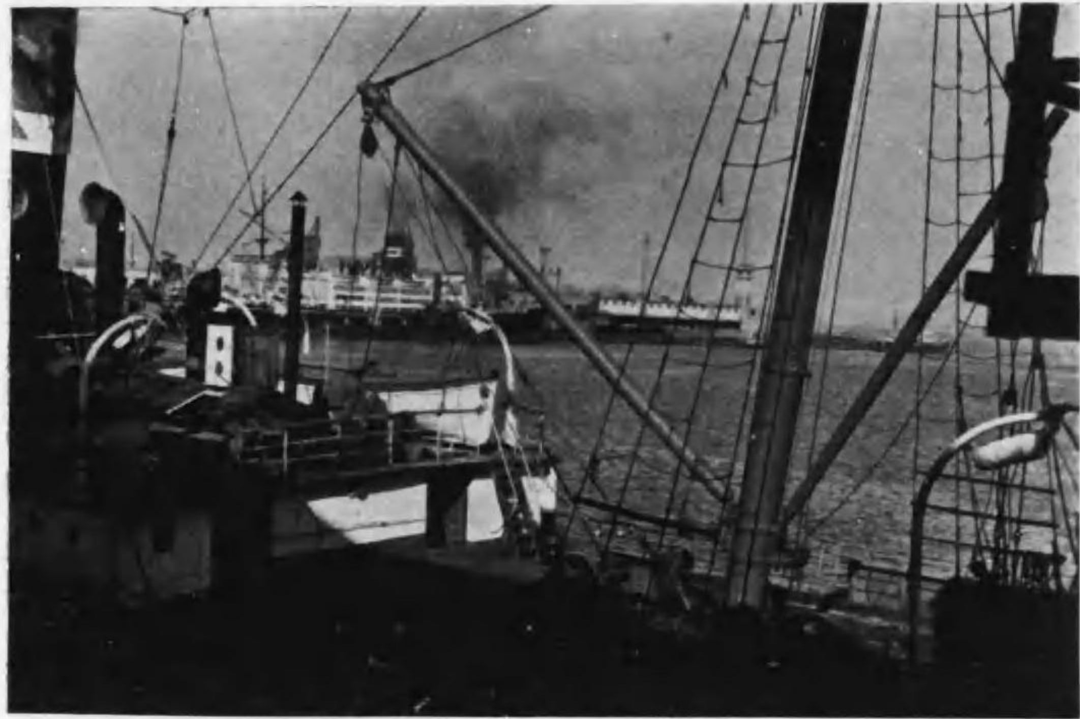
大 連 ・ 埠 頭 (旅順要塞司令部検閲済)