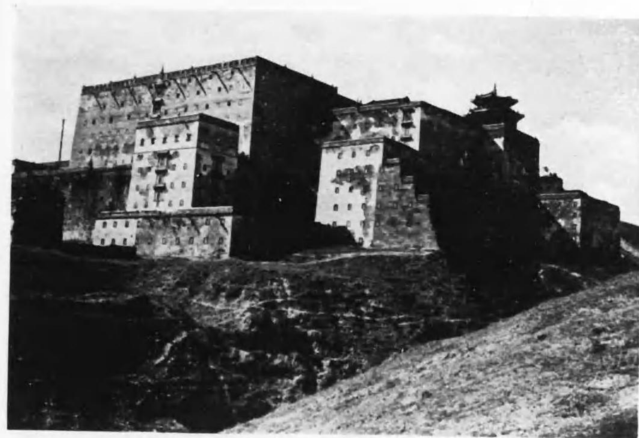
承 德 · 菩 陀 宗 乘 廟