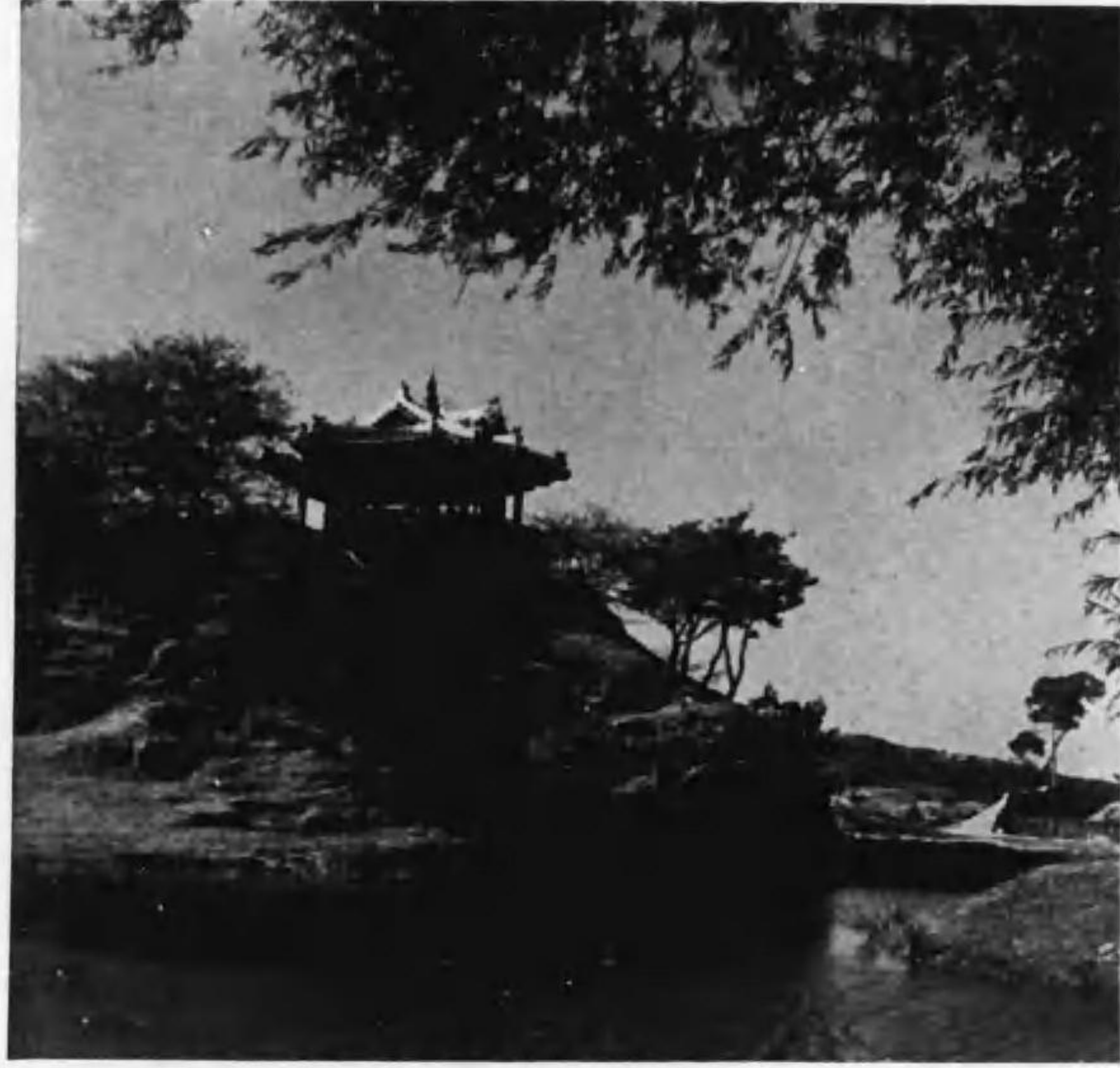
水原・訪花隨柳亭