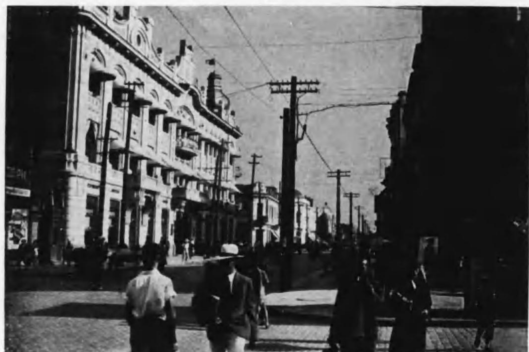
ハルビン・キタイスカヤ街