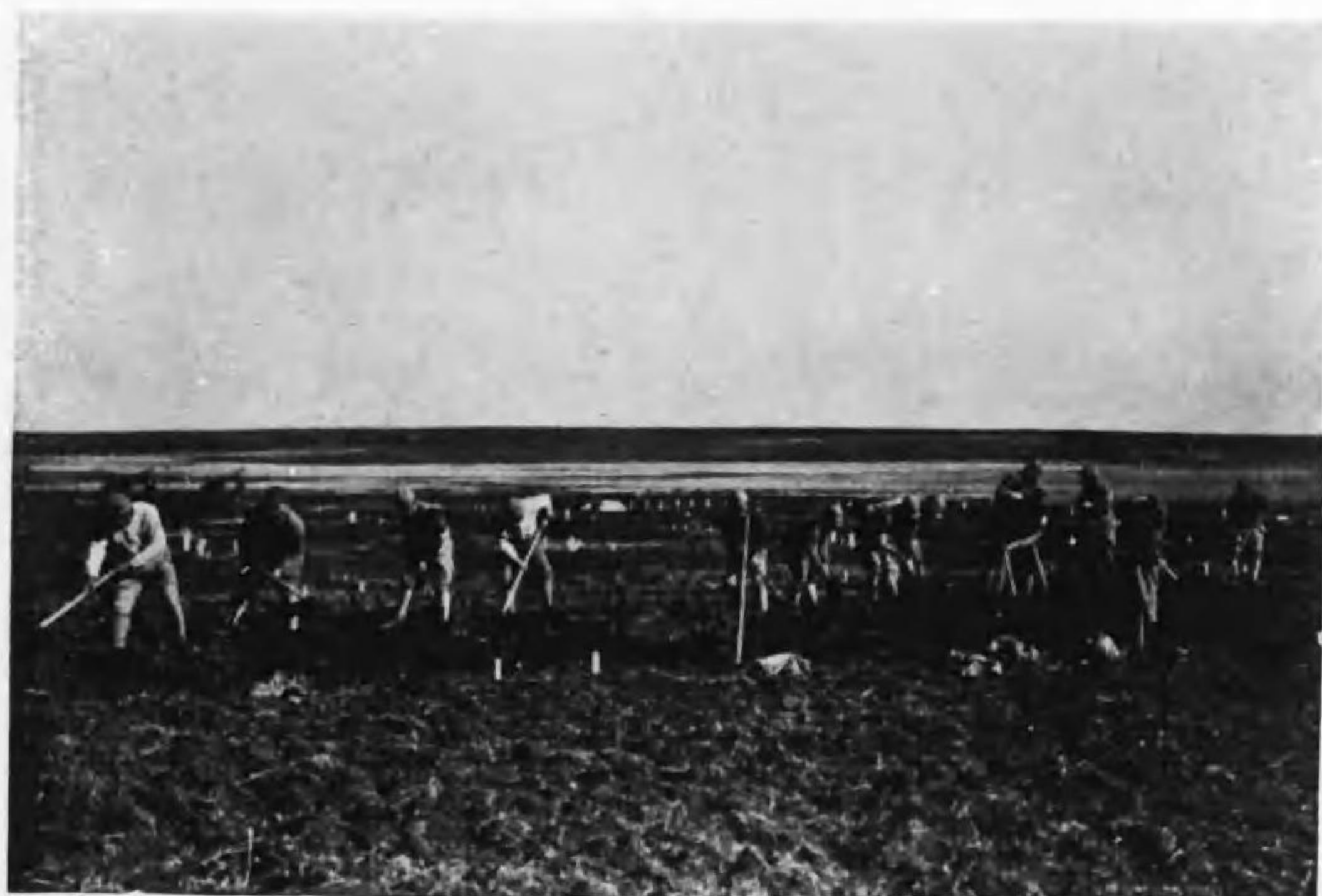
伊拉哈・移民(青少年義勇軍)