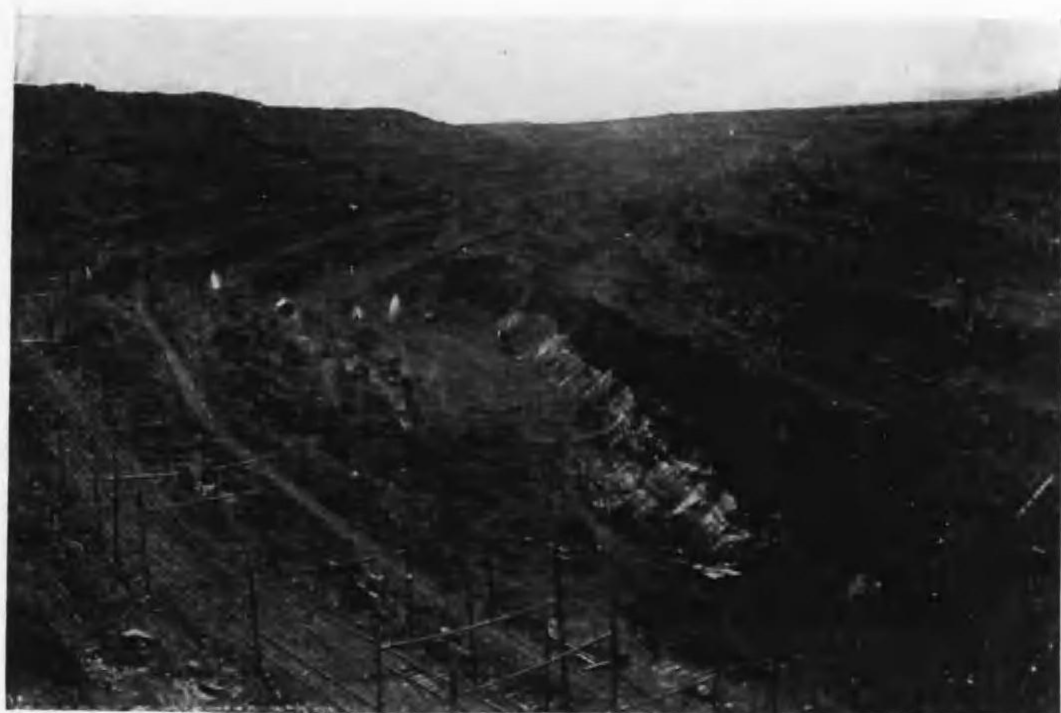
撫順・滿鐵撫順露天掘