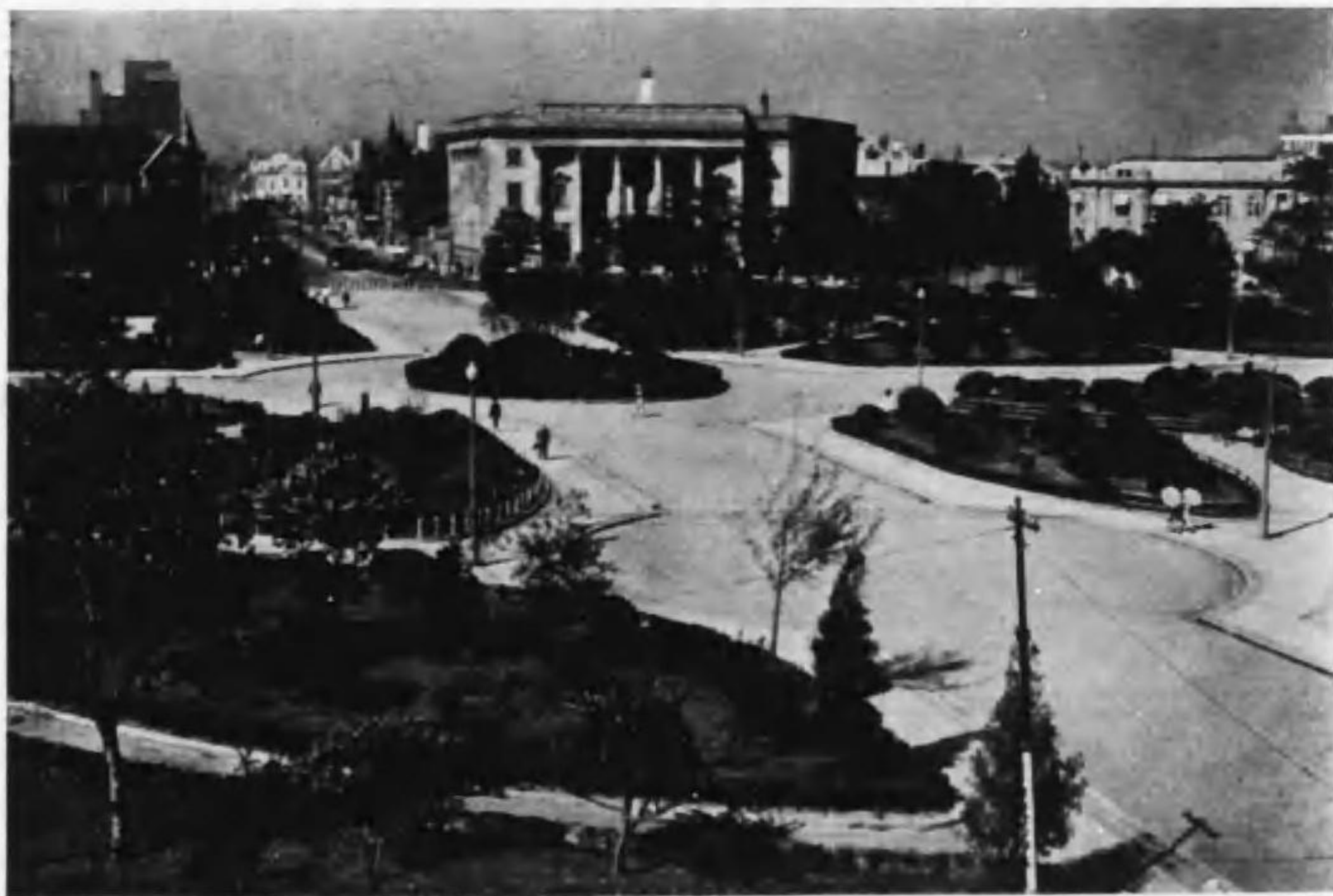
大 連 ・ 大 廣 場 (旅順要塞司令部検閲済)