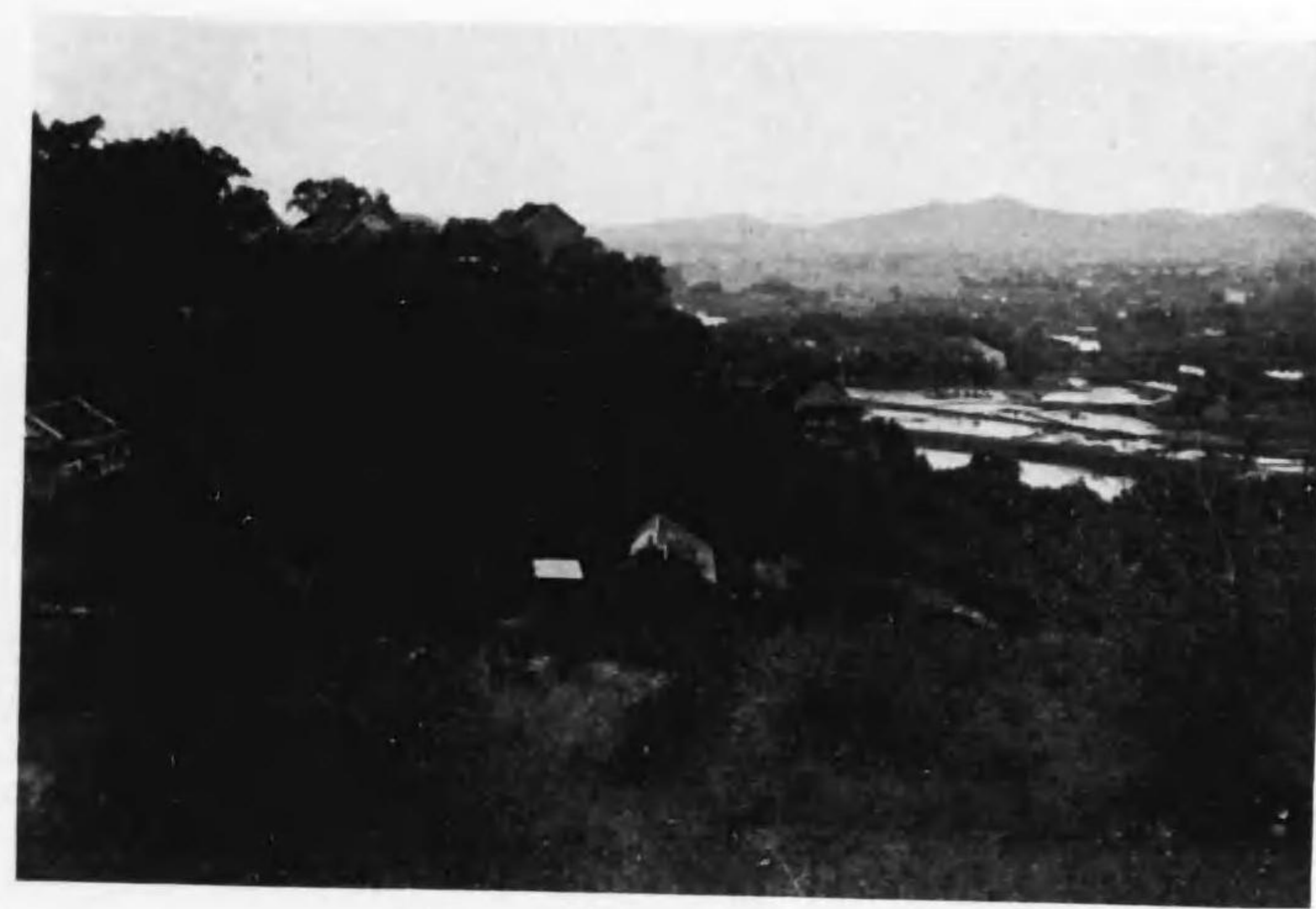
吉 林 · 北 山