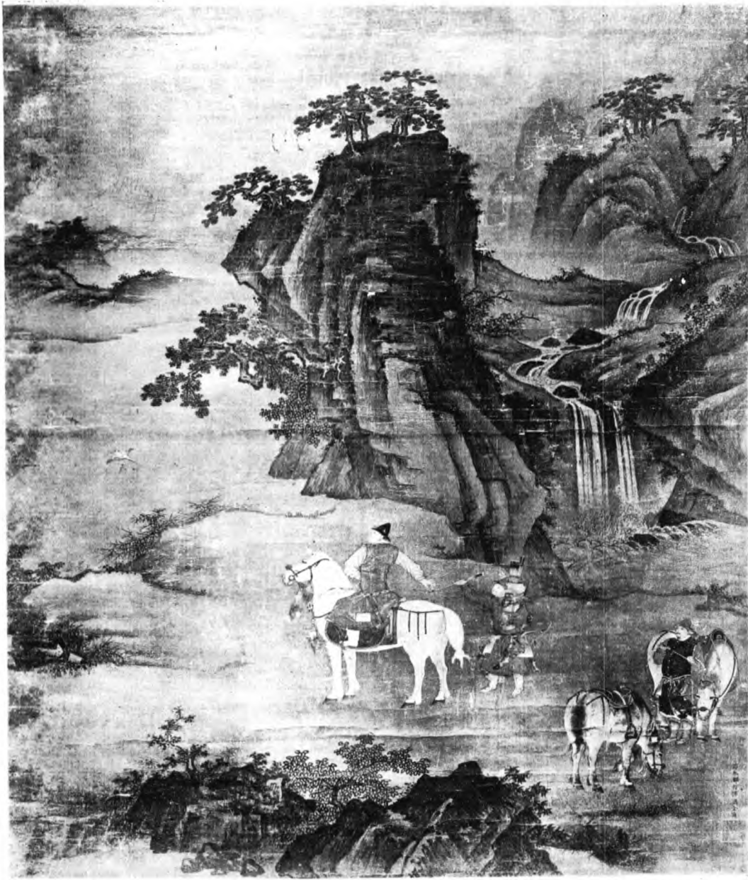
明 周 全 剔 雉 圖

殿一座、計五間、頭停琉璃有爆釉、走獸勾滴、擬夾隴補安走獸、齊理勾滴、兩山牆上灰皮、間有脫落、抹飾紅灰見新、坎牆週圍台幫、並象眼甃塊、間有酥滅、剔補、內裏地面破碎、擬補漫、其餘鋪甃見新、前後明次稍間四抹二面、菱花格扇八槽、計三十二扇、十扇無存、二十二扇菱花心破碎、後二稍間三抹二面、菱花窗二槽、計八扇、菱花心破碎、擬添做松木四抹二面、菱花格扇十扇、三十扇補做菱花、添銅套桶海窩十分、下架柱木、枋榱窗俱油光硃紅油、線