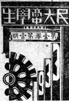
封面畫名 第四名 冠敏作

術，爲人 類真正情 感流露於 文字上， 是人生的 反映，人 生自然的 呼聲，有 天真的思 想，高尚的意志，以真摯的情感爲它的生命，它的作用根本就在 引起讀者的共鳴，而且文學更是時代的前驅者，有預言的使命， 改變境遇和推動世紀邁進的能力，它的銳敏性是任何物所不能及 的，偉大人類感情之郵藉着文學而溝通。所以我們說文學決不 是以載道消遣娛樂爲目的而是偉大的有價值的！