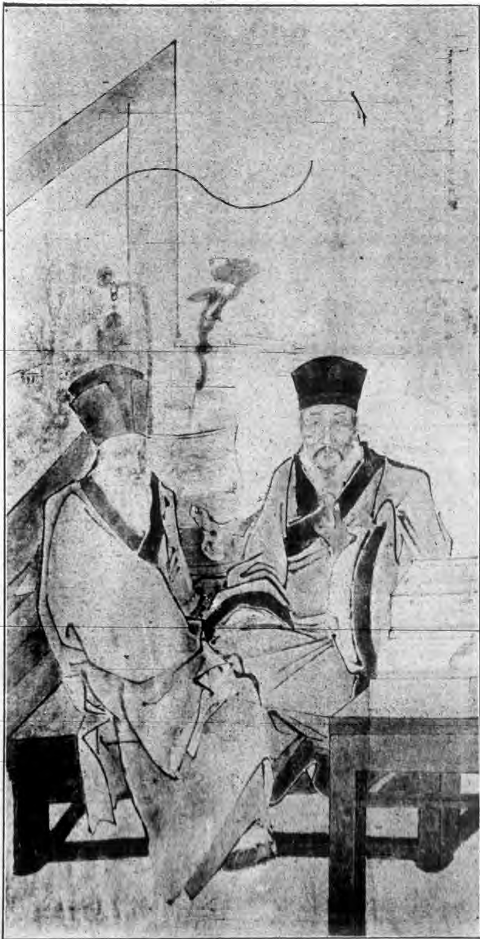
利瑪竇明堅開教肇慶建堂三百五十五週 奉教閣老徐海上去三世百週