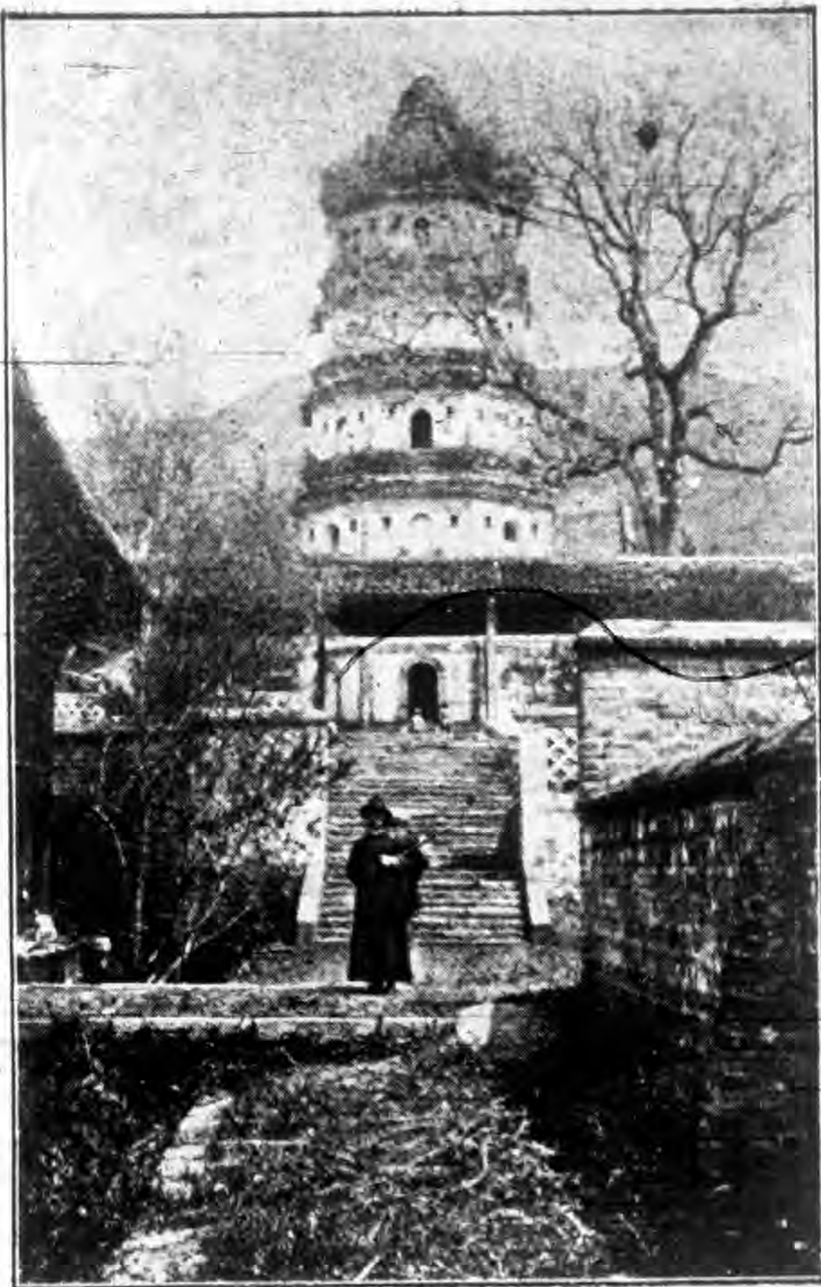
廣東韶州南華寺之塔 利瑪竇自肇慶府至韶州時 曾在此小住