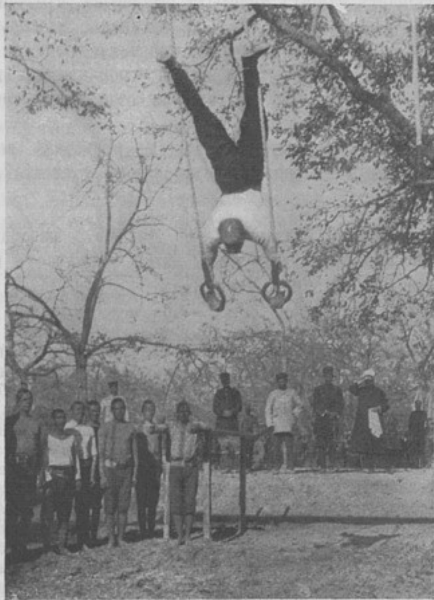
Гимнастика въ афганской арміи. Полковникъ турецкой арміи показываетъ гимнастику въ присутствіи эмира афганскаго.

Писарь, несмотря на то, что я былъ въ гражданскомъ платьѣ, проявилъ ко мнѣ всѣ возможные знаки вѣжливости и вниманія, чего, кстати сказать, у себя, даже въ формѣ,