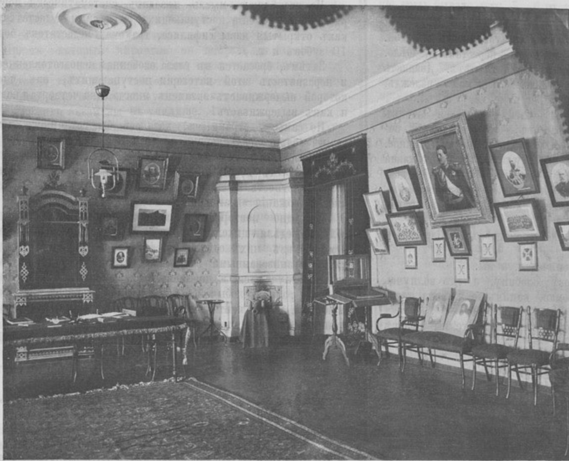
Уголь одной изъ комнатъ музея 83-го пѣх. Самурскаго полка. (Къ корресп. „Ставрополь“).

петии той нравственной ломки, которая день за днемъ, шагъ за шагомъ совершалась во внутреннемъ мѣрѣ Огарко. Неужели же тамъ атмосфера настолько угарная, что въ ней не могутъ устоять ни сила воли, ни твердость сложившихся убѣжденій? Или всѣ эти хорошія черты могли цвѣсти лишь на почвѣ, чуждой всякихъ соблазновъ и искушеній, а когда пришли они, то все прочно сложившееся мировоззрѣніе разлетѣлось прахомъ, лопнуло какъ мыльный пузырь? Злобинъ хотѣлъ понять и не могъ. Въ душѣ его не было больше личной обиды, было лишь больно и обидно... за человѣка.