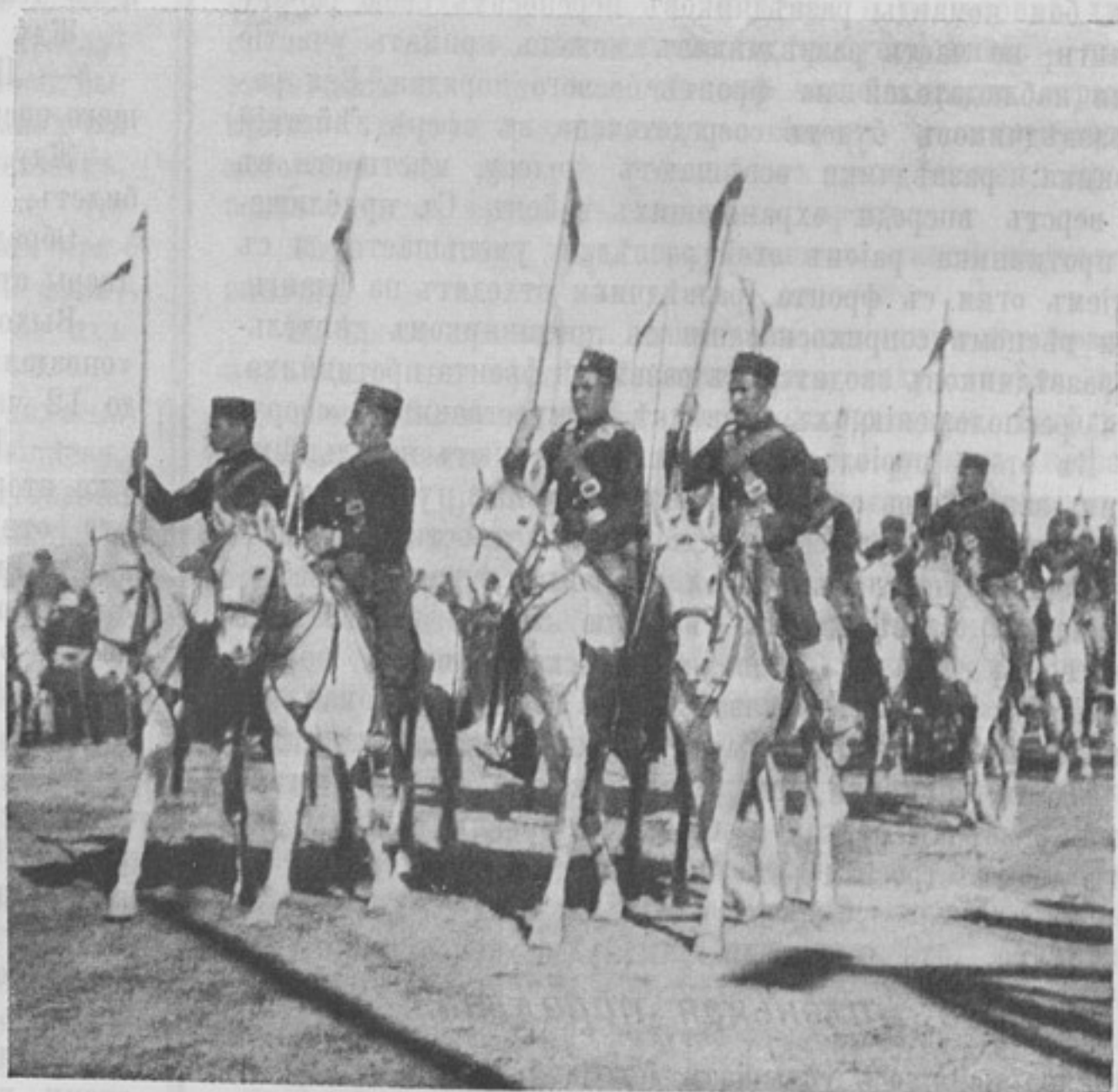
Афганскіе уланы, обученные турецкими инструкторами.

Толкнулъ дверь и вошелъ въ обширный вестибюль. Никого... А по стѣнамъ вправо и влѣво разбѣгаются черныя руки съ пальцами и надписями. Я нашелъ интересующую меня надпись и пошелъ «по пальцамъ». Сдѣлавъ поворота два, ведущій меня палецъ остановился. Надпись гласила: