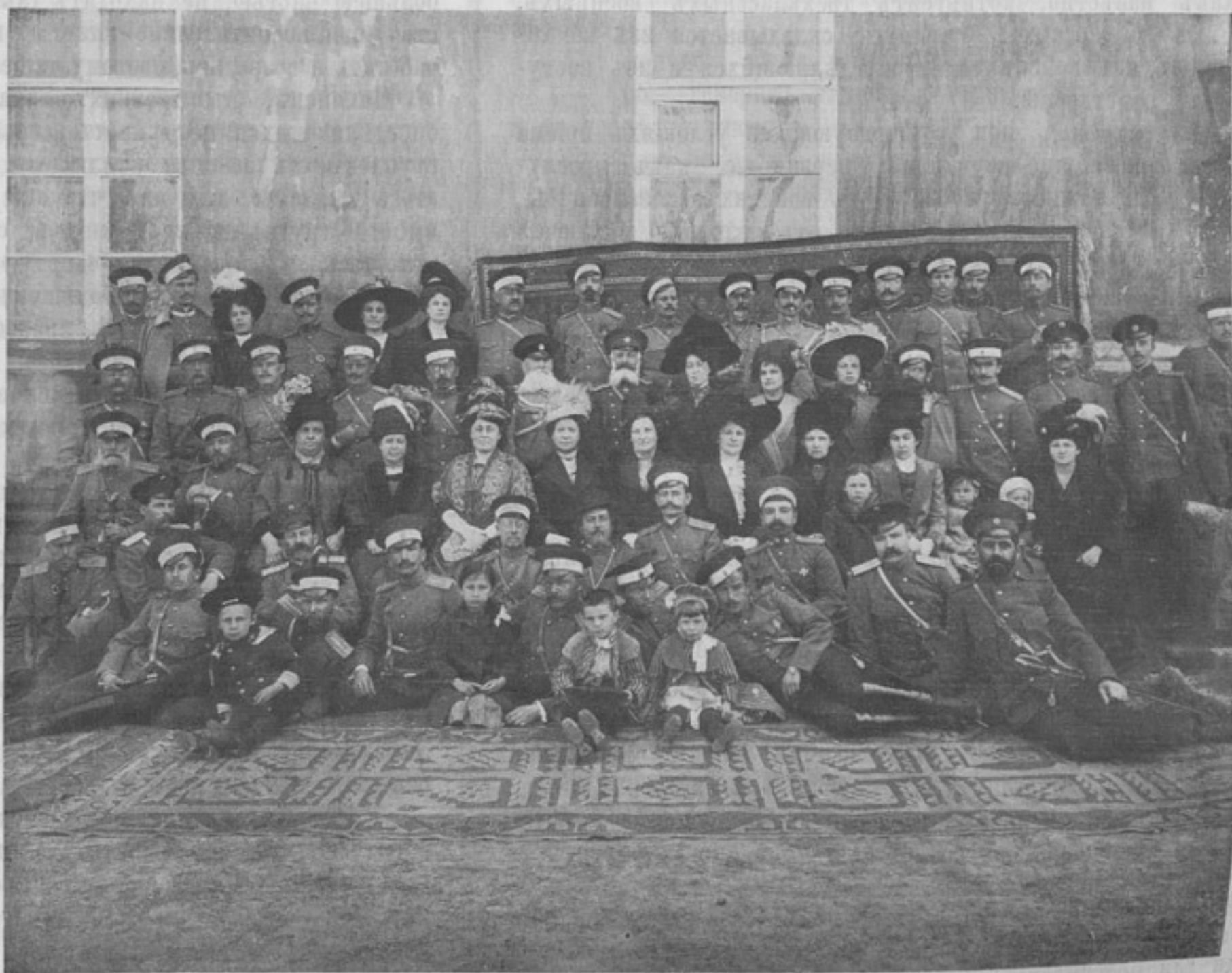
Семейная группа 83-го пѣх. Самурскаго полка, снятая въ день открытія музея. (Къ корресп. „Ставрополь“).

Долговъ кончилъ читать и бросилъ газету.