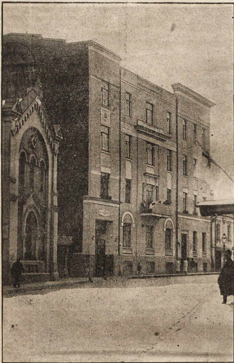
Внѣшній видъ лазарета.