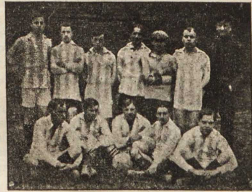
Футбольная команда «Урь».

Метаніе копья: 1) Б. Рымаревъ (М. К. Л.)—46 м. 43 с., 2) Быстрицкій (М. К. Л.)—42 м. 43 с. Метаніе диска: 1) Шульцъ—31 м. 50 с., 2) Леандровъ—29 м. 63 с., 3) Смирновъ (М. К. Л.)—28 м. 70 с.