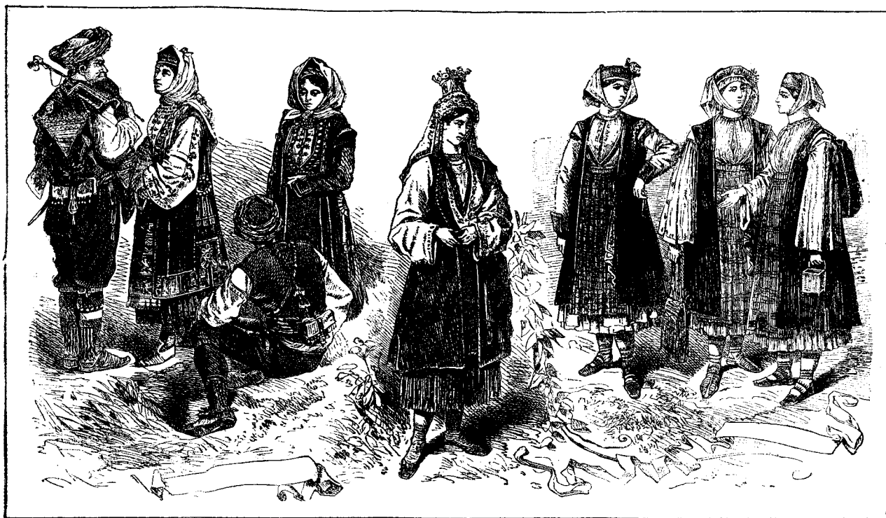
Porturi poporale din Dalmația.

»Frumosu-i cap zăcea pe perina roșită de sânge, pèrul de asemenea îi érá plin și fața vénéțá. Ochii