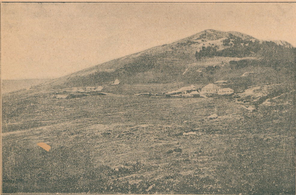
Са бивше српско-турске границе: Српска турска караула

састану и споје у једно тело и једно стадо на молитву Богу, на песму Јорданску. Прекрилио беше народ читав онај простор — ни игла да падне из облака, не би могла на земљу доспети!.. И опет благослови гром, величанствен и заглушан овај свети тренутак, а тамо под самим мостом заплива у речне вале снажан и крепак младић, да се ето припреми за скоро надметање, кад буде валаљало хватати бачени крст у речним валима.. И другог ево доле испод оног старог дуба, коме овај свечани тренутак крену слике из прошлости, и његова понајвиша грана задрхта!.. Је ли од радости, што је ево дочекао необорен, горд, још жилав и чврст овај сретни тренутак, кад се јавља Бог са својом ћерком Слободом, до- скорашњем робљу?! И опет загрмље сложен грохот пушак а и разлегаше се једно за другим, од чете до чете, сливен у један силан прасак. И „Глас господен“ преливаше се са роморењем