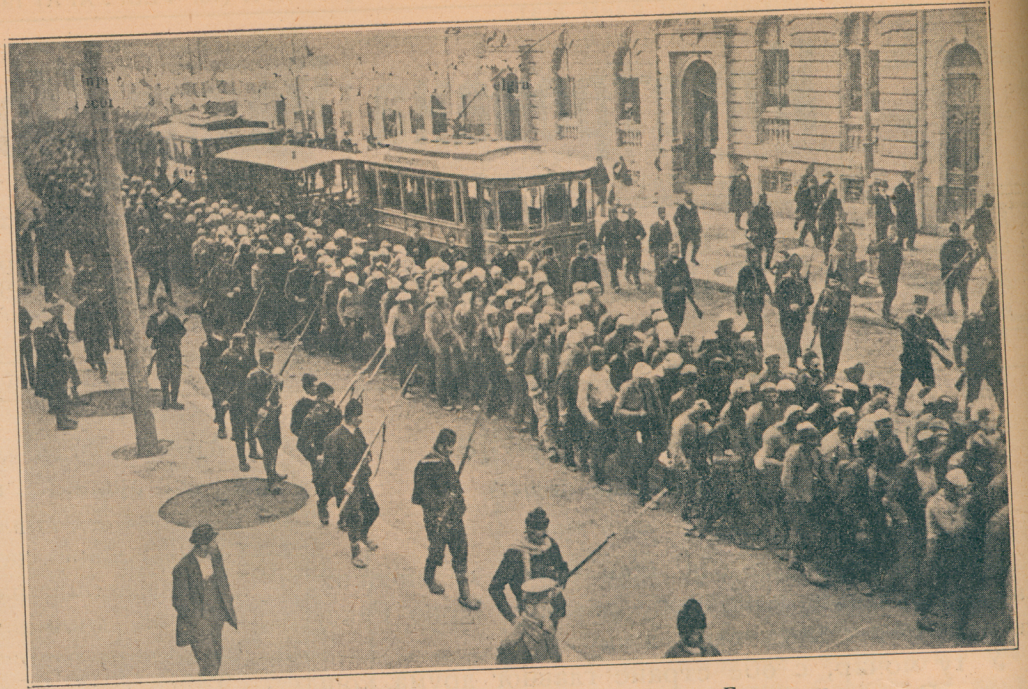
Дотеривање првих турских заробљеника у Београду

У јутру, још пре сванућа, сменуле су нас трупе тимочке дивизије другог позива, а нас упутише ка