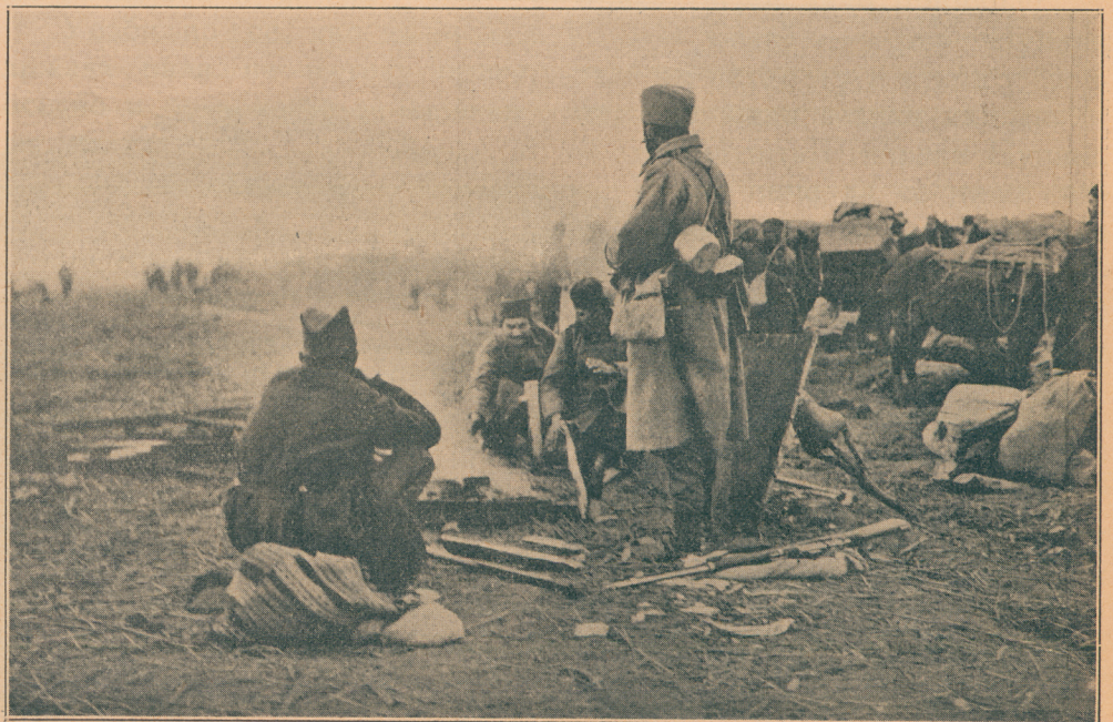
Српски се војници одмарају после битке код Куманова, да одмах звтим поју на Скопље

Призор је свечан!.. Тишина је нема у том великом, дугачком полувенцу, шареном и живописном, протканом светлим беласањем лепог одела појединих група Црногорских мома и женскадије. Свечана тишина се осећа дуж читаве ове пруге, која је ево легла десном обалом свечаног и веселог Вардара до моста, па по мосту, и од њега левом обалом на ниже, дајући облик на покој. Непомична је та пруга у виду најлепшег лепотканог дугачког и непрегледног ћилима. Тек овде, онде лелујне он, као кад би где ветар подишао и мало га подигао! Оне лепе, разнобојне и разнолике шаре излазе ти по њему и светлосни зраци са појединих сличица и промена на њему падају ти на очи, улазе кроз зенице твоје и уносе ти у свест слику сјајну и лепу, која ти се упија у душу, трајно и непромењено. Пред нама су у оном делу тога лепотканог ћилима, који хвата кеј с леве стране, испод ћуприје, испред митрополије и Отоманске Банке, низови одреда, са пушкама о рамену, са веселим погледом, у одмереним редовима, са ганутом душом и раздраганим срцем, пливајући у миљу и задо-