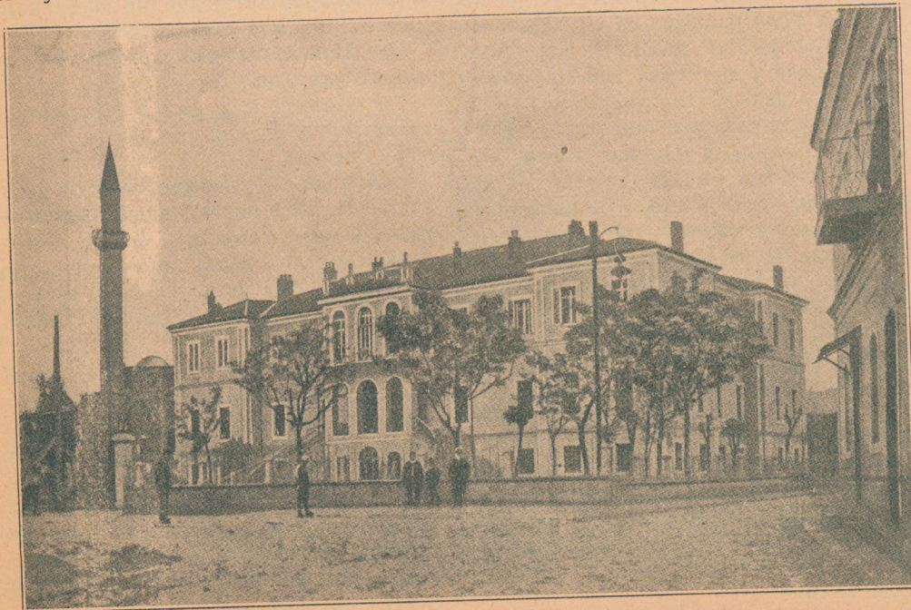
Окружно начелство у Приштини.

Генерал фрањеваца (калуђера римских) обичавао је сваки час успети се на звоник и одатле је гледао около, можда с потајном надом, да ће једном видети савезнике где се појављују. Али председник врховног судишта, мислећи да га је видео да чини неке знакове, поручио му је да не иде више на звоник ни он, ни ко други. И ја сам био осумњичен од пуковника, који се распитао з мене, али није поверовао исказу мом занимању. Мисли да сам часник и пази на мене, те је наговорио гувернера да обустави функционирање поште још пре, него су на то помислили Црногорци. Мој арбанаски пријатељ, који такођер не зна, ка сам, да ме охрабри, упозорuje ме, да је тежина пуковникових сумња несношљива, мучна.