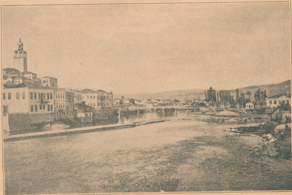
Поглед на Душанов царски град Скопље.

После хода од четврт сата стигли смо на положај. Није дуго трајало, а наш батаљон ћутећи журно се укопавао. Ашовчићи су снажно забадани у земљу и груде бацане на предњи нагиб правећи стрелачки ров. Киша је и даље падала, квасећи назебле војнике.. На један мах, као по команди, војници прекидоше своје копање и упреше своје погледе кроз густу тмину, ка предњим позицијама. Са тих позиција заурлао је страхан оркан.