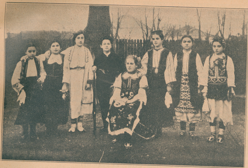
Српска ношња у новоослобођеним крајевима.