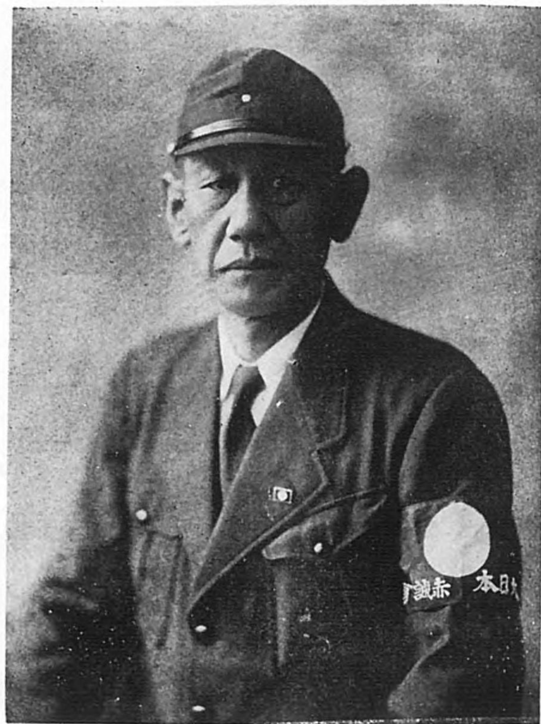
大日本赤誠會長橋本欣五郎大佐