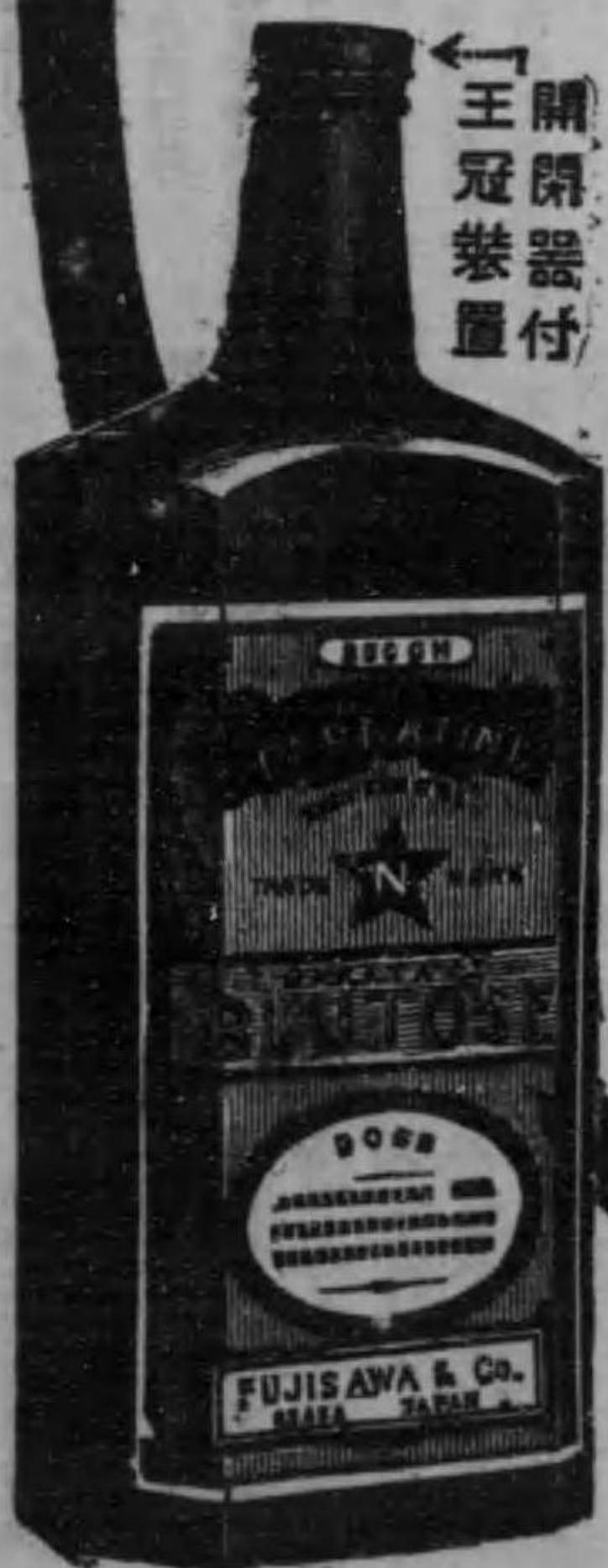
← 開閉器付 王冠装置