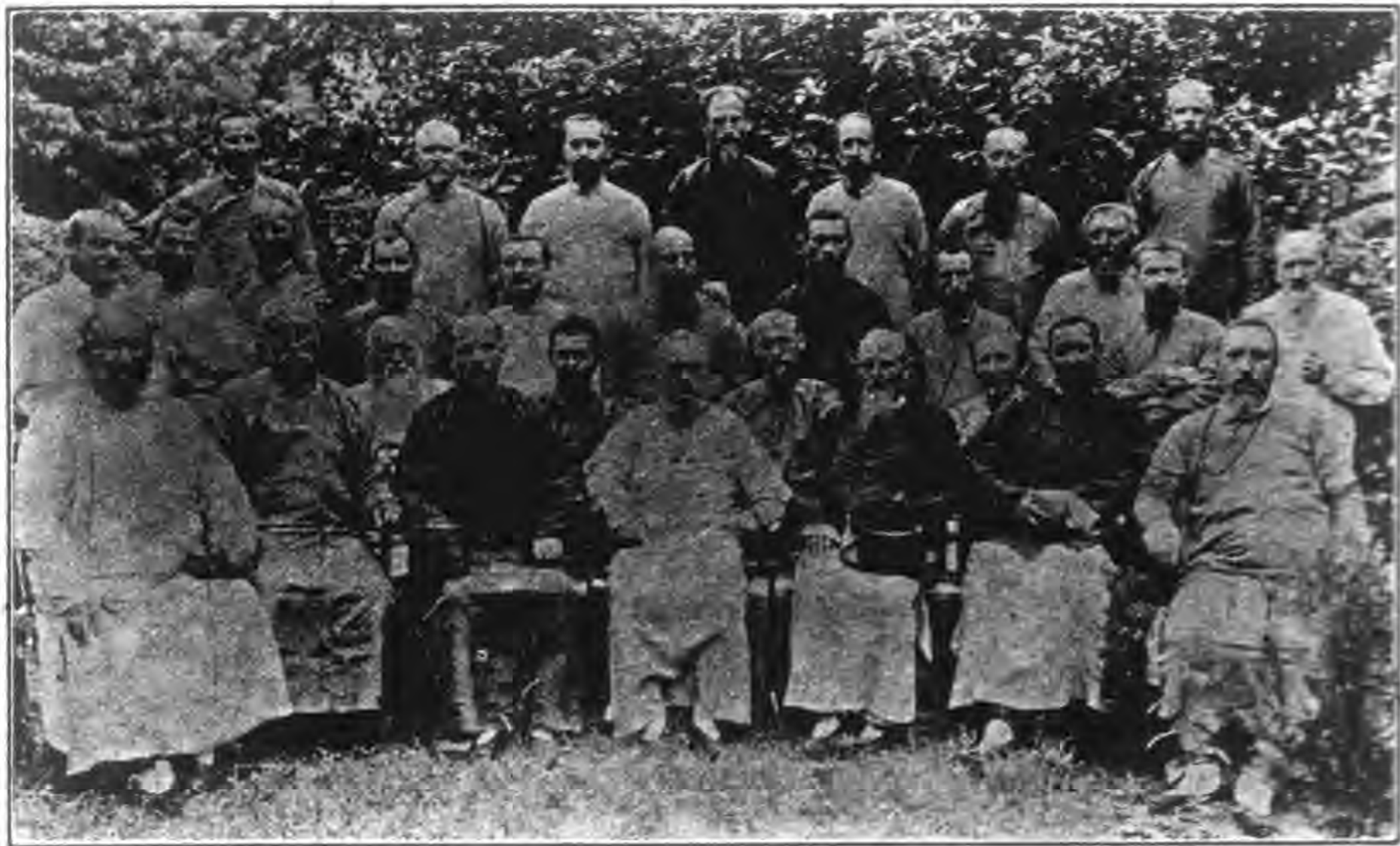
鐸司眾與長會齊教主副德教主韓境南東山