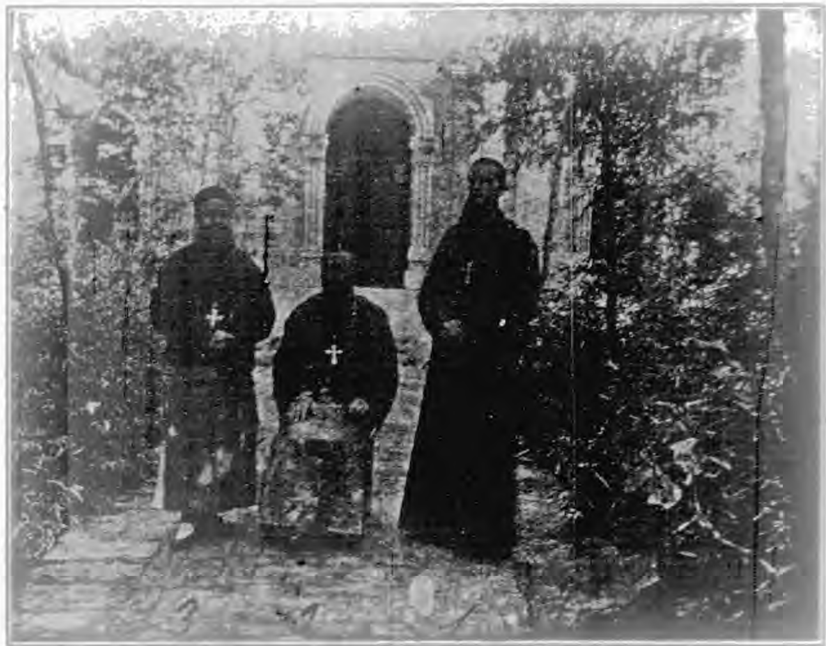
教主賈境西南河 1 教主希部中西陝 2 教主康境南西陝 3