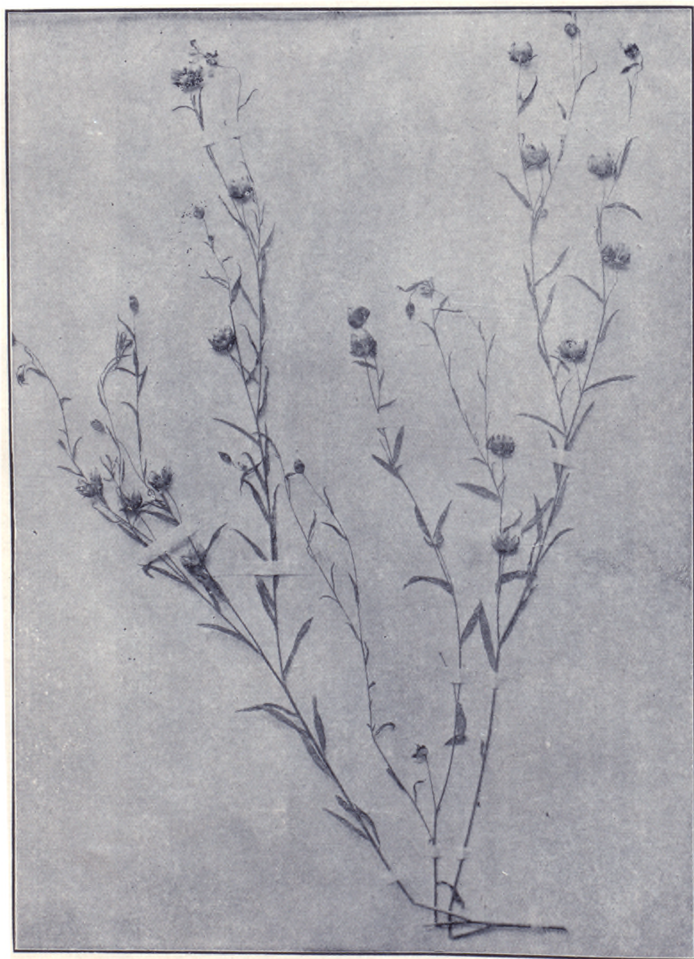
胡 麻 嘉 穀 圖 之 五