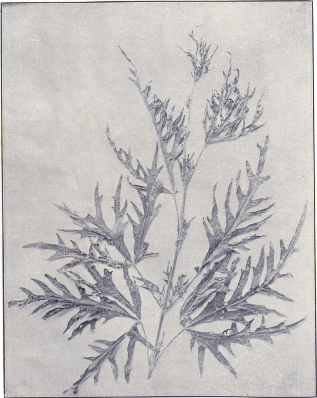
六 之 圖 草 牧 別 特 麻 蠟