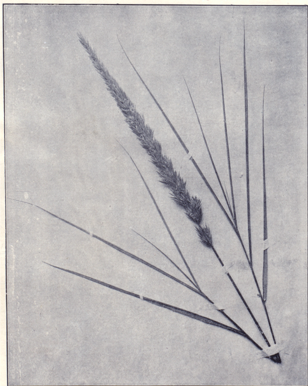
燕麥特別牧草之圖八