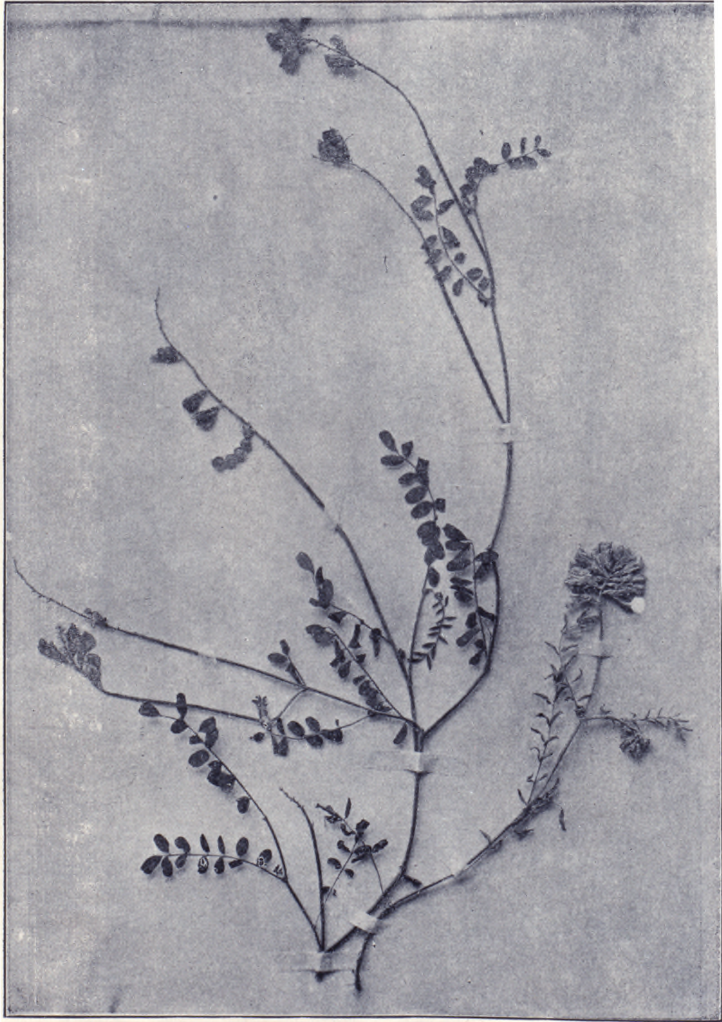
一之圖草牧別特蓂苜