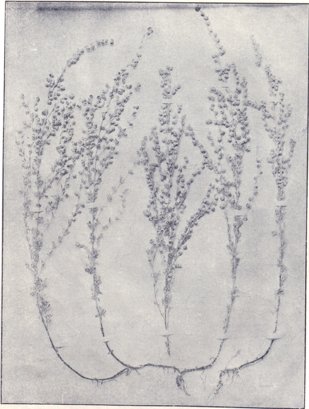
白蒿特別牧草之圖四