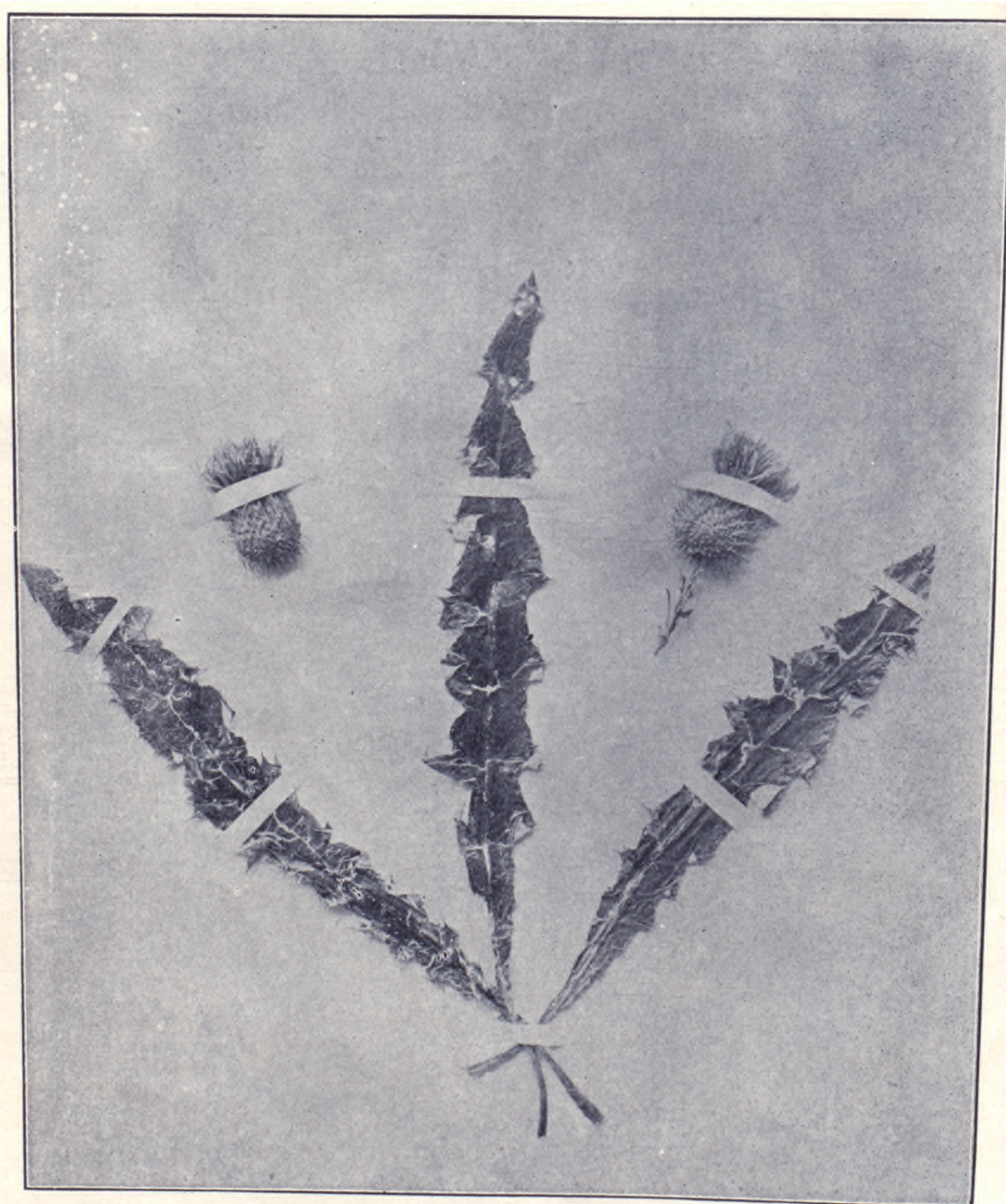
大薊特別牧草之圖五