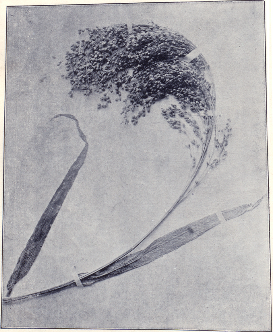
二 之 圖 穀 嘉 稷