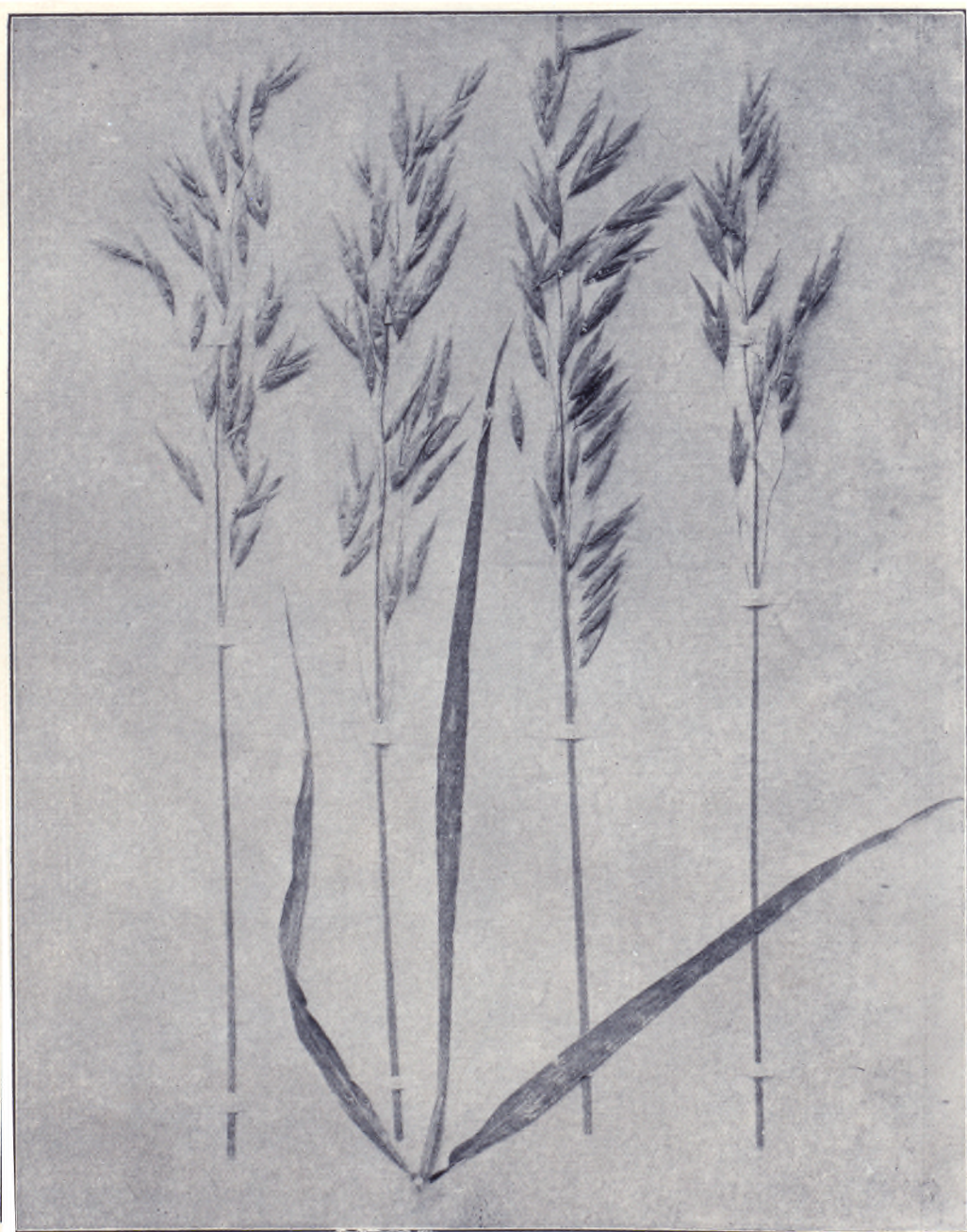
三 之 圖 穀 嘉 麥 莜