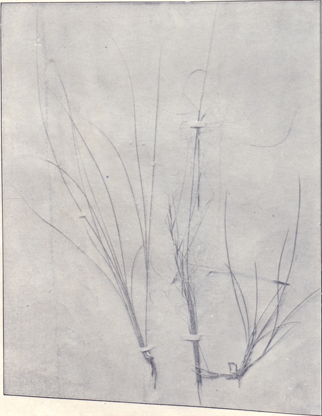
七之圖草牧別特針狼