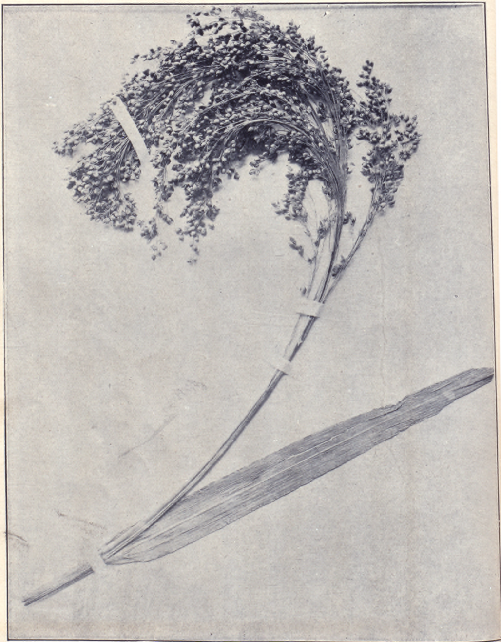
一 之 圖 穀 嘉 黍