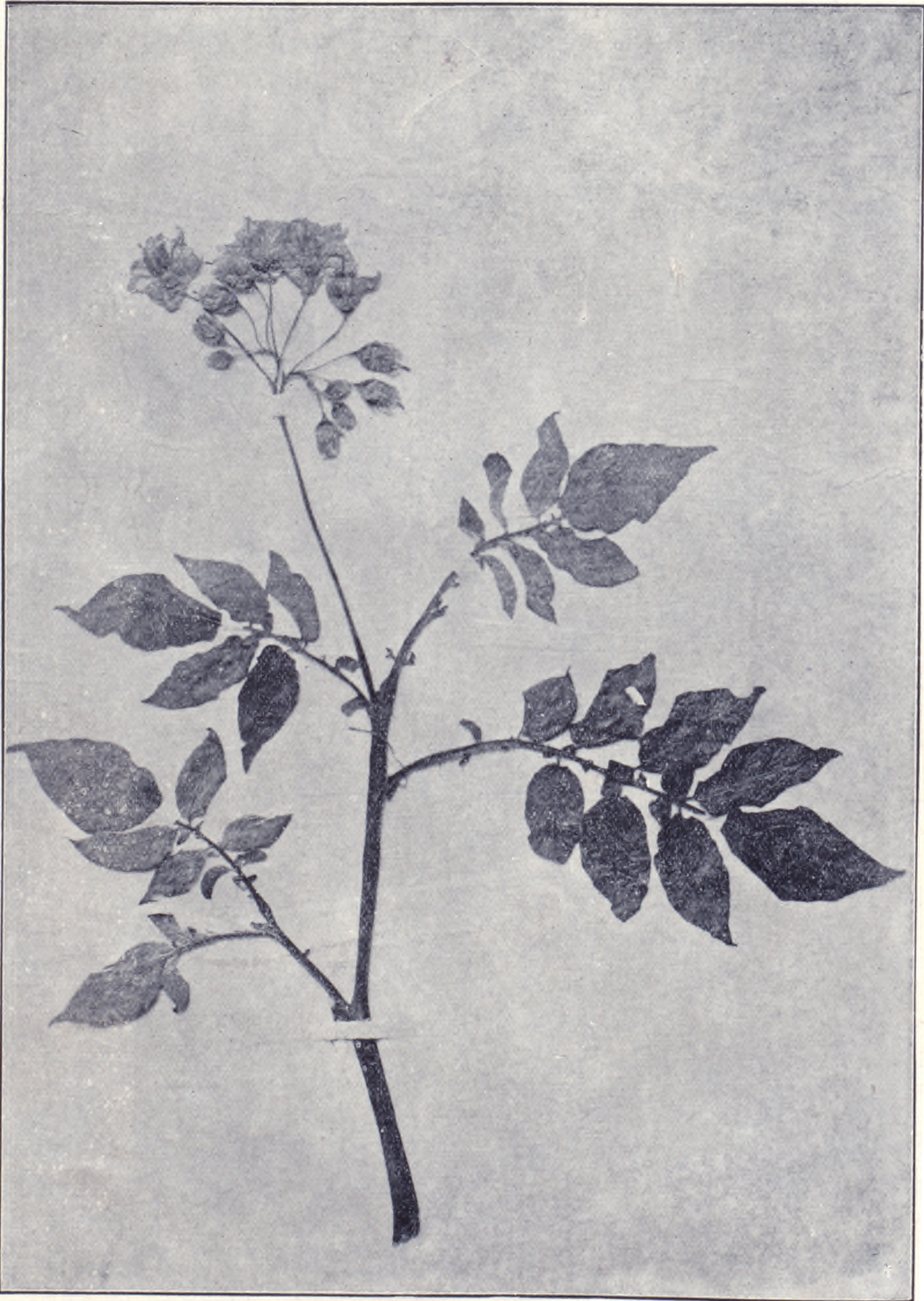
馬鈴薯嘉穀圖之六