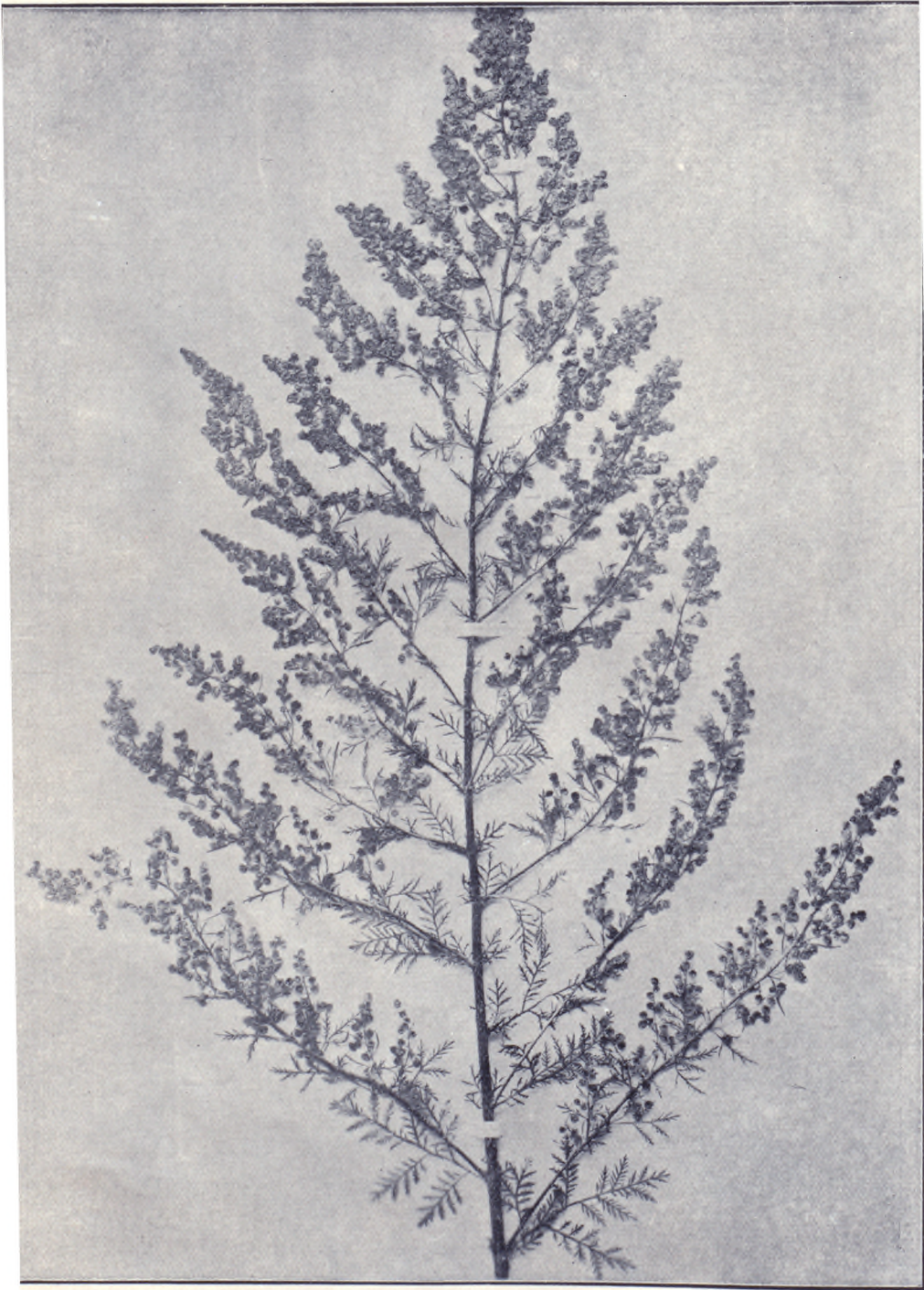
三 之 圖 草 牧 別 特 蒿 香