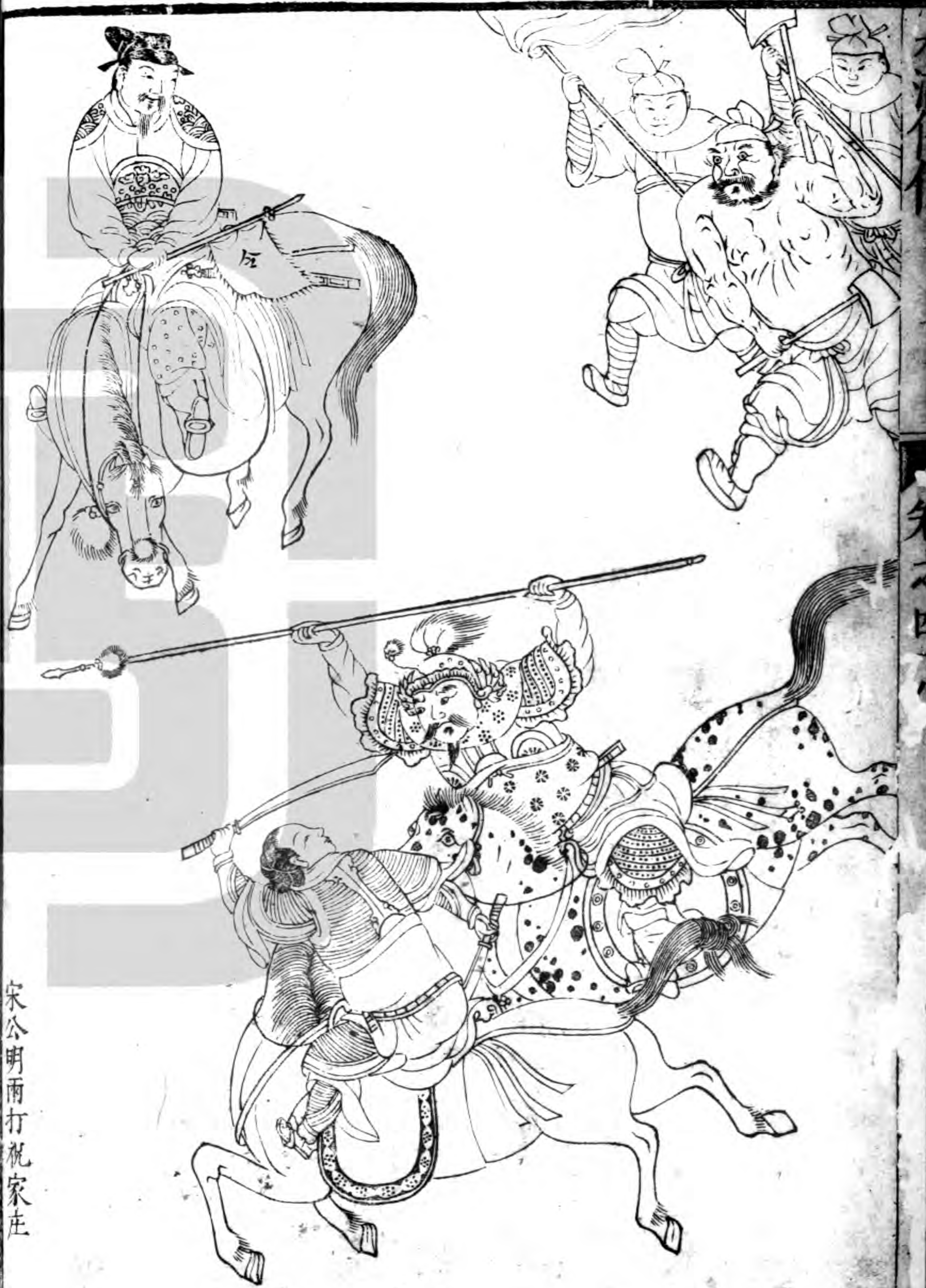
宋公明兩打祝家莊