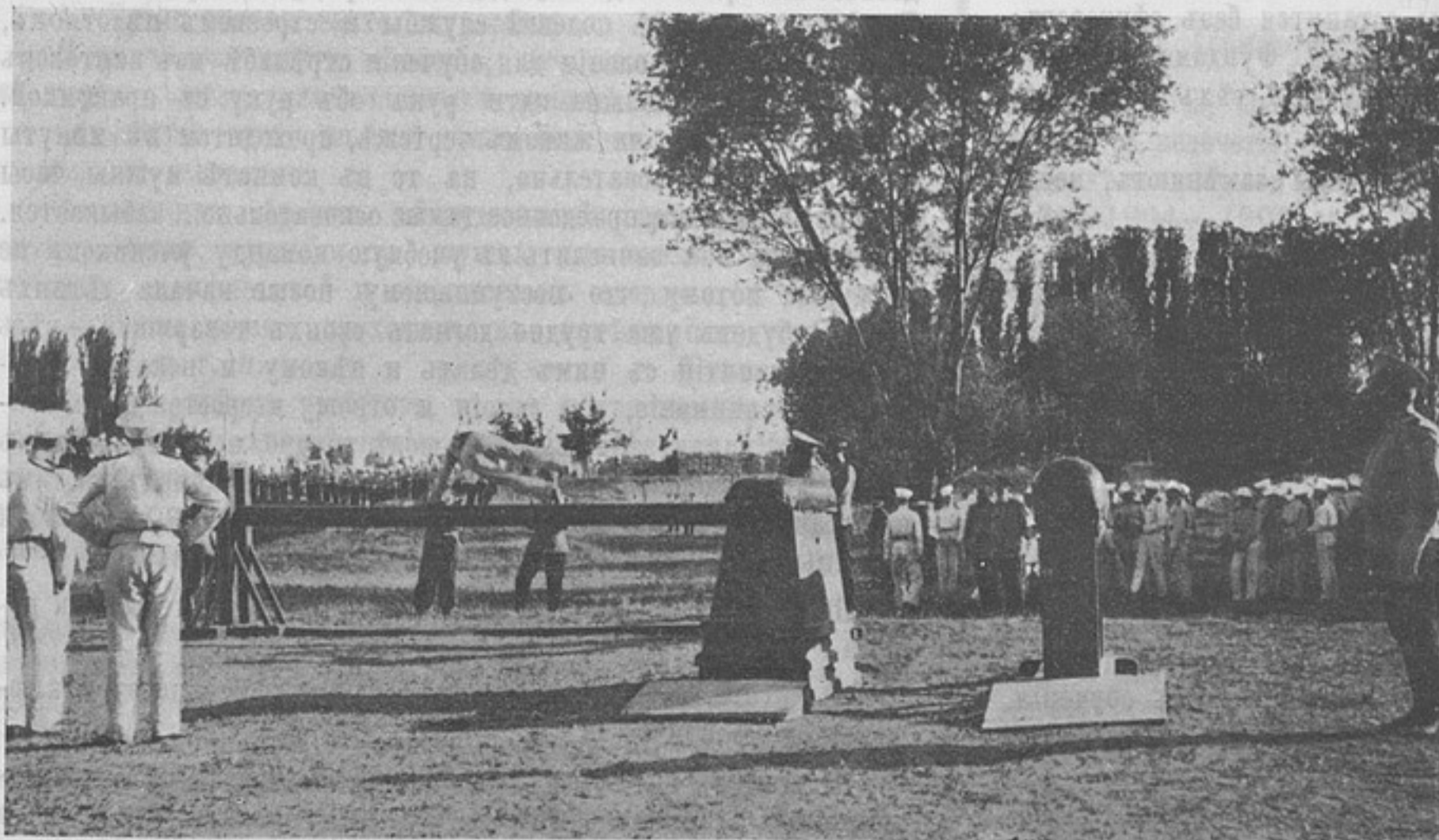
Прыжокъ черезъ горизонтальное бревно. (Къ корр. «Изъ г. Ташкента»).

Наши ученики послѣ экзаменовъ съ радостью бросаютъ толстыя-претолстыя книжки и быстро забываютъ все прой-