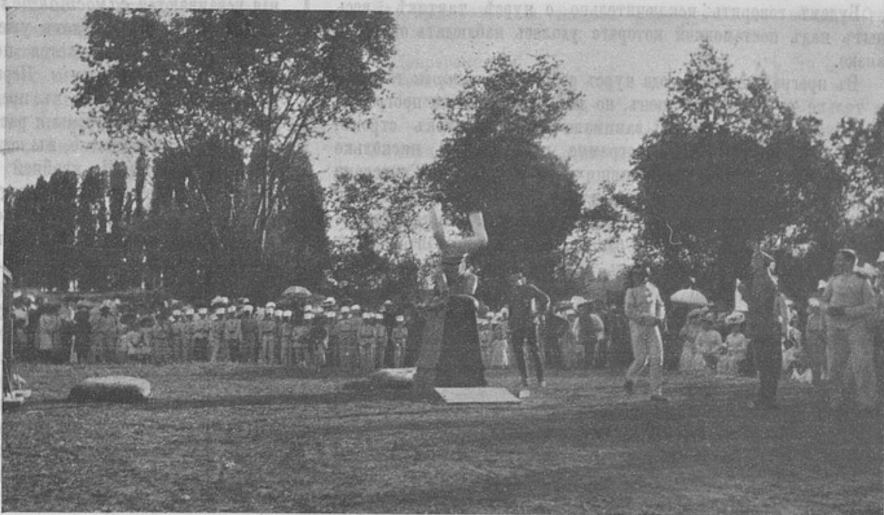
Прыжокъ на деревянной лошади черезъ голову. (Къ корр. «Изъ г. Ташкента»).

Гарнизонъ редюита не превосходилъ 300 человекъ, но, несмотря на всѣ наши усилія, мы не могли выбить противника ни въ эту ночь, ни 24-го ни 25-го февраля. Снаряды нашихъ полевыхъ орудій были безсильны противъ стѣнъ и пробивали въ нихъ только незначительныя отверстія, а попытка взорвать стѣны пироксилиномъ окончилась гибелью саперной команды. Въ сущности, положеніе этой горсти людей, засѣвшихъ въ селеніи, оказавшемся въ рукахъ непріятеля, окруженныхъ со всѣхъ сторонъ, было почти безнадежнымъ. Но они и не подумали о сдачѣ, зная, какъ важно было удержать редюитъ, какъ этимъ они облегчаютъ атаки своихъ и какъ затрудняютъ оборону селенія намъ... Люди эти соединились со своими лишь 25-го февраля, когда Сантайцза была очищена нами добровольно и (преждевременно!) и немедленно занята японцами.