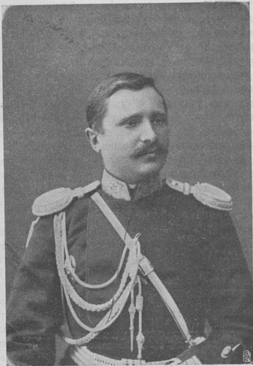
Начальникъ штаба 14-го армейскаго корпуса, генераль-маіоръ Михаилъ Александровичъ РОССІЙСКІЙ.

СОДЕРЖАНИЕ: Портретъ генерала-маіора Михаила Александровича Россійскаго. — Распоряженія по военному вѣдомству. — Хроника. — Изъ опыта русско-японской войны. Россы. — Французская мода. Безиз. — Забытые. Гутовскій. — 29 р. 16 коп. содержанія къ празднику Рождества Христова раненому капитану. Дьялопроизводитель. — Среднеазиатскій персидскій языкъ. К. Бюмеръ. — Учебныя команды въ пѣхотѣ. М. Федотовъ. — Школа подпоручиковъ. С. К. К. — «Классныя дамы» съ точки зрѣнія педагога. В. Языковъ. — Обзоръ печати. — Иностранныя арміи. — Корреспонденція. — Библиографія. — Фельетонъ. — Объявленія. — Высочайшіе приказы.