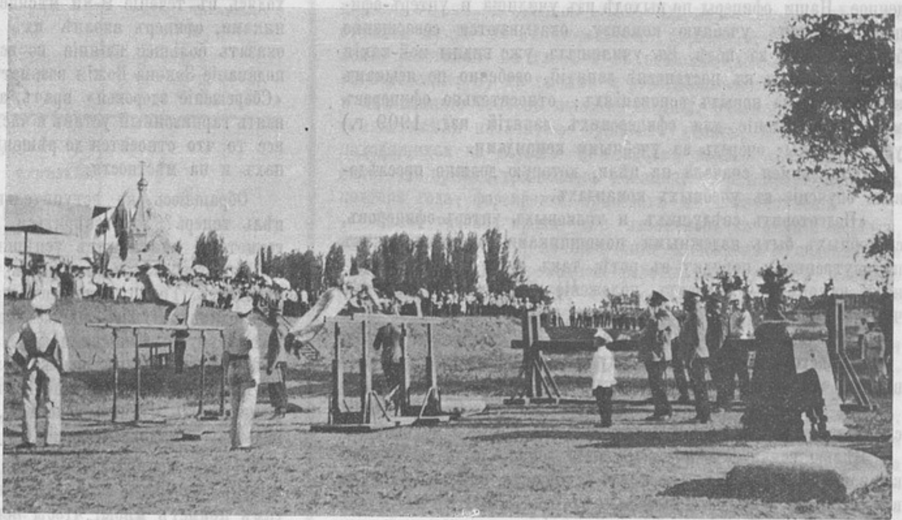
Гимнастика на снарядахъ. Параллельные брусья. (Къ корр. «Изъ г. Ташкента»).

Поэтому экзамены въ 1909 г. состоялись безъ моего