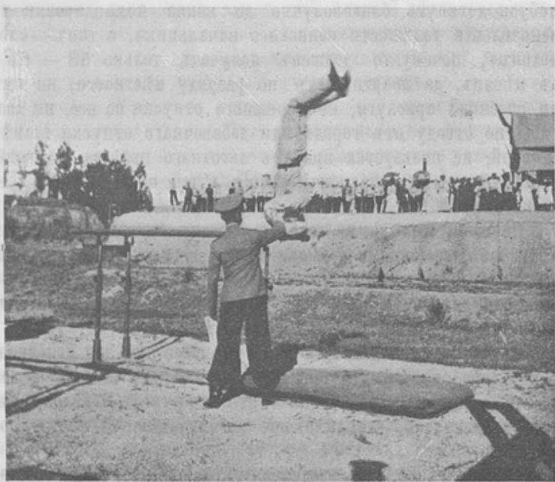
Упражнения на параллельныхъ брускахъ. (Къ корр. «Изъ г. Ташкента»).

Кому же обязано непрерывное, правильное теченіе дѣла въ управленіи во время этихъ частныхъ перемѣнъ? И вотъ за все это дѣлопроизводитель получаетъ содержанія въ мѣсяць 58—62 р., а къ празднику Рождества Христова 29—31 р.;