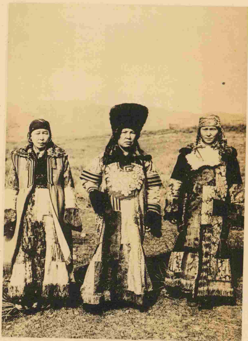
ТИПЫ МИНУСИНСКИХЪ ИНОРОДЦЕВЪ. СВАХИ-САГАЙКИ.