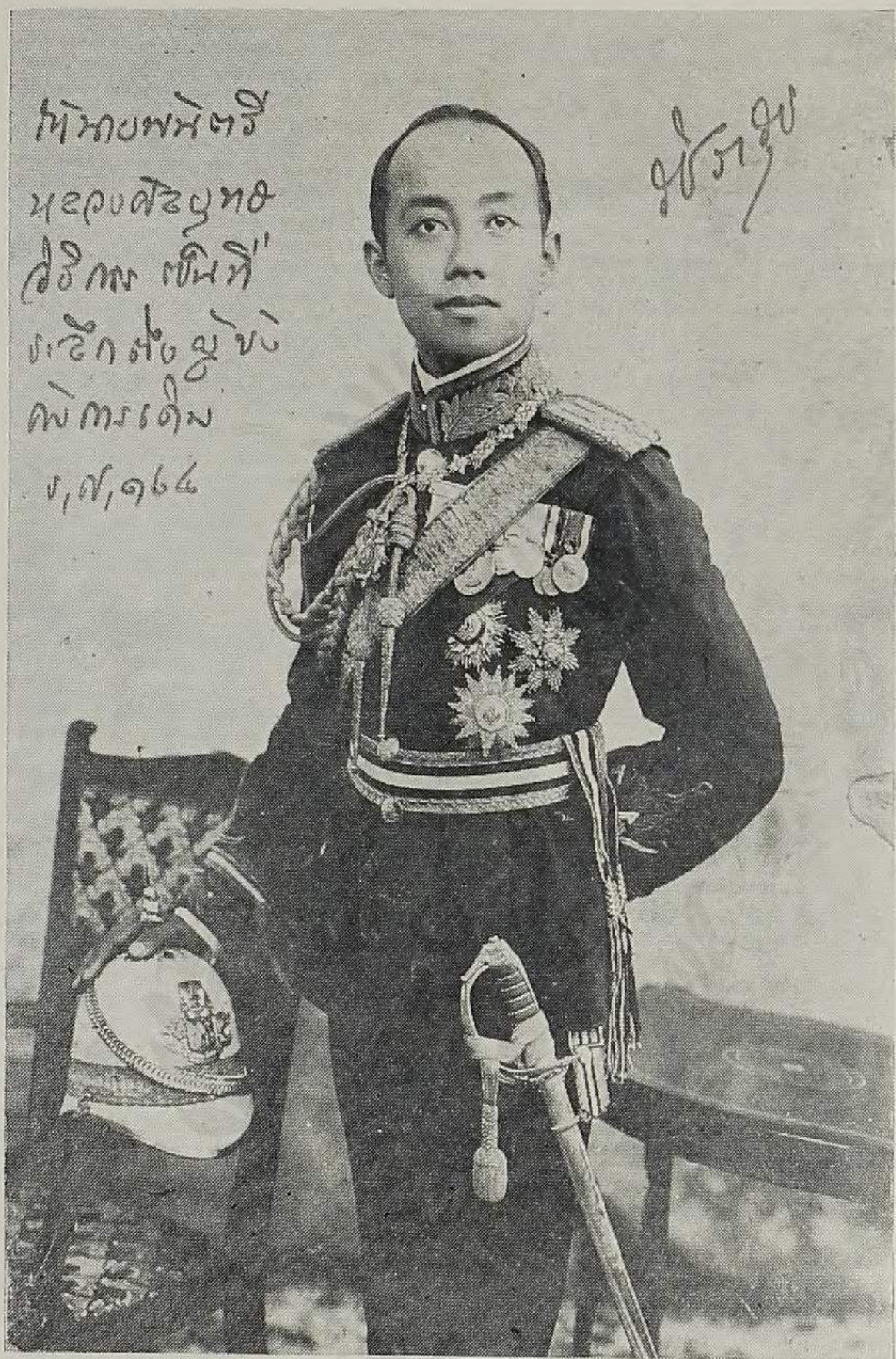
พระบรมฉายาลักษณ์ พระบาทสมเด็จพระมงกุฎเกล้าเจ้าอยู่หัว พระราชทานพลโท พระยาเกล้าโหมราชเสนา เมื่อยังดำรงพระราชอิสริยยศ เป็นสมเด็จพระบรมโอรสาธิราช มกุฎราชกุมาร