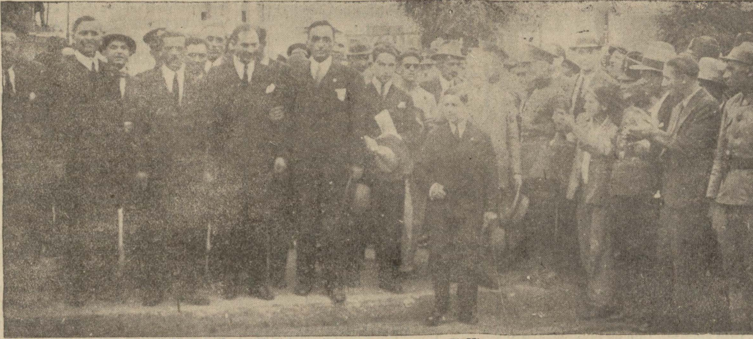
Hava kahramanları Taksim zafer abidesi önünde halkın alkışları arasında

Dün akşam Amerika sefaretinde bir gardenparti, gece Belediye tarafından muhteşem bir ziyafet verilmiştir