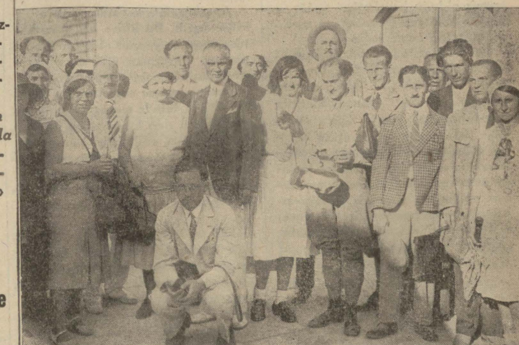
Saygınlık vapurdan çıktıktan sonra

53 Çekoslovak seyyahı Muallim, doktor ve tüccarlardan mürekkep bir grup dün İstanbul'a geldi