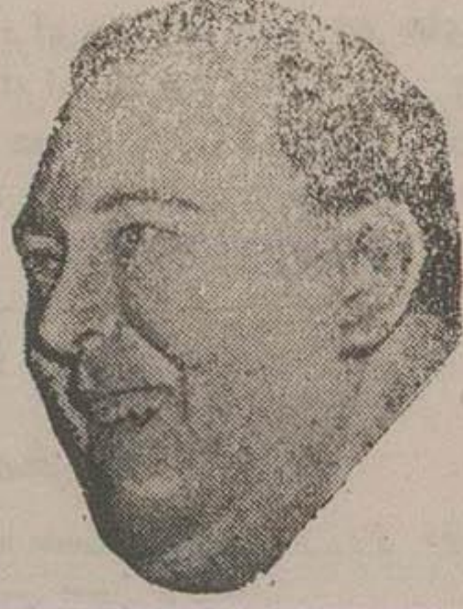
«لی» دبیرکل سازمان ملل متحد،

ژنرال یسیم استالین خواستار صلح عمومی است ژنرال یسیم استالین، مسافرت «تربگولی» را یک ابتکار خطرناک تلقی کرده است «لی» جدا طرفدار «ماتوسه تونک» و خواهان عضویت چین کمونیست در سازمان ملل متحد میباشد