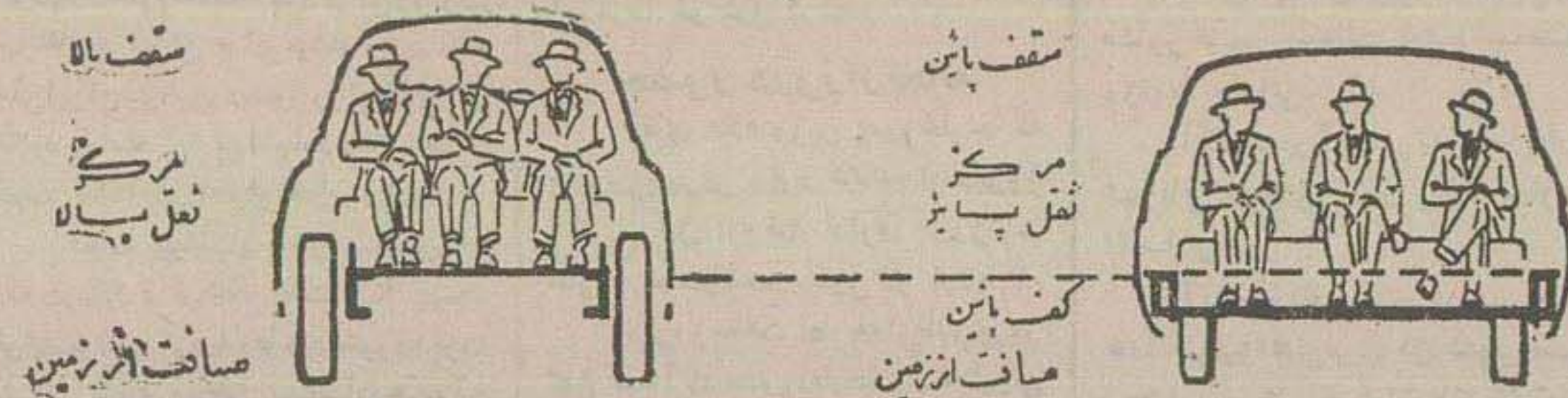
هو ر ش ر ، صافت از زمین ، صافت از زمین

یک اطمینان در راحتی بی مانند شما عطا میکند