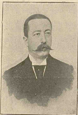
D-I CATTON G. LEGGA

Actualul prefect al județului Bacău e un vechi funcționar administrativ: fost prefect al județului Bacău, fost prefect al poliției Capitalei și iarăși, o dată cu revenirea partidului liberal la putere, în capul județului de obârșie.