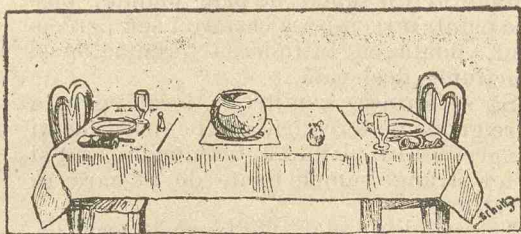
In luna a șasea !...