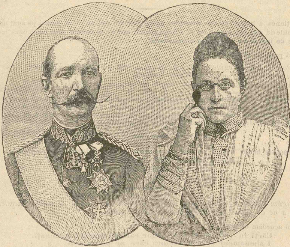
MM. LL. REGELE GEORGE și REGINA OLGA a GRECIEI

* Publicație enciclopedică ilustrată.— Redactată de un comitet *