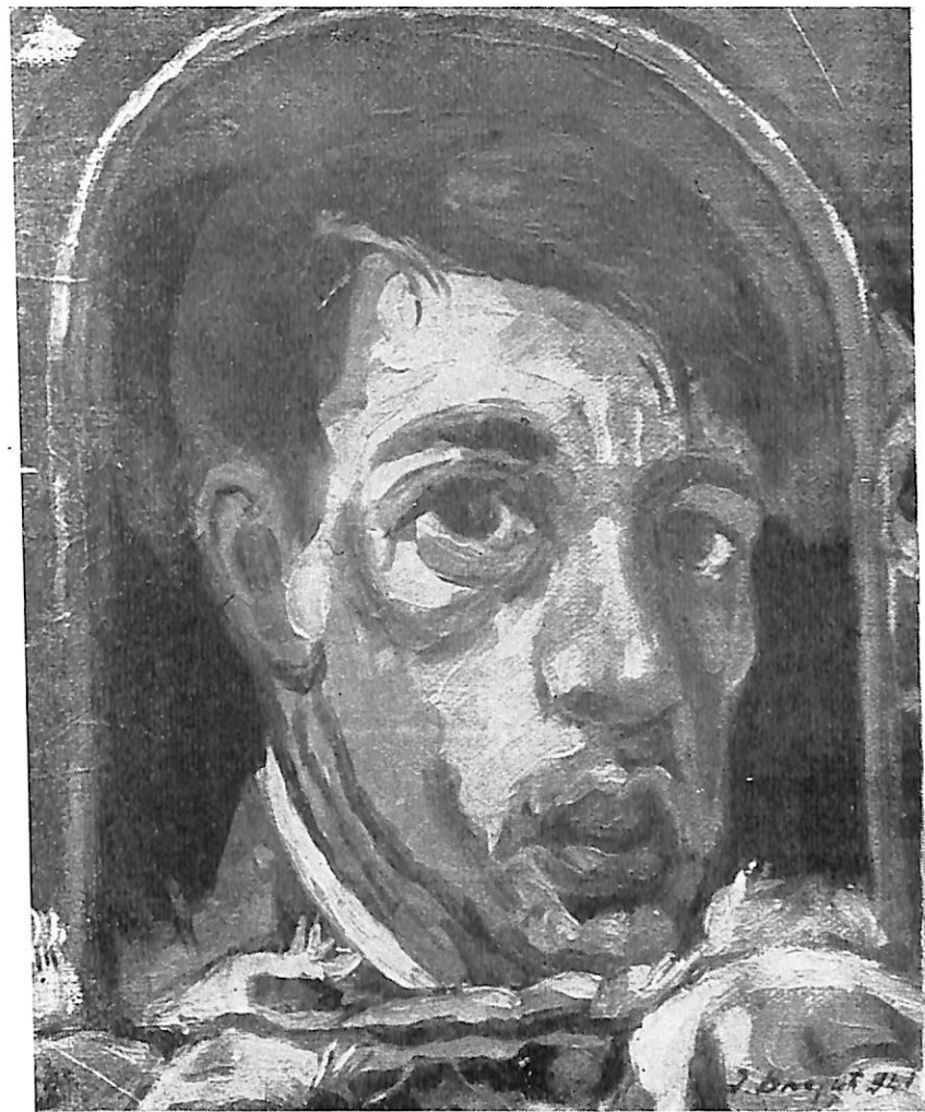
АУТОПОРТРЕТ (уништен 1941 — уље)