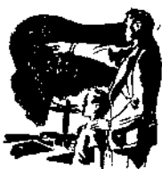
對付小孩的時候，切忌大發雷霆。心平氣和才能引起小孩的敬重。

(二)在生理方面：女人之中，常因患有『外陰瘙癢症』(Pruritus)，『濕癬症』(Eczema) 『陰蝕症』(Pediculosis Pubis)，以及生殖器局部所生的其他皮膚疾病。這些都是必須就醫的。因為這些疾病，常常引起搔摸而漸漸養成了手淫的習慣。男性之中，常因包皮長緊，為衣褲接觸而生快感，致招手淫。所以包皮過長，則亦必須割治。此外，關於家庭教育方面的，如生殖器必須保持清潔，睡前務使蓄尿排盡，以免膀胱增加緊張，刺激興奮。再者，即為實行『醒後即起』的習慣，不宜寂臥床上，無所事事。縱然偶犯，父母師長們亦不可對他們加以恐嚇，說出手淫能致愚癡瘋狂等等騙人嚇人的話，或對他們施以武力的限制，嚴厲的責罰。如果那樣實行，則反容易引起他們對生殖器的特別注意而發生反感。總之，治療手淫的要素，簡括的說來，是要導性力於正軌，引思想於正途，增加朋友間的情誼，減少獨處的機會，努力於事業的工作，則結果一定可以治愈。