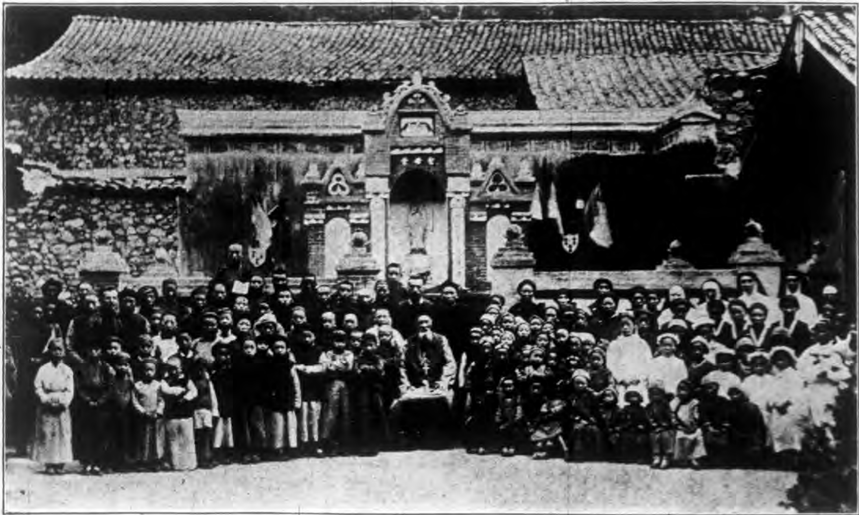
西 藏 打 箭 鑪 慶 祝 新 聖 母 堂 落 成