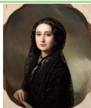
Carolina Coronado, escritora estremeha