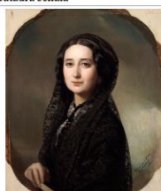
Carolina Coronado, escritora estremeha