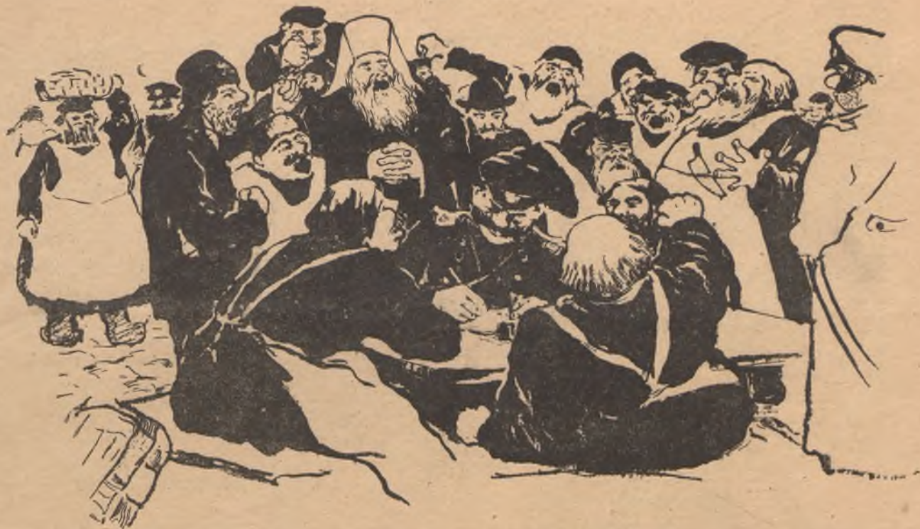
Священики составляют прокламацию.