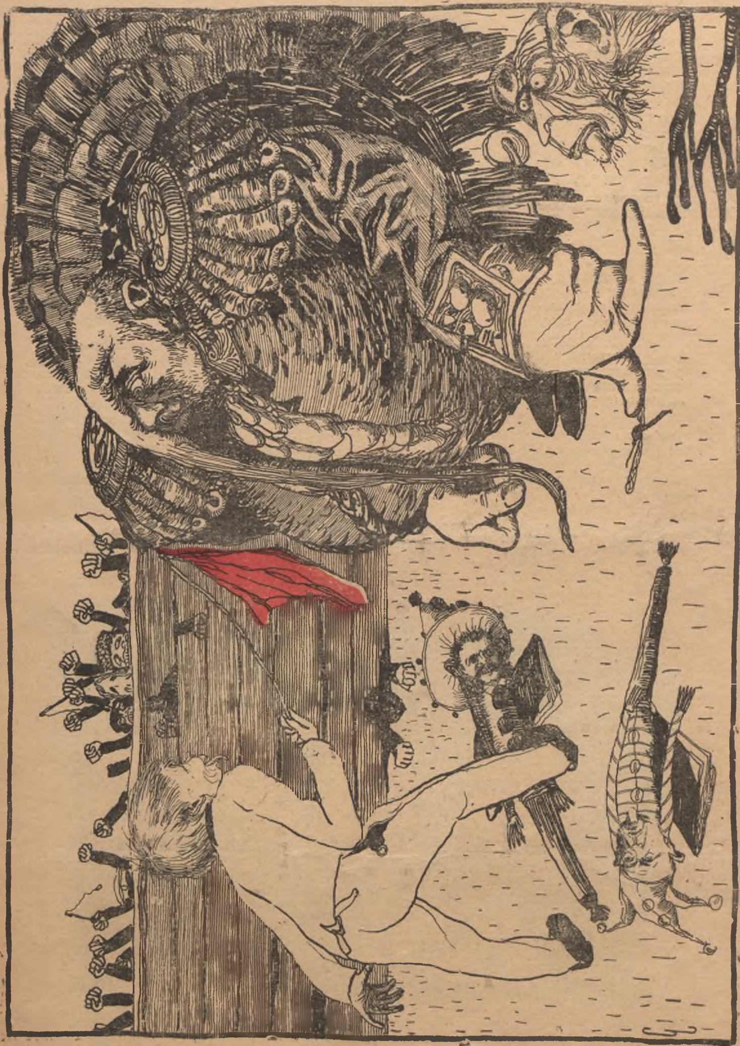
Въ царствѣ итицѣ: Илѣякт-Треповъ и общинаный цыпленокъ Побѣдоносецъ. На землѣ валяются брошенныя куклы-палцы и спиія оболочки. Изъ-за забора глядятъ власти.