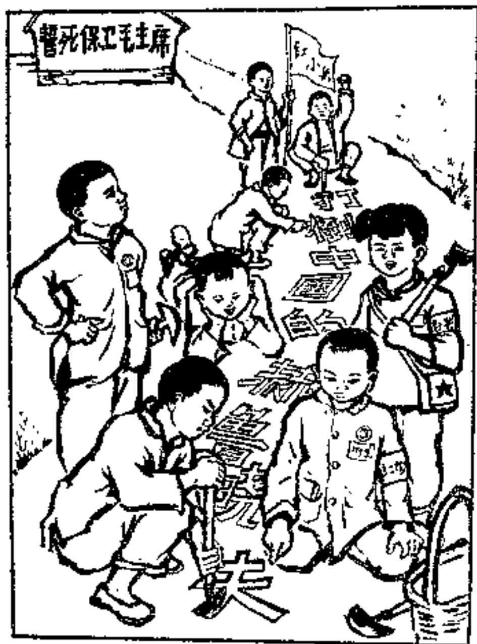
韩村的儿童积极投入无产阶级文化大革命， 他们正在路上刻写大标语。