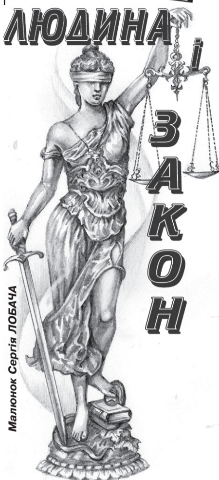
Малюнок Сергія ЛОБАЧА