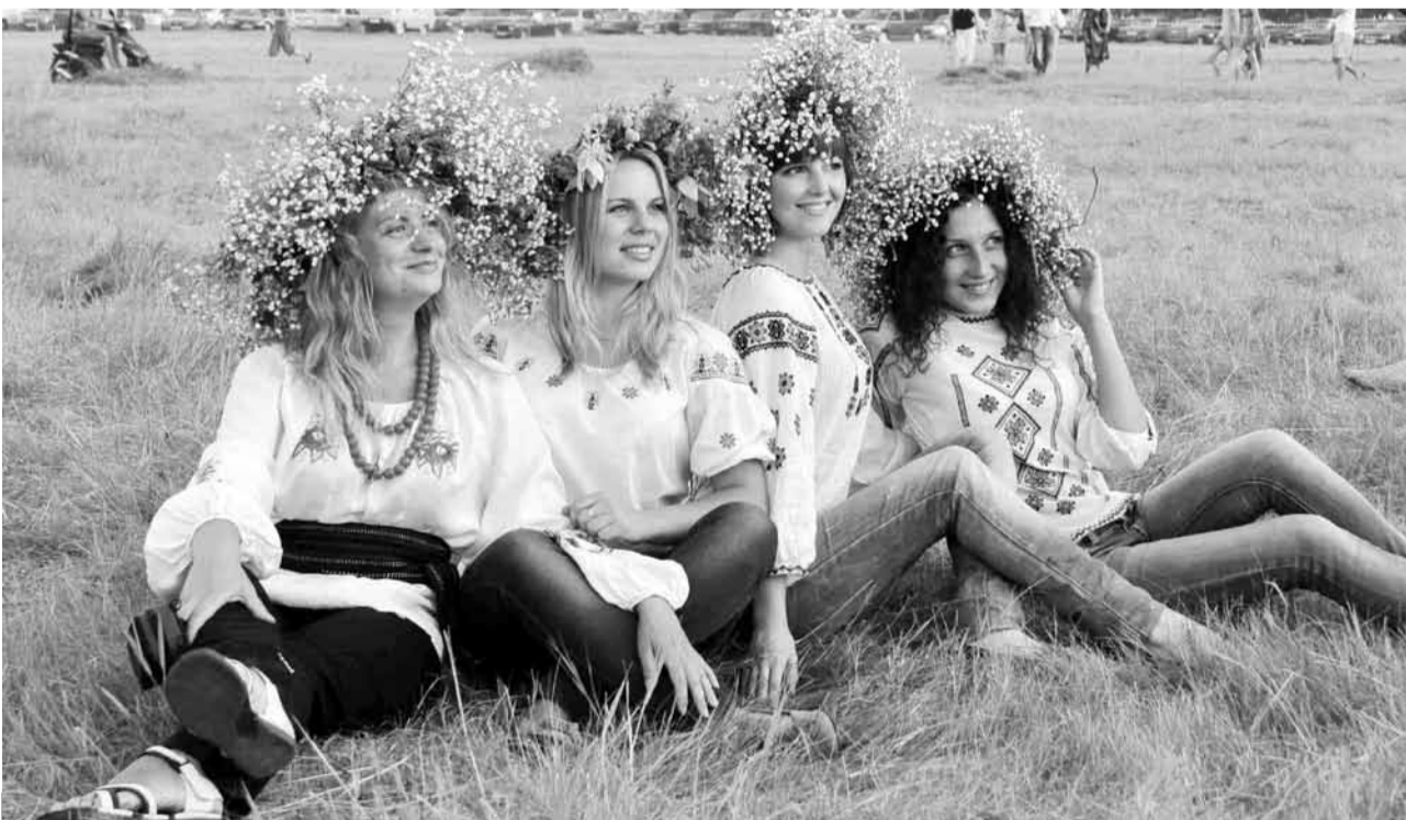
Ой на Івана та й на Купала поплив віночок та й за водою, серце дівоче забрав з собою (Гавронщина).