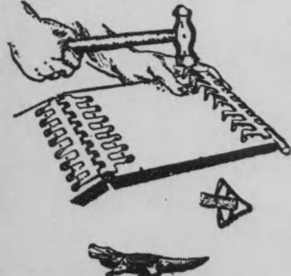
Alligator Steel Belt lacing