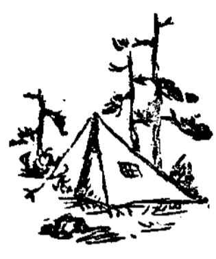
卅六、七、卅改舊作于臺北