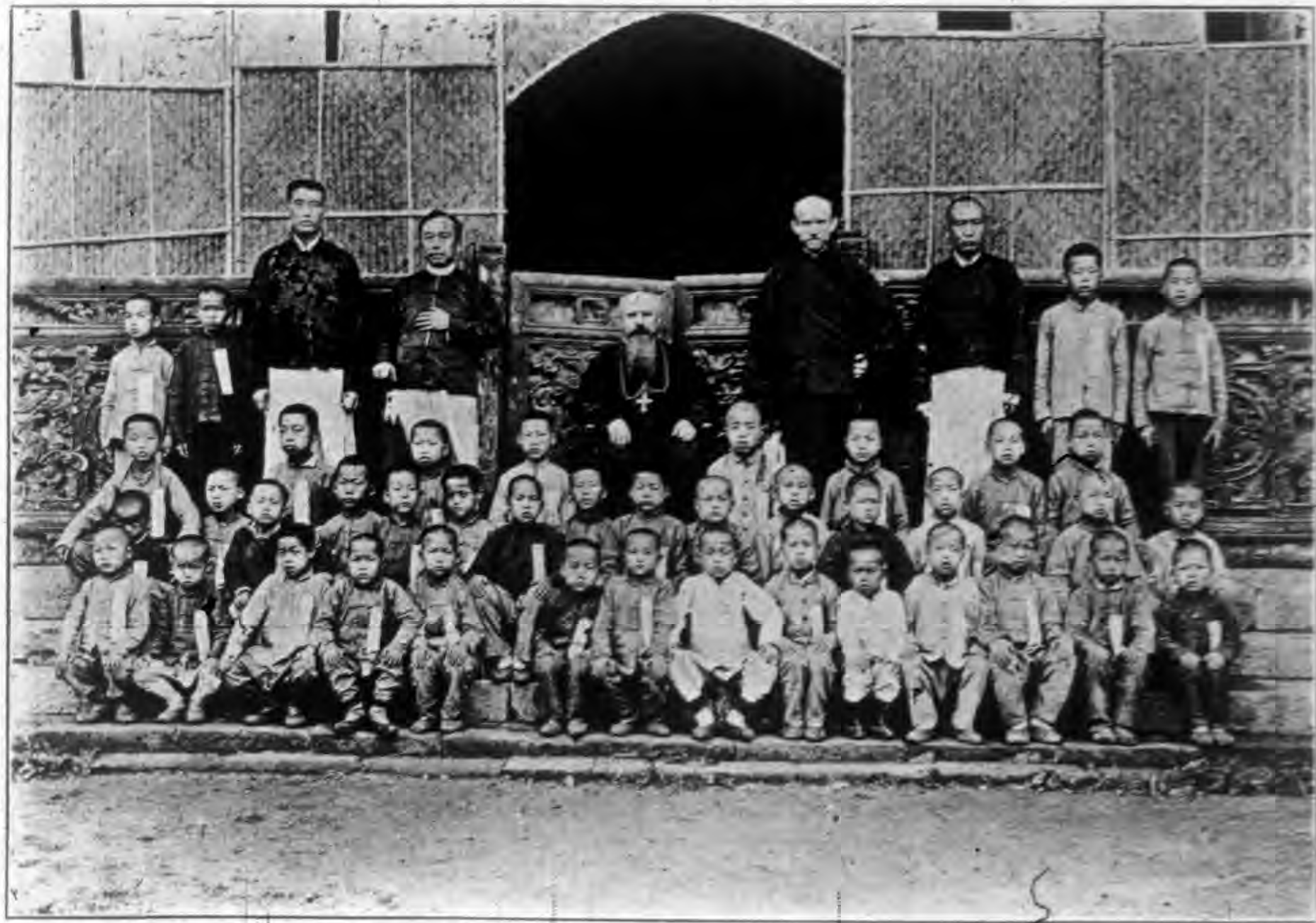
湖 北 黃 州 小 學 校 攝 影