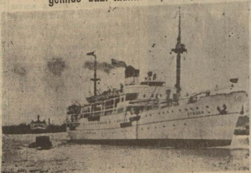
(Yazısı 3 inçide)

Süratin matlup seyri elde edilebilmesi için gemide bazı tadilat düşünülüyor