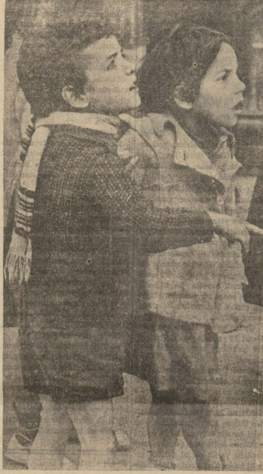
Üç gün zarfında şehre atılmış so biz defa tayyare bombardımanına karşı tedbir almak için düdüklüler çalınarak tehlike işareti verilmiştir.

Altında da Başvekil, arkadaşlarıyla beraber, son toplantıyı yapmakta