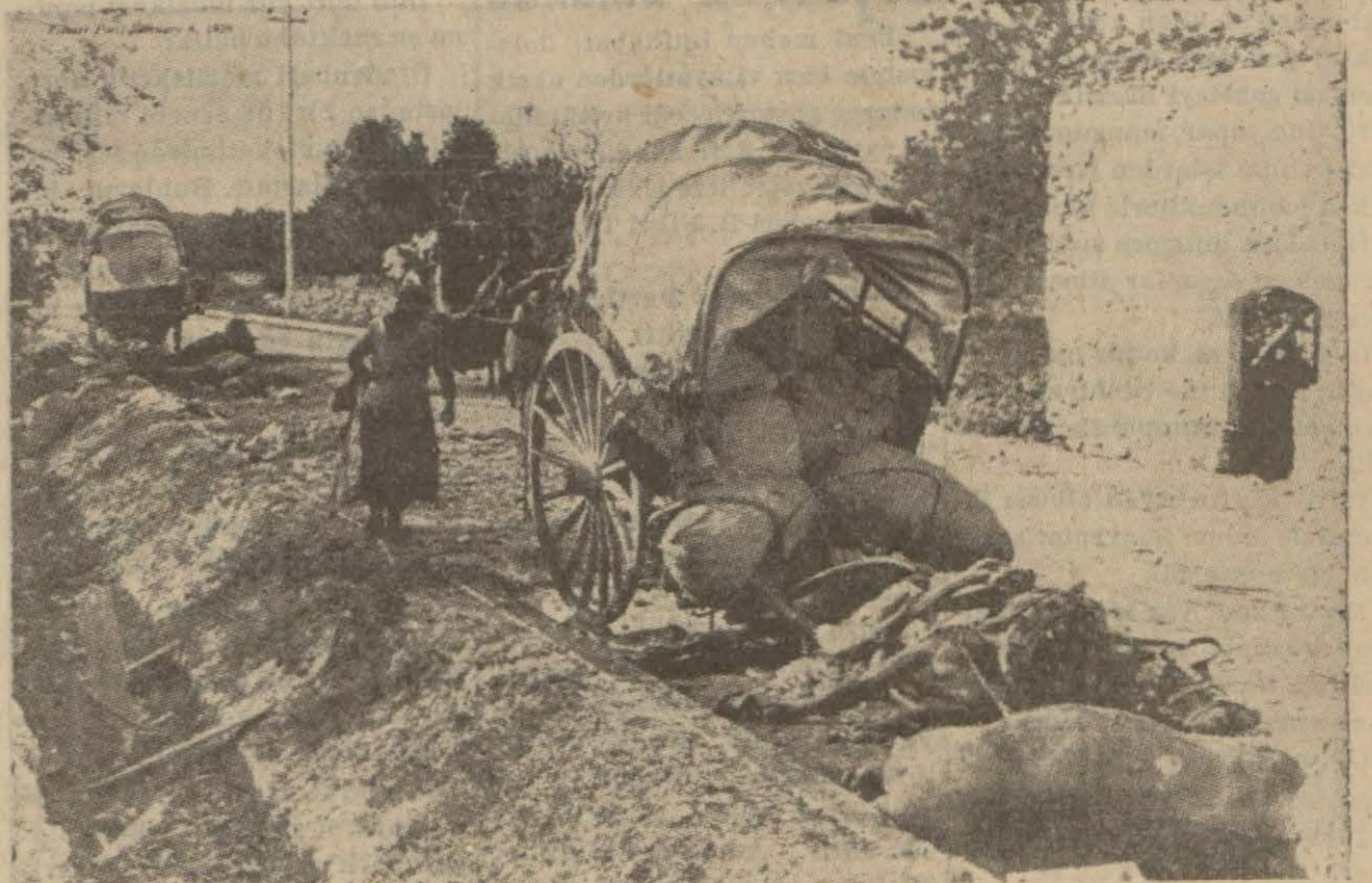
Fransaya kaçarken atla rın aç kalıp ölmesi üzerine yolda kalan arabalar