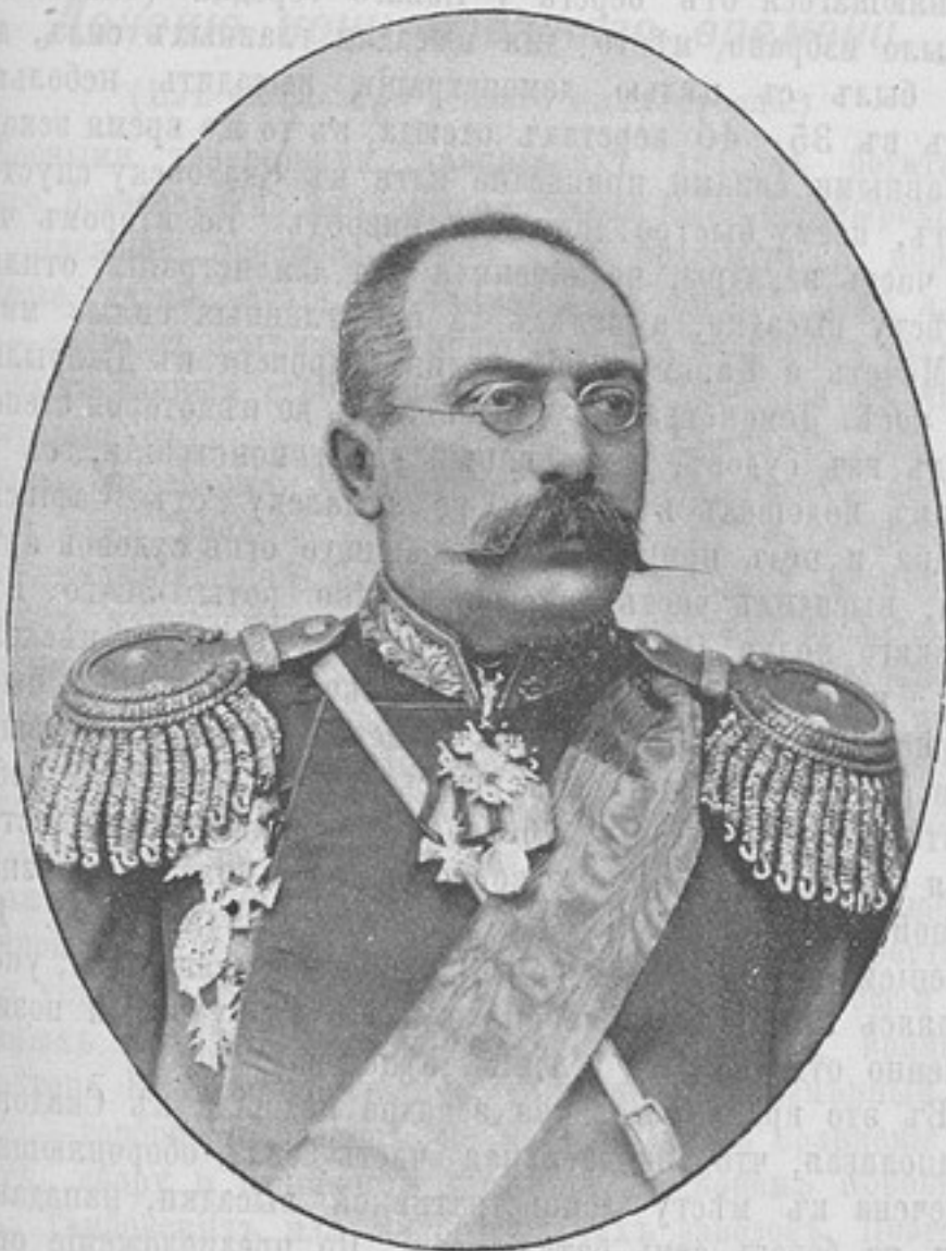
Командующій 2-й кавалерійской дивизіей, генераль-маіоръ

(смотри «Развѣдчикъ» № 363, отъ 30 сентября, стр. 845).