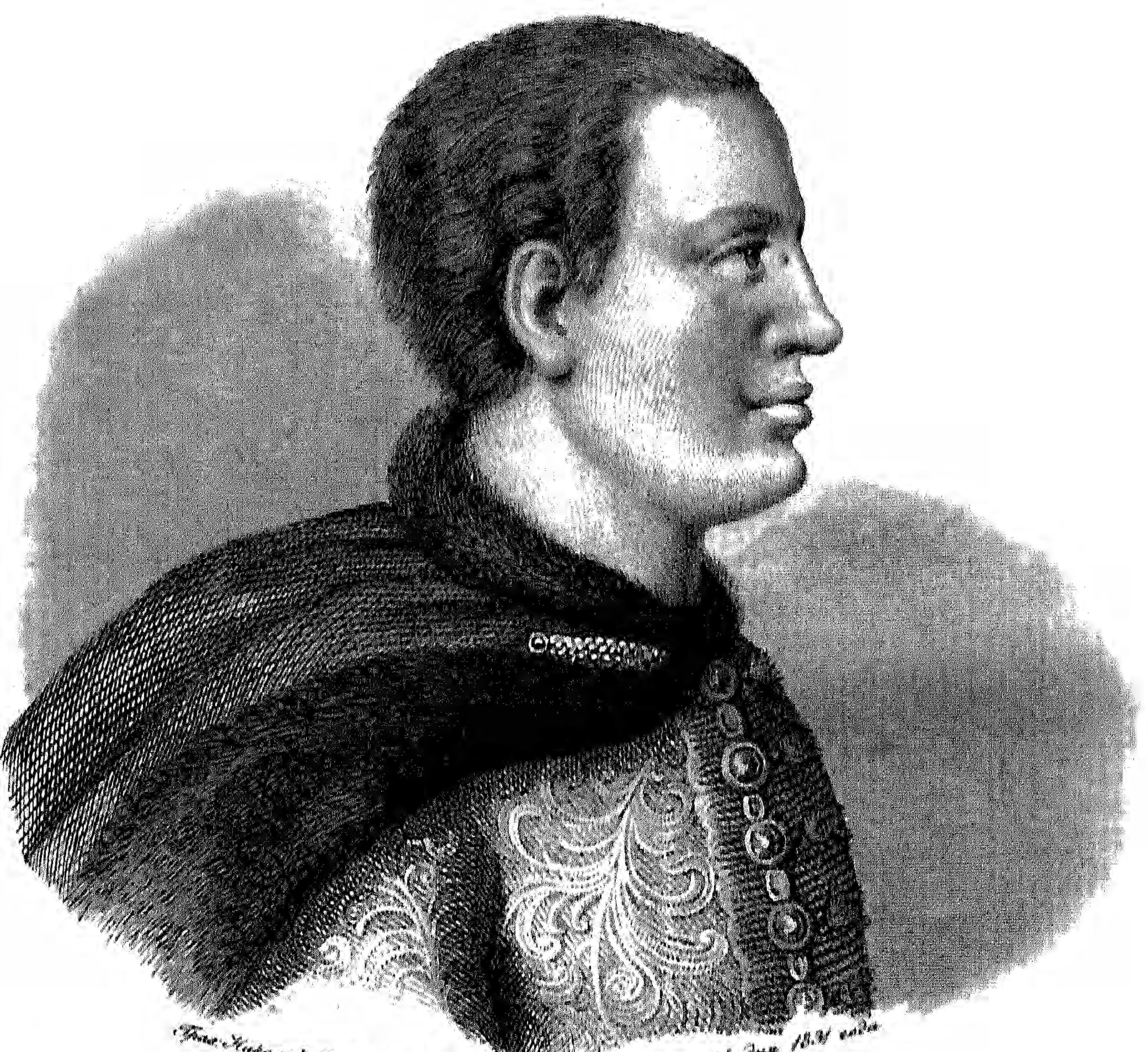
Портрет Князя Михаила Михайловича Голицына. Гравировано М. Ш. Смирновым. Москва 1854 года.