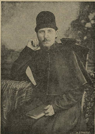
Преосв. Арсеній еп. Уральскій.

Погребеніе епископа Арсенія. (Отъ нашего корреспондента). 14 сентября торжественныя литургійныя звуки смѣшались томнымъ печальнымъ мотивомъ погребенія надъ тѣломъ почившаго исповѣдника Христова епископа уральскаго Арсенія. Четырнадцати, свящ., два діакона во главѣ съ еп. Иннокентіемъ воздали послѣднюю почесть святителю. Архієпископъ отсутствовалъ, потому что не былъ своевременно