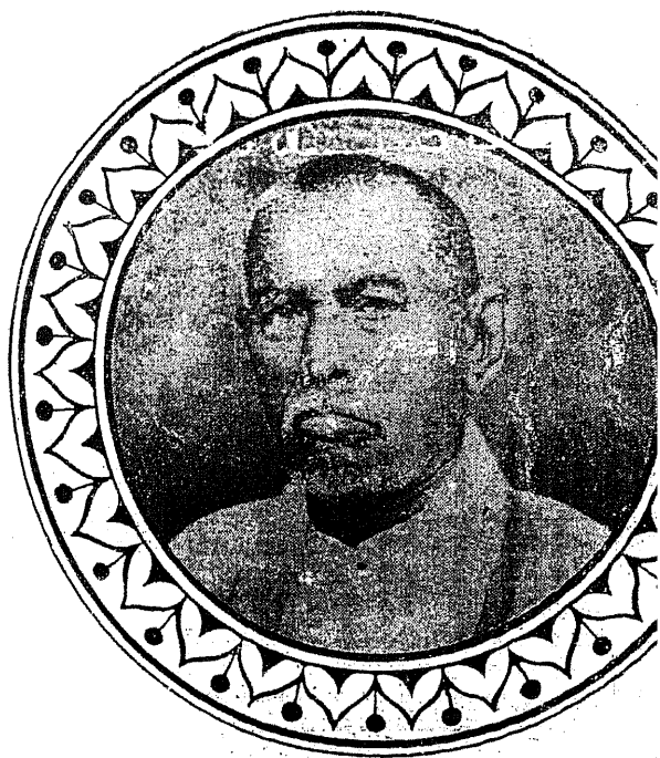
சதாவதானி கா. ப. ஷெய்குதம்பிப் பாவலர்