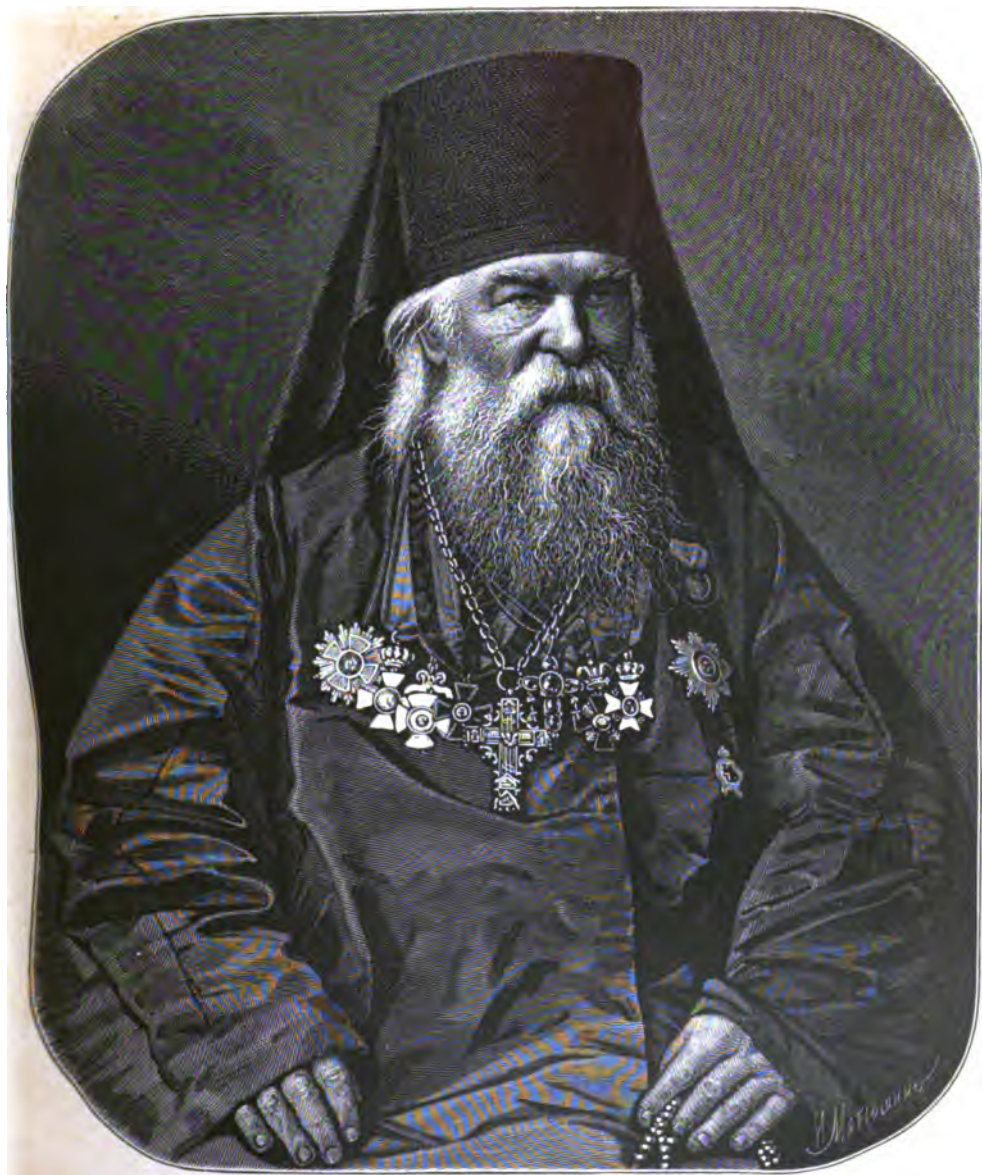
АРХИМАНДРИТЪ ИГНАТІЙ МАЛЫШЕВЪ, НАСТОЯТЕЛЬ СЕРГІЕВСКОЙ ПУСТЫНИ, СОСТАВИТЕЛЬ ПРОЕКТА ХРАМА ВОСКРЕСЕНІЯ ХРИСТОВА ВЪ С.-ПЕТЕРБУРГѢ НА МѢСТѢ СОВѢТІЯ 1-ГО МАРТА 1881 Г.