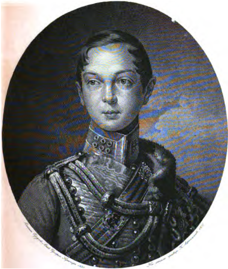
НАСЛѢДНИКЪ ЦЕСАРЕВИЧЪ АЛЕКСАНДРЪ НИКОЛАЕВИЧЪ ВЪ 1833 Г.

ПРИЛОЖЕНИЕ КЪ «РУССКОЙ СТАРИНѢ» ИЗД. 1885 Г.