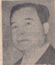
پرس سونائوری رهبر