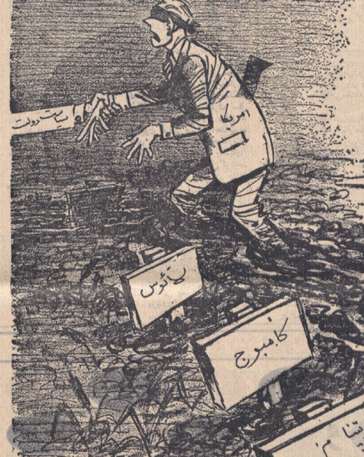
معلمین هستی که این راه‌خروج از مرداب هندوچین است