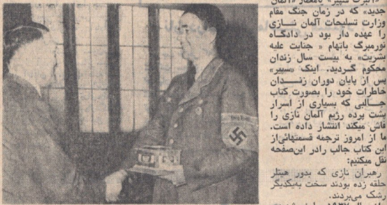
آلبرت اسپیر، وزیر تسلیحات آلمان نازی

«آلبرت اسپیر» نامدار «آلمان جدید» که در زمان جنگ مقام وزارت تسلیحات آلمان نازی را بر عهده داشت، در این کتاب خاطرات خود را در مورد تجربیاتش در این دوران بیان کرده است. او یکی از اعضای کلیدی رژیم نازی بود و نقش مهمی در توسعه صنعت تسلیحات آلمان در آن زمان ایفا کرد.