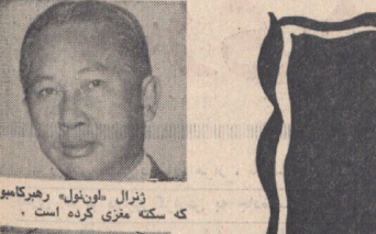
ژنرال یونپول رهبر کورئیا