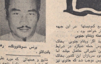
پرس سونائوری رهبر