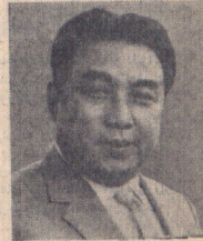
شمالی کمالی سونگ رهبر گره