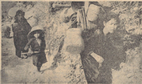
از هنگام جنگ در جنوب لائوس تاکنون ۲۰ هزار نفر از مردم این نواحی خانه و زندگی خود را رها کرده و فرار کرده اند . در عسکری خانواده در حال فرار دیده میشود . مادر کله انا تبه خود را بدوش گرفته ، پسر کوچک خانواده کلنگی بدست دارد و دختر ، کودک خانواده را بغل گرفته است و از پشت سر آنها تنها خوک این خانواده حرکت میکند .