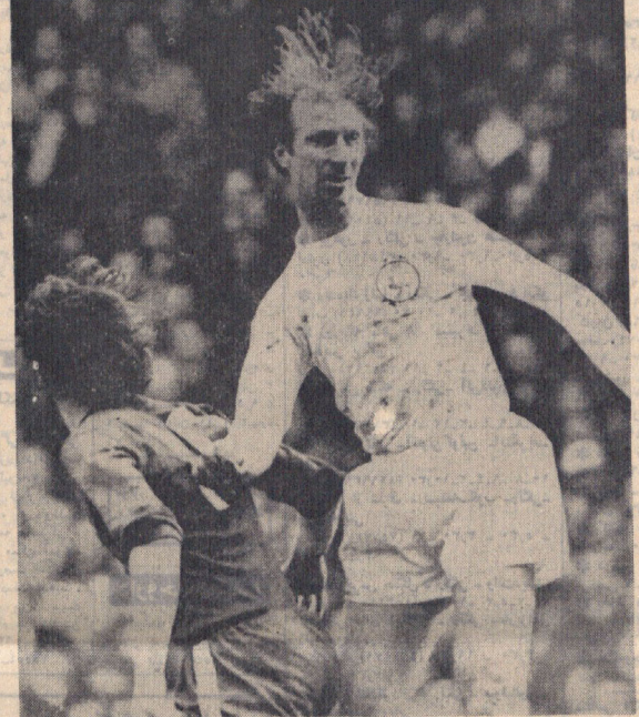
لیدر تیم پيستاز مسابقات فوتبال فوتبال ملی دسته اول باشگاه های انگلستان در پنجمین روز بازی جام حذفی باشگاه ها دچار ناگامی بزرگی شد، در این روز در شهر کولچستر با نتیجه ۳-۲ لیدر مغلوب تیم گشتام کولچستر شد از دور بازیها حذف گردید.

چای دارد با این پیروزی عجیب لیدر پيستاز انگلیس مسابقات جام حذفی اکنون بموان یکی از همتا تیم دوریک چهارم پهلای مسابقات بر کیده شده است! آرامش برای اورتون و لیورپول تیم دیگر گروه چهارم بر نشود در دیدار با تیم پيستاز گروه اول باشگاه‌ها هول سیتی، با گل که در دقیقه دهم وارد دروازه هول سیتی کرد میرفت که دو دین شکستی بزرگ این روز بازی را خلق کند، چه گلی که با پیروزی فوروارده برتوند در دقیقه دهم به نامرسانید در غین برتری کامل این تیم دسته چهارم پيستاز آمد! بدلیل حادثه‌ای که در آخرین دقیقه نیمه اول برای این ملگشتی دروازه بان خوب هولچستر رخ داد در دقیقه ۲۶ وقت اول در کولچستر بازی می کند سون گل را وارد دروازه لیدر کرد!