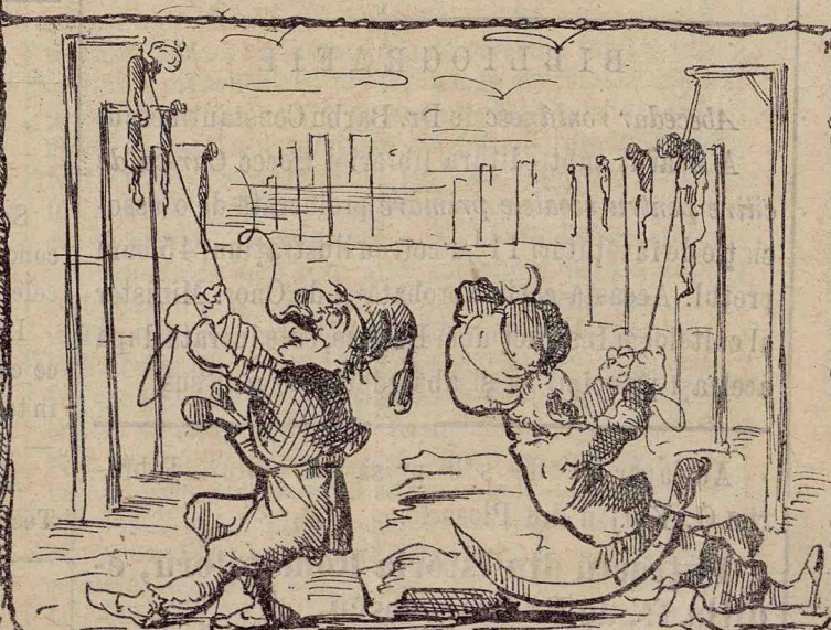
Ei vorū să se spāndure unūlū pe altulū!