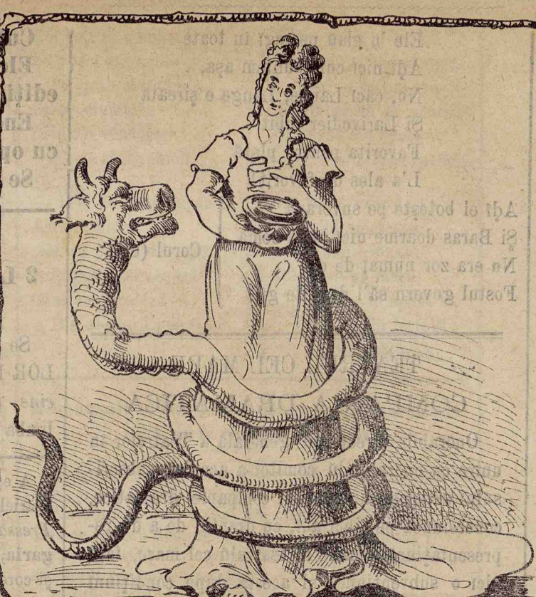
— Eu te-amū crescutū și hrănitū la sânulū meu și tu, ingrâte, vrei să mă inveninezi?