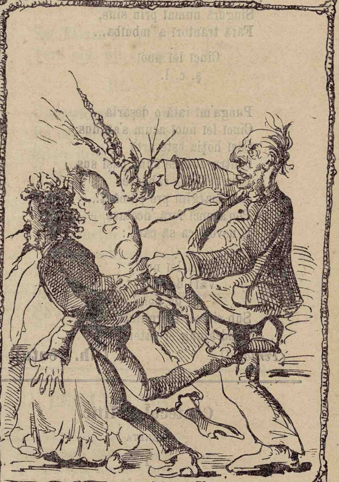
Scene de Bulevardū.