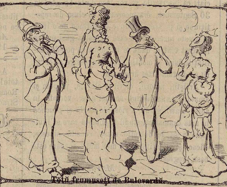
Totū frumusețē de Bulevardū.