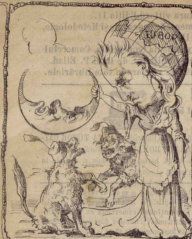
De sigură că căteii ară înhăța-o de nasu daca cuconița n'arū ține-o de motū.