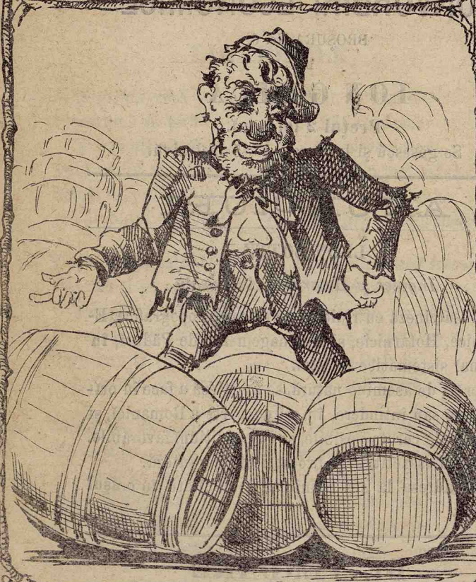
La dracu, cândū să le deșertū, că prea s'a făcutū multū?!