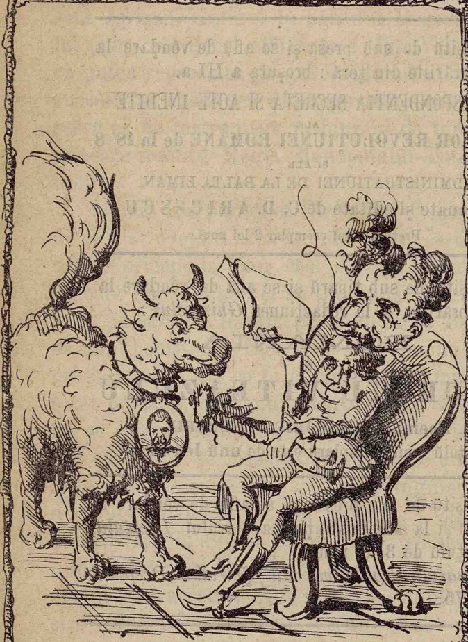
Cainele Boerescu, își primescē rāsplata stāpēnului.