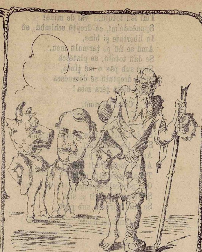
— Veđi amice câtū de fericitū amū făcutū noī pe Romānū?