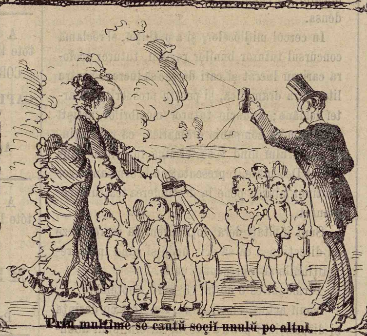
Pînă multīme se cautū soeii unūlū pe altul.